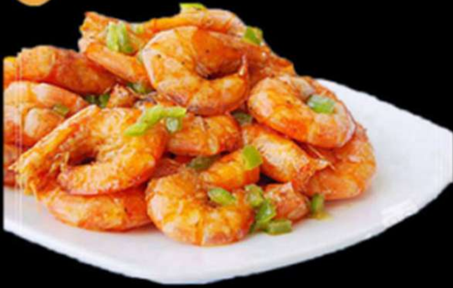
27.GAMBES AMB SAL I PEBROTS (6u)

Gambes, pebrots, ous i cebes fregides Gambas, pimientos, huevo y cebolla fritas