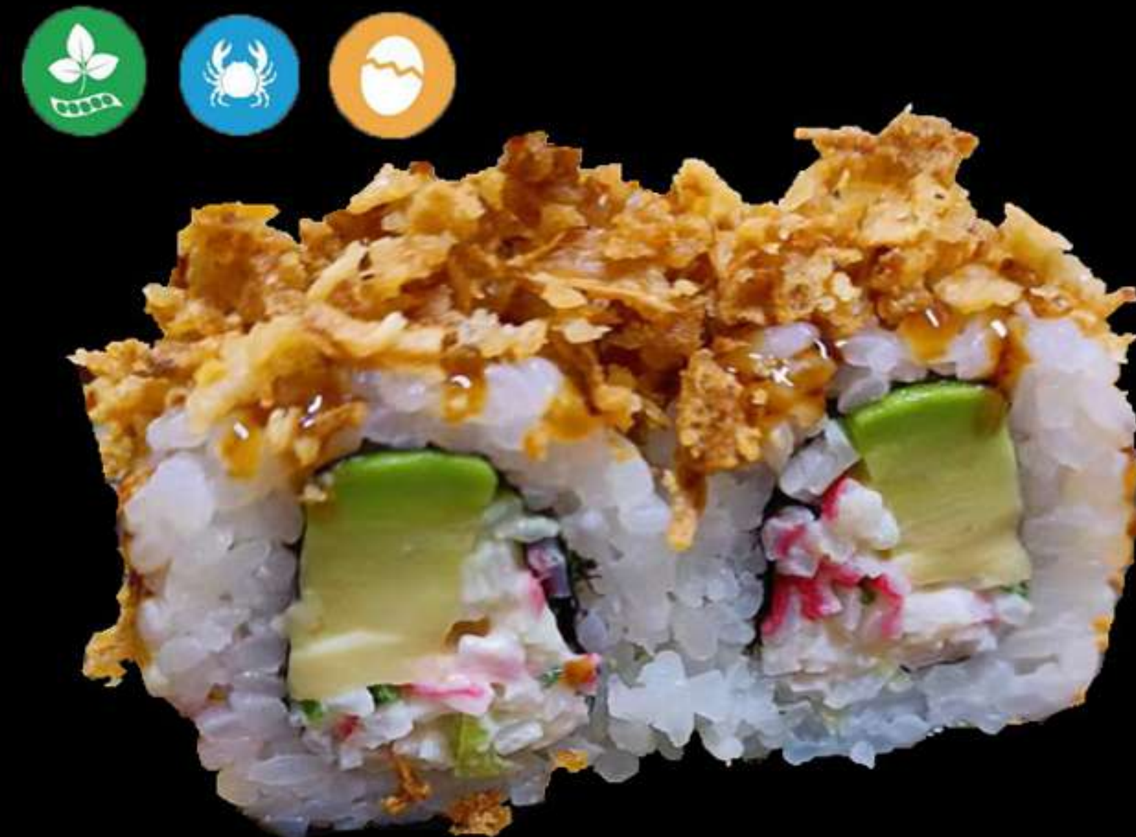
122. CALIFORNIA MAKI CEBA FREGIT(4u)

Salmò, alvocat, formage i ceba fregit Salmon, aguacate, queso y cebolla frita