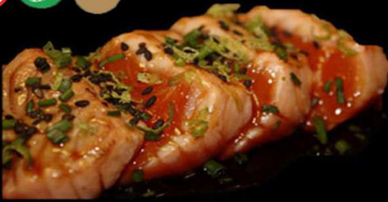
113. TATAKI DE SALMÓ (4u)

Salmó fresc flamejal amb salsa Salmón fresco flameado con salsa