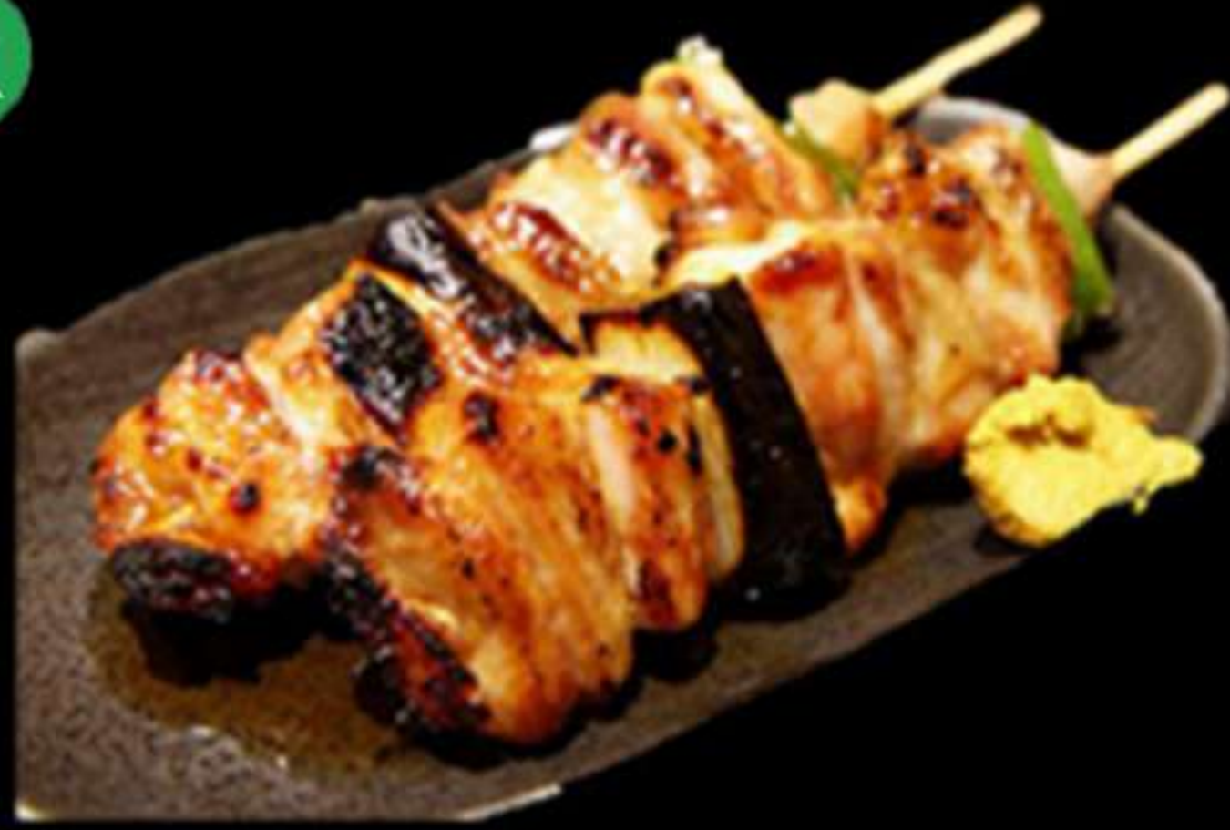
56. BROQUETES DE POLLASTRE (2u)

Pollastre amb salsa teriyaki Pollo con salsa teriyaki