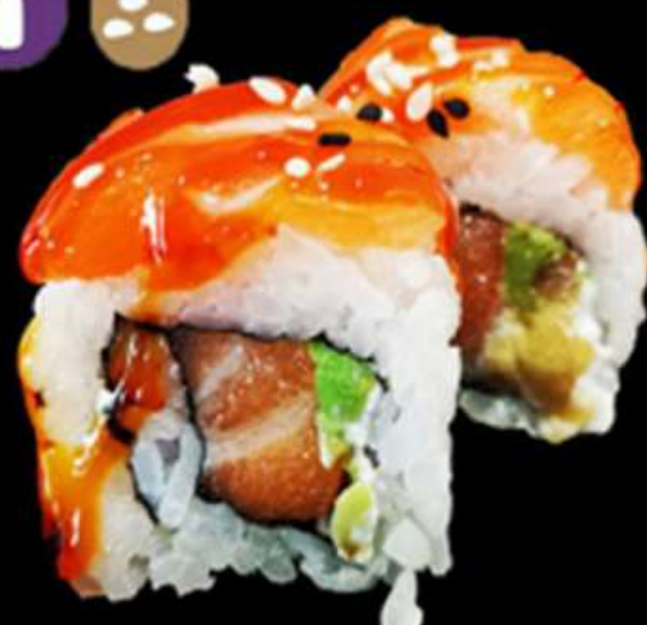
77.HANA MAKI SALMÓ SÈSAM (4u)

Salmó, alvocat, formatge PHL i sèsam Salmón, aguacate, queso PHL y sésamo