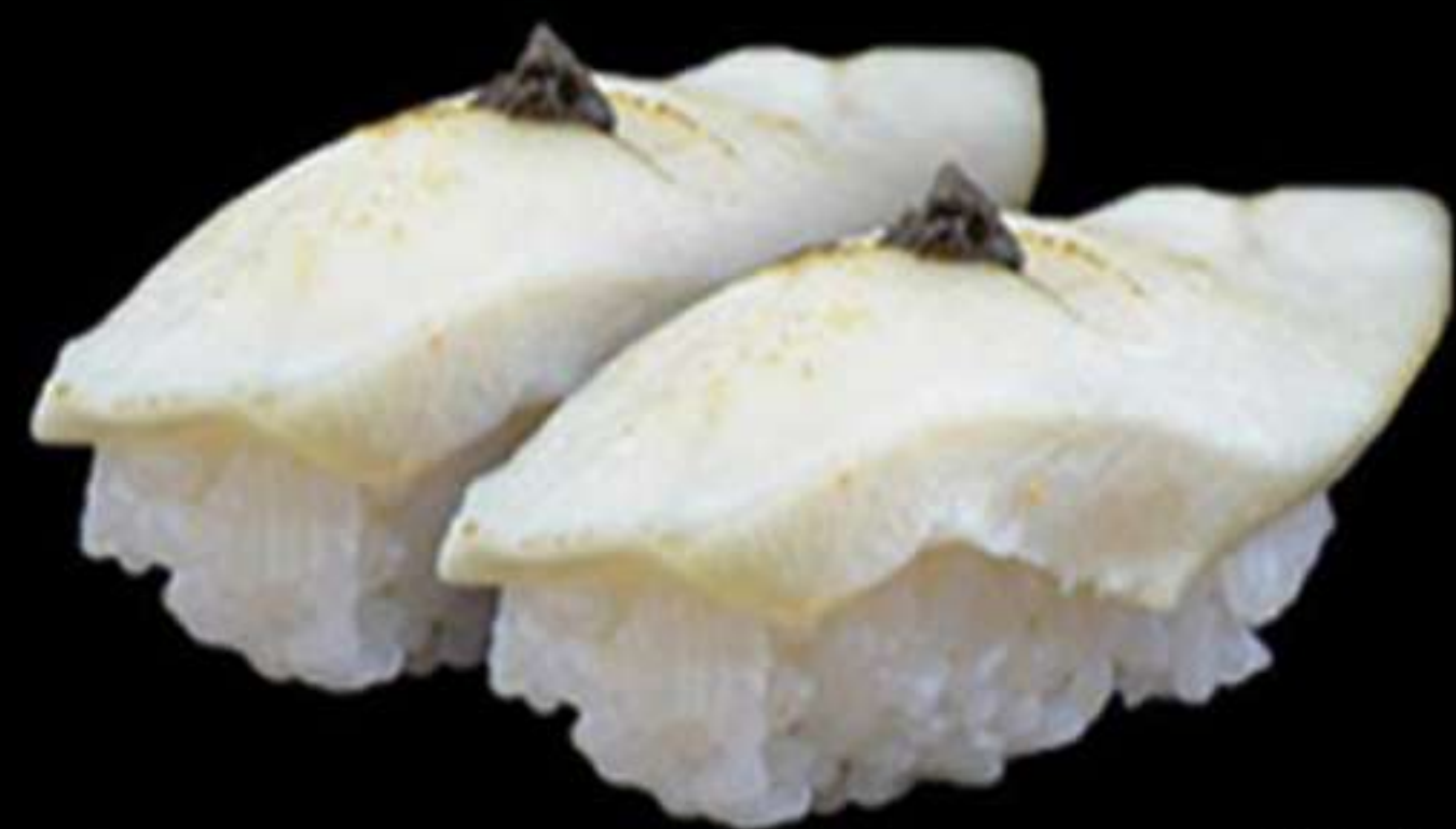
64.NIGIRI DE PEIX MANTEGA (2u)