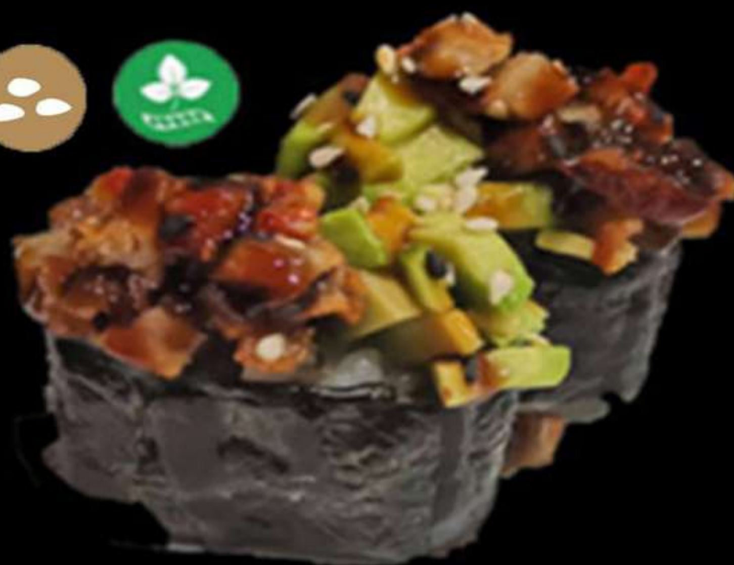
107. GUNKAN DE UNAKI(2u)

Anguila, alvocat i salsa d anguila Anguila, aguacate y salsa de anguila