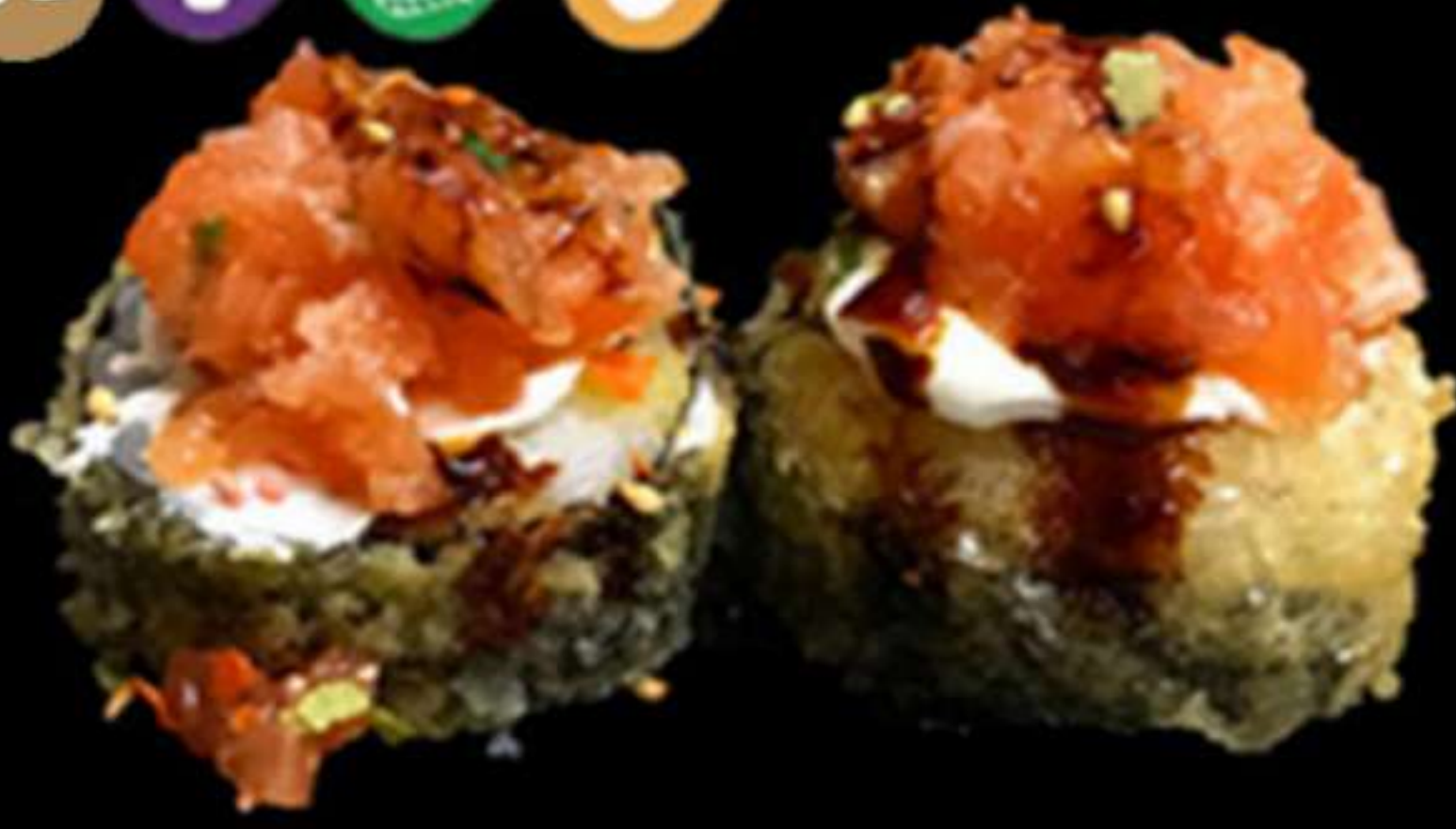
103. FOTO MAKI GREGIT SALMON(5u)

Cogombre, mango, alvocat, formatge PHL Pepino, mango, aguacate, queso PHL