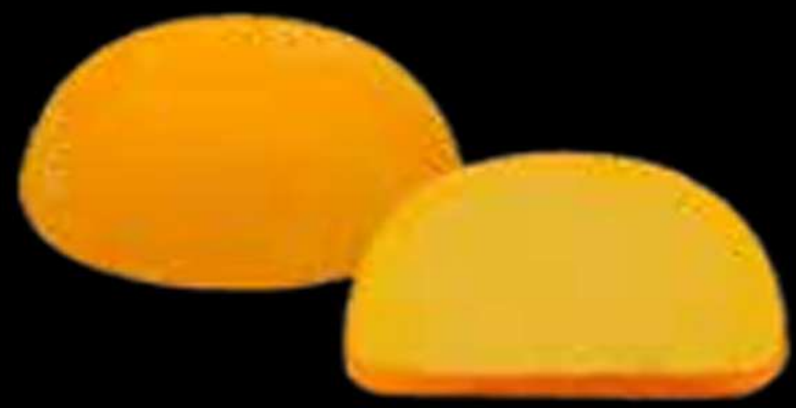
Mochi de mango..... 4.50€ Mochi de mango