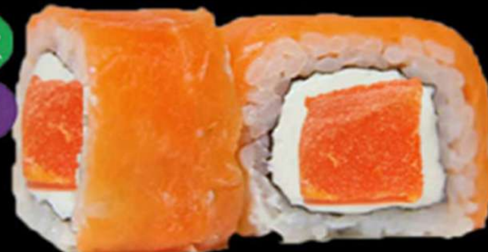
94. ORANGE ROLL (4u)

Papaia, salmó i formatge PHL Papaya, salmón y queso PHL