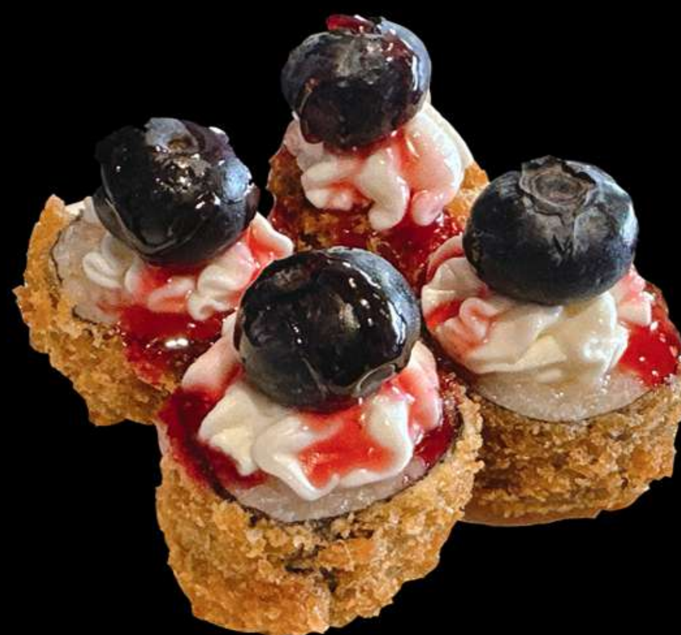
70A.MAKI SALMÒ FREGIT AMB NABIU(4u)

Salmò, ous, i nabiu Salmon, huevo y arándano