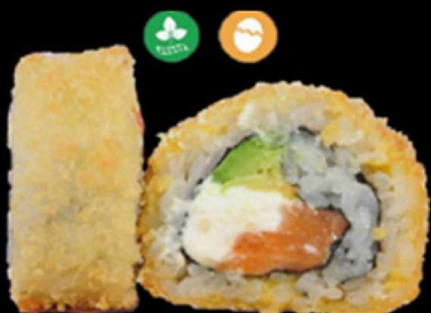
101. HANA MAKI FREGIT (4u)

Pollastre, ous i formatge PHL Pollo, huevo y queso PHL