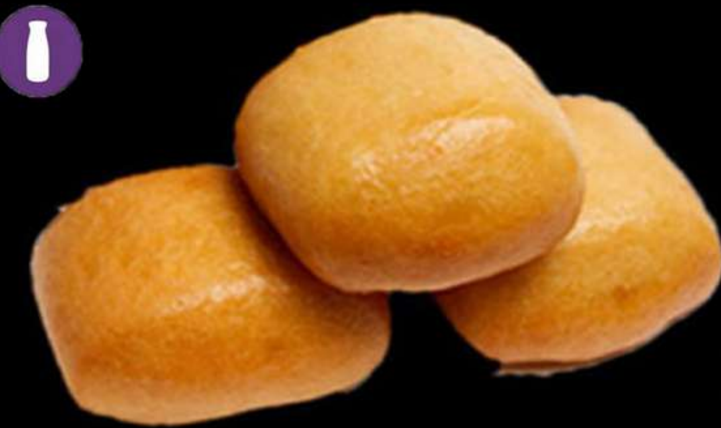
15. PA XINÈS FREGIT (2u)

Farina d'arròs, carbassa i sèsam Harina de arroz, calabaza y sèssamo