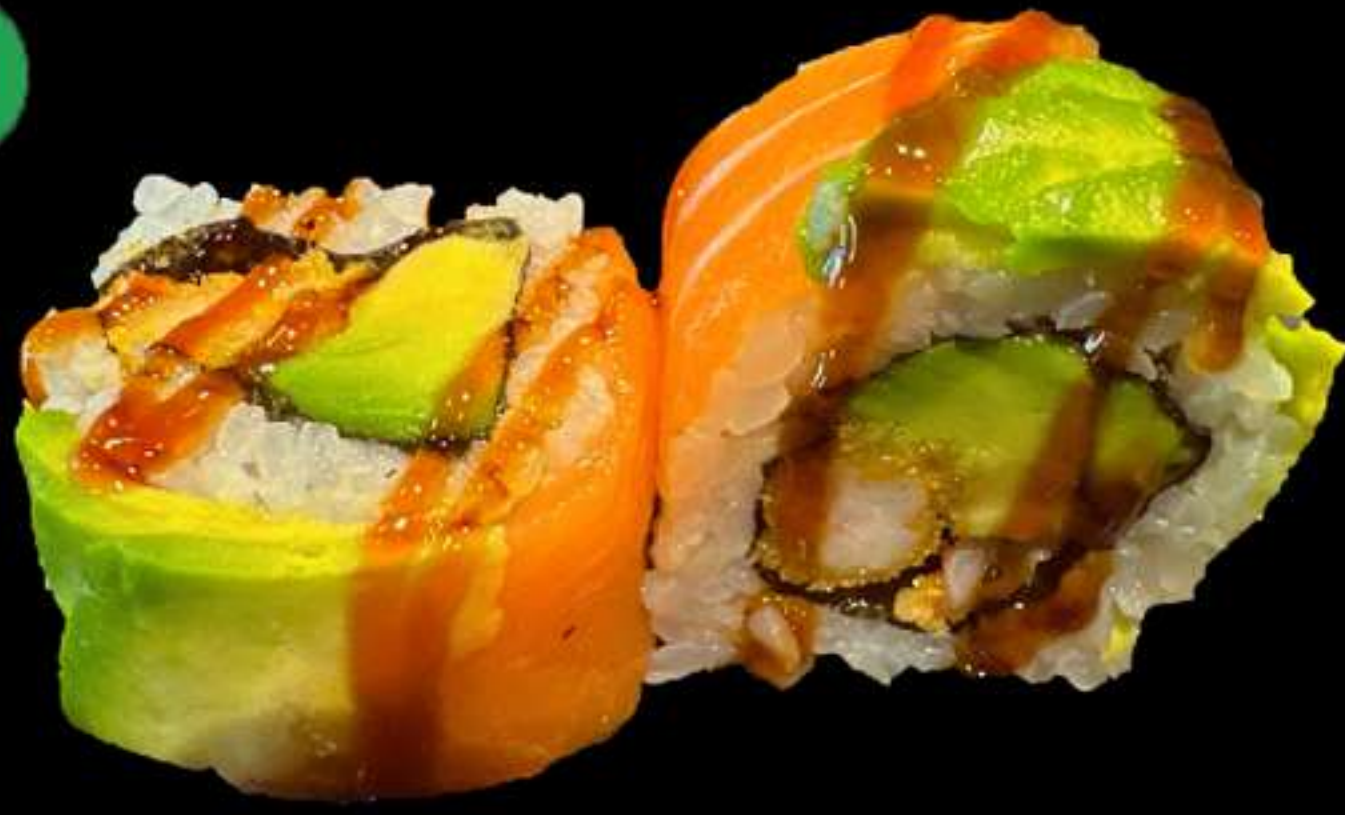
87. URAMAKI DE SANT MARTÍ (4u)

Llagostins, avocat i salmó Langostinos, aguacate y salmón