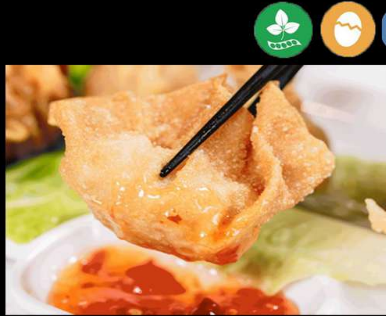
12. WEN TUN FREGIT (4u)

Carn, verdures i fideús d'arròs Carne, verduras y fideos de arroz