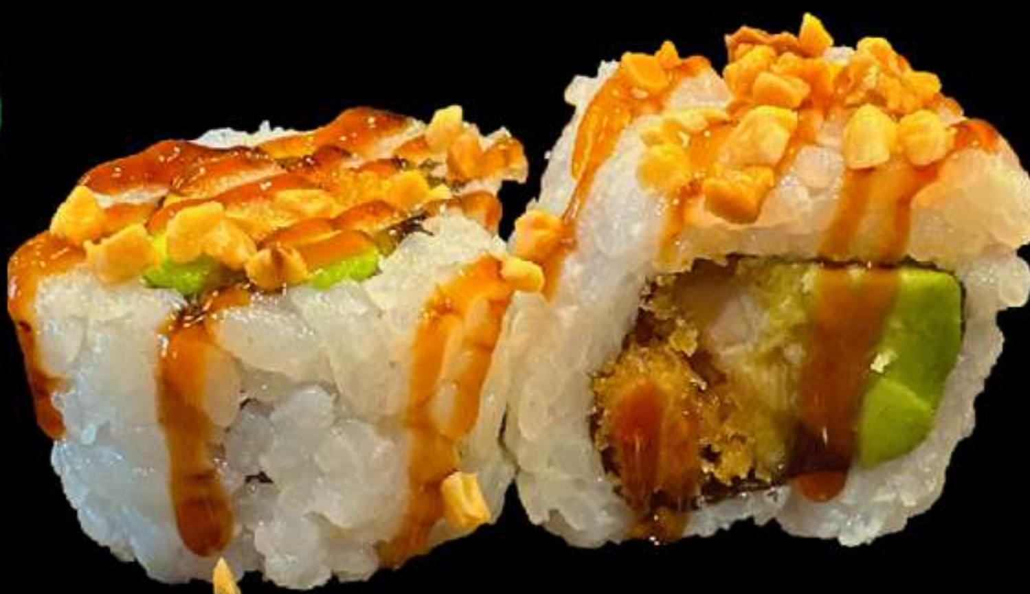
93. URAMAKI DE POLLASTRE. (4u)

Pollastre arrebossat, avocat i ametlles Pollo rebozado, aguacate y almendras