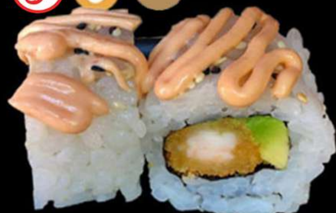
85.URAMAKI TOKIO (4u)

Llagostins, alvocat i salsa picant Langostinos, aguacate y salsa picante