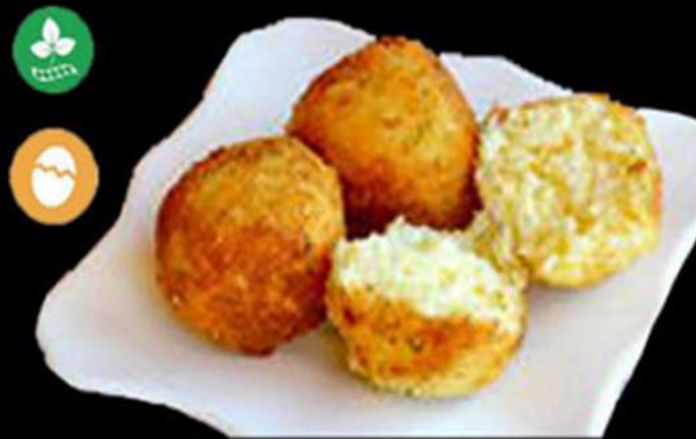
65.BOLES DE ARRÒS FREGIDES (2u)

Arròs de sushi fregit Arroz de sushi frita