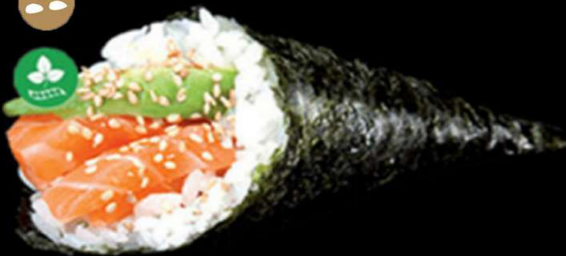
117. TEMAKI DE SALMÓ (1u)