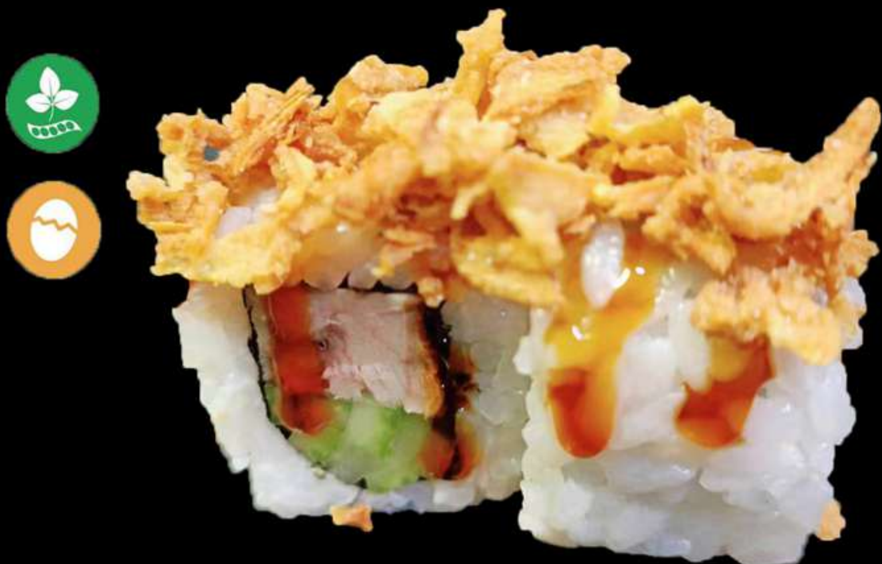
123. URAMAKI DE ÀNEC(4u)

Cranc, alvocat i ceba fregit Cangrejo, aguacate y cebolla frita