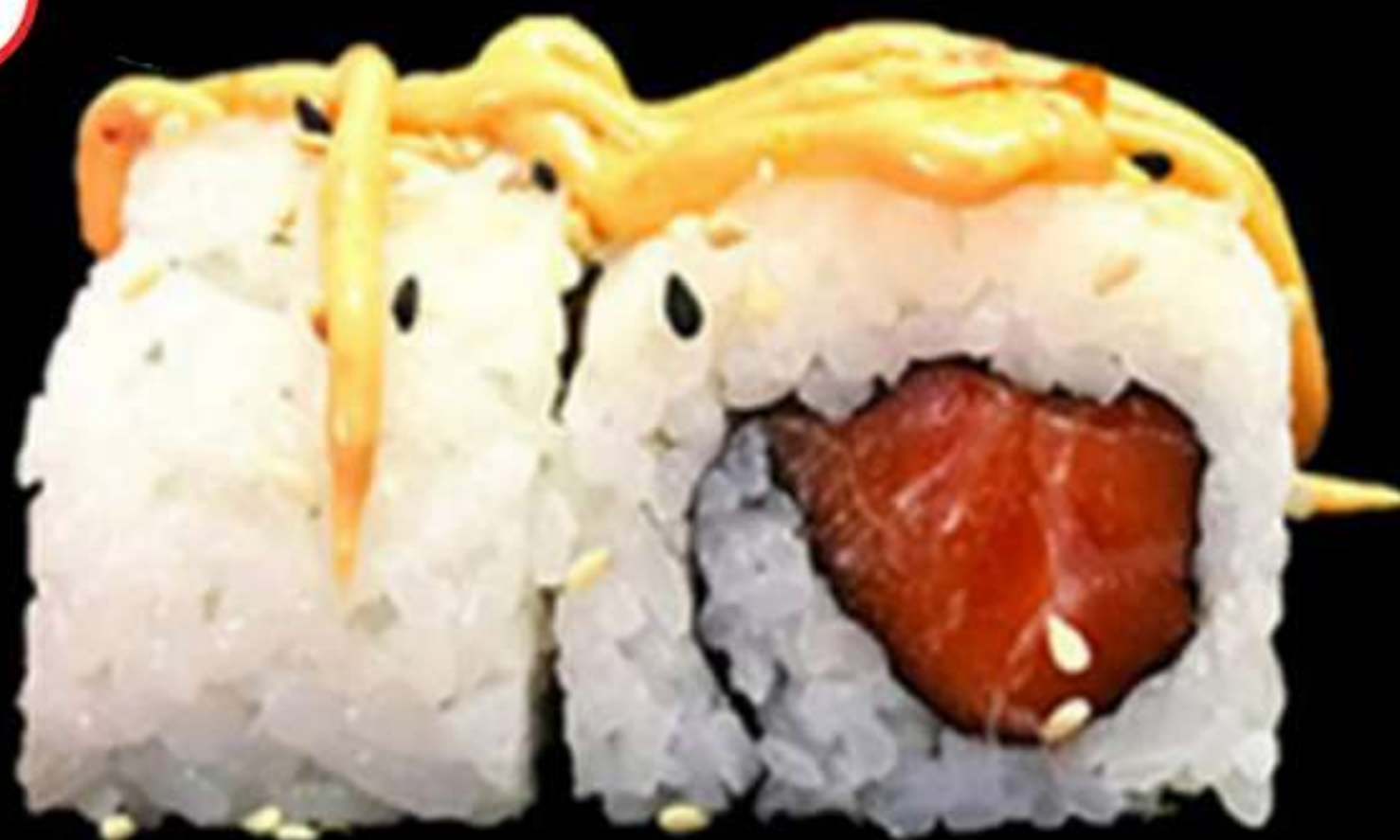
91. URAMAKI DE SALMÓ PICANT (4u)

Salmó, ciboulette i salsa picant Salmón, ciboulette y salsa picante