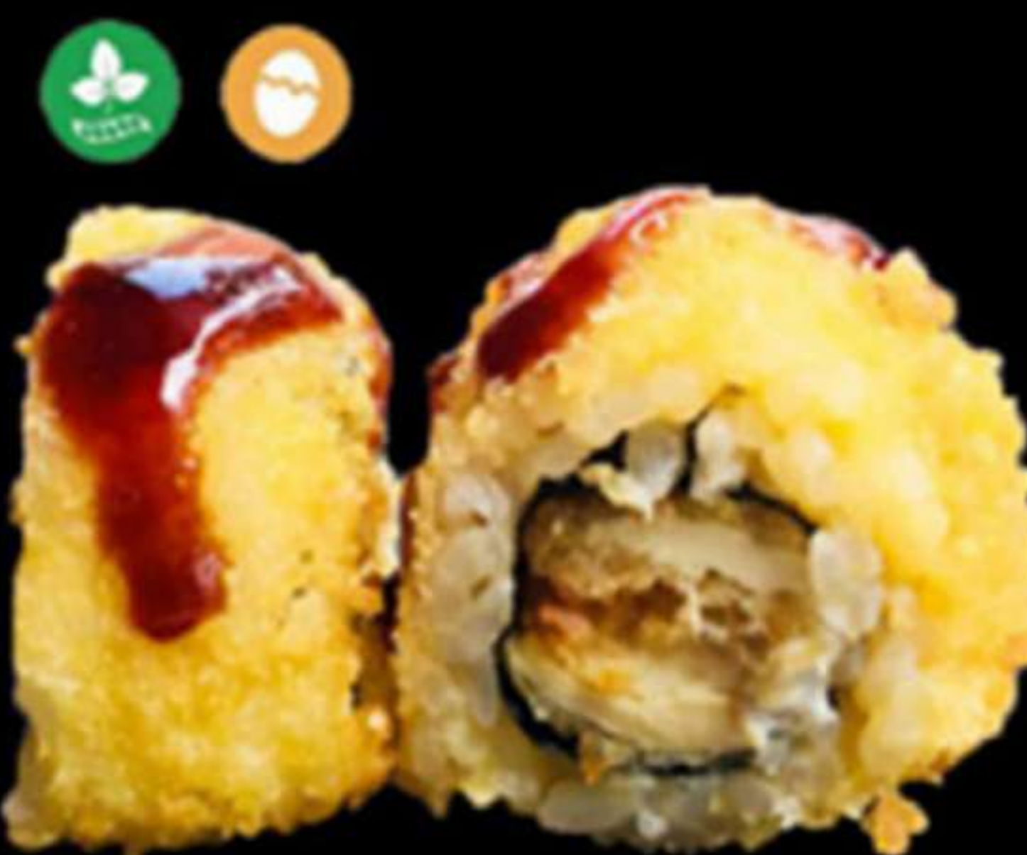
100. URAMAKI DE POLLASTRE (4u)

Salmó, alvocat i formatge PHL Salmón, aguacate y queso PHL