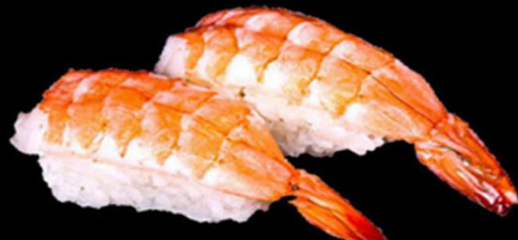
63. NIGIRI DE GAMBES (2u)