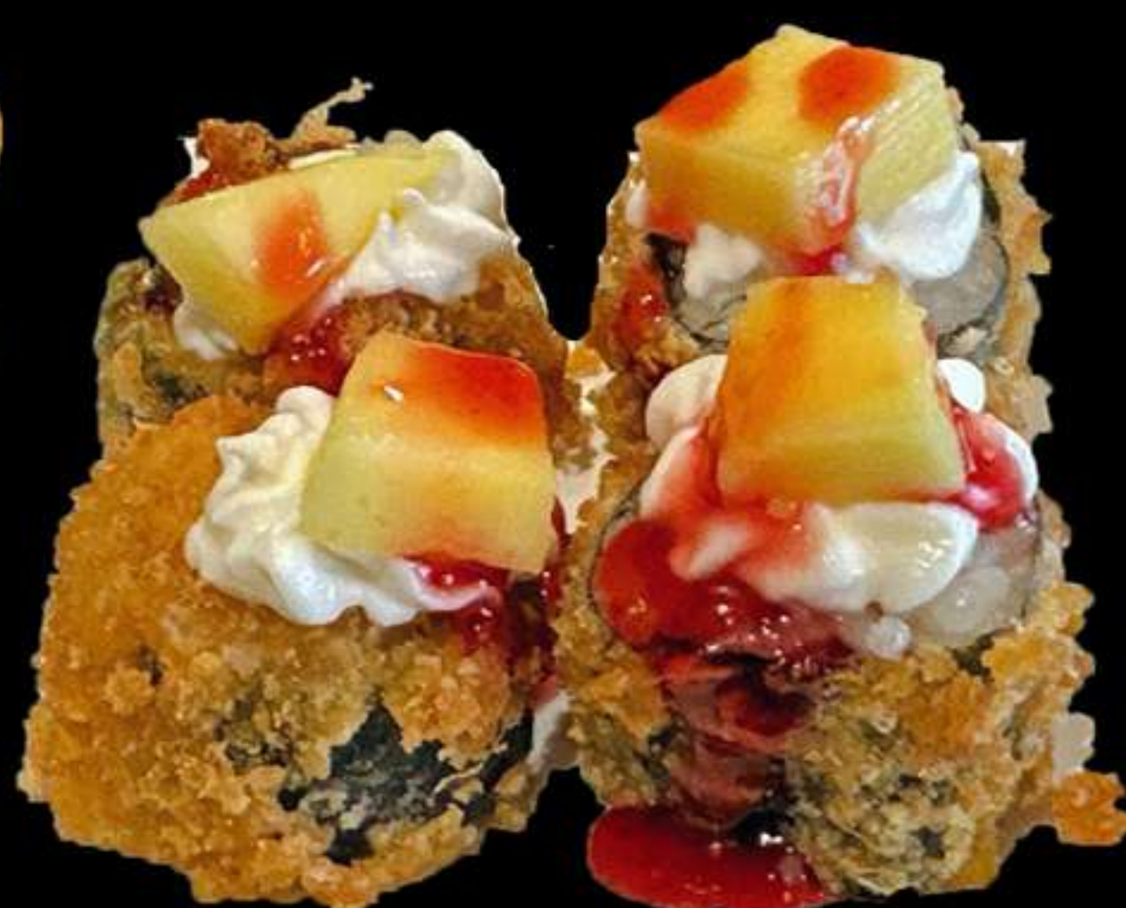
70.MAKI SALMÒ FREGIT AMB MANGO(4u)

Salmò, ous, y mango Salmon, huevo y mango