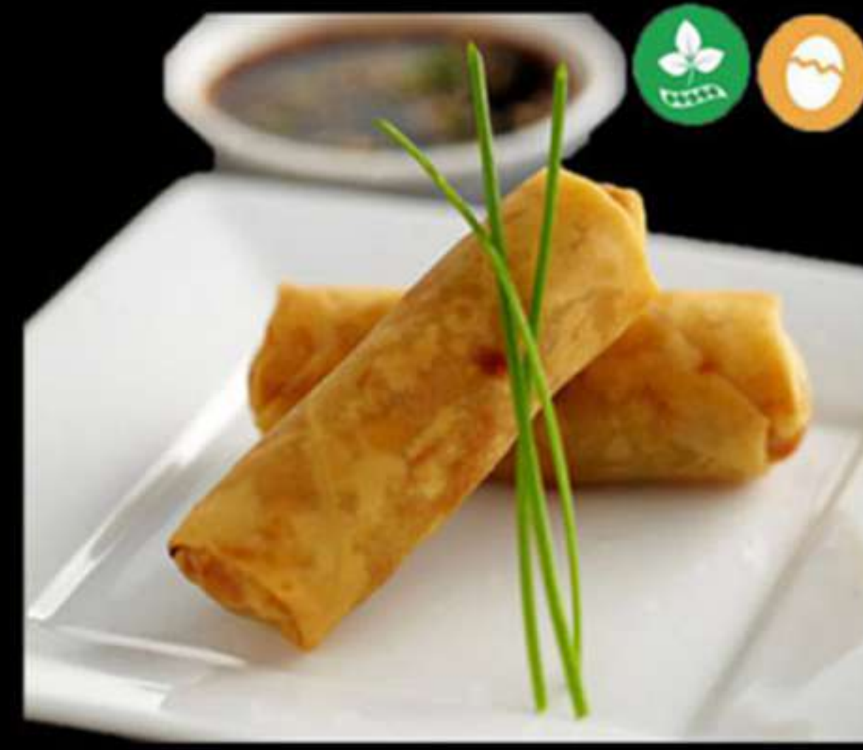
11. ROLLETS JAPONÉS Ó VERDURAS (2u)

Carn, verdures i fideús d'arròs Carne, verduras y fideos de arroz