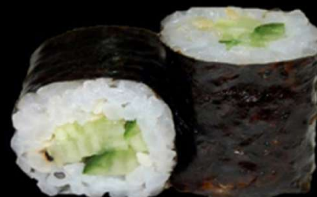
76.MAKI DE COGOMBR. (4u)