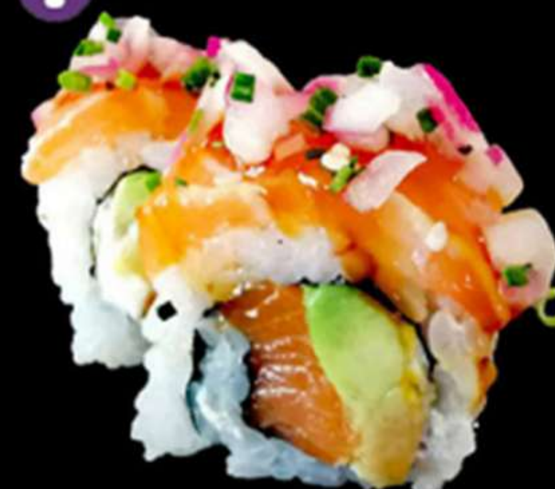
78.HANA MAKI SALMÓ CEBA (4u)

Salmó, alvocat, formatge PHL i ceba Salmón, aguacate, queso PHL y cebolla