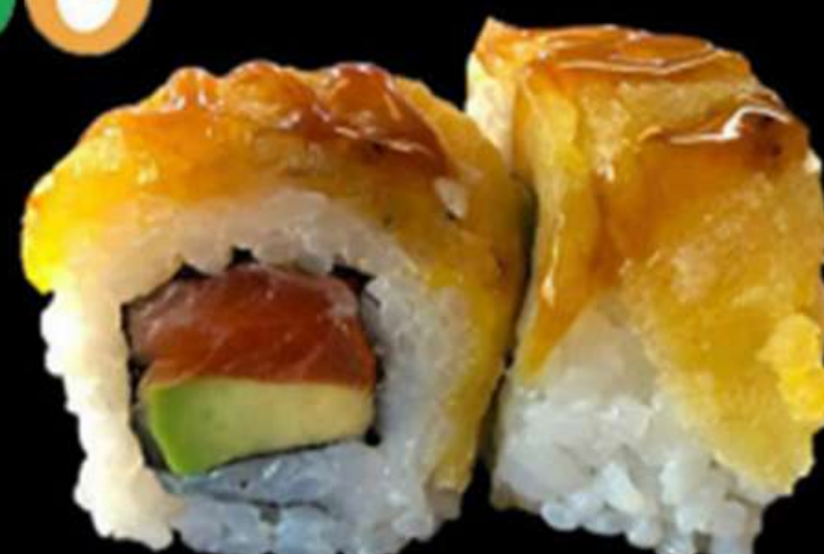
82.URAMAKI PLÀTAN (4u)

Alvocat, salmó i plàtan fregit Aguacate, salmón y plátano frito