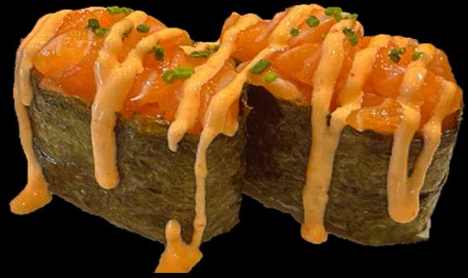
104. GUNKAN DE SALMÒ PICANT(2u)

Salmò, ciboulette, salsa picant Salmon, ciboulette, salsa picante