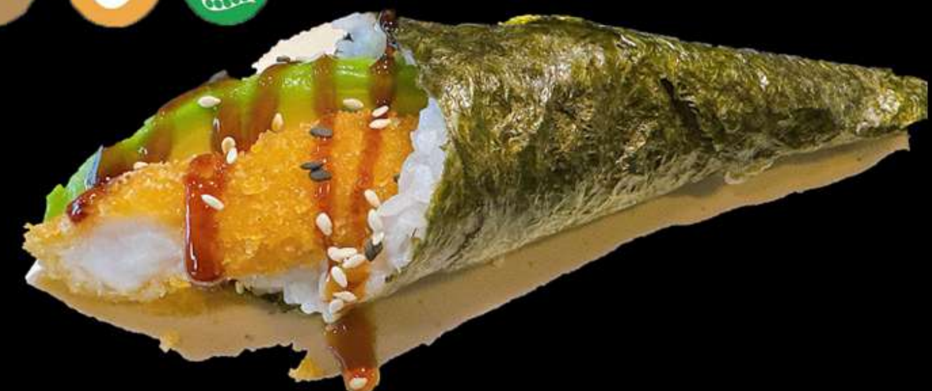
118. TEMAKI DE LLAGOSTIN ARREBOSSATS(1u)

Llagostin i alvocat Langostino y aguacate