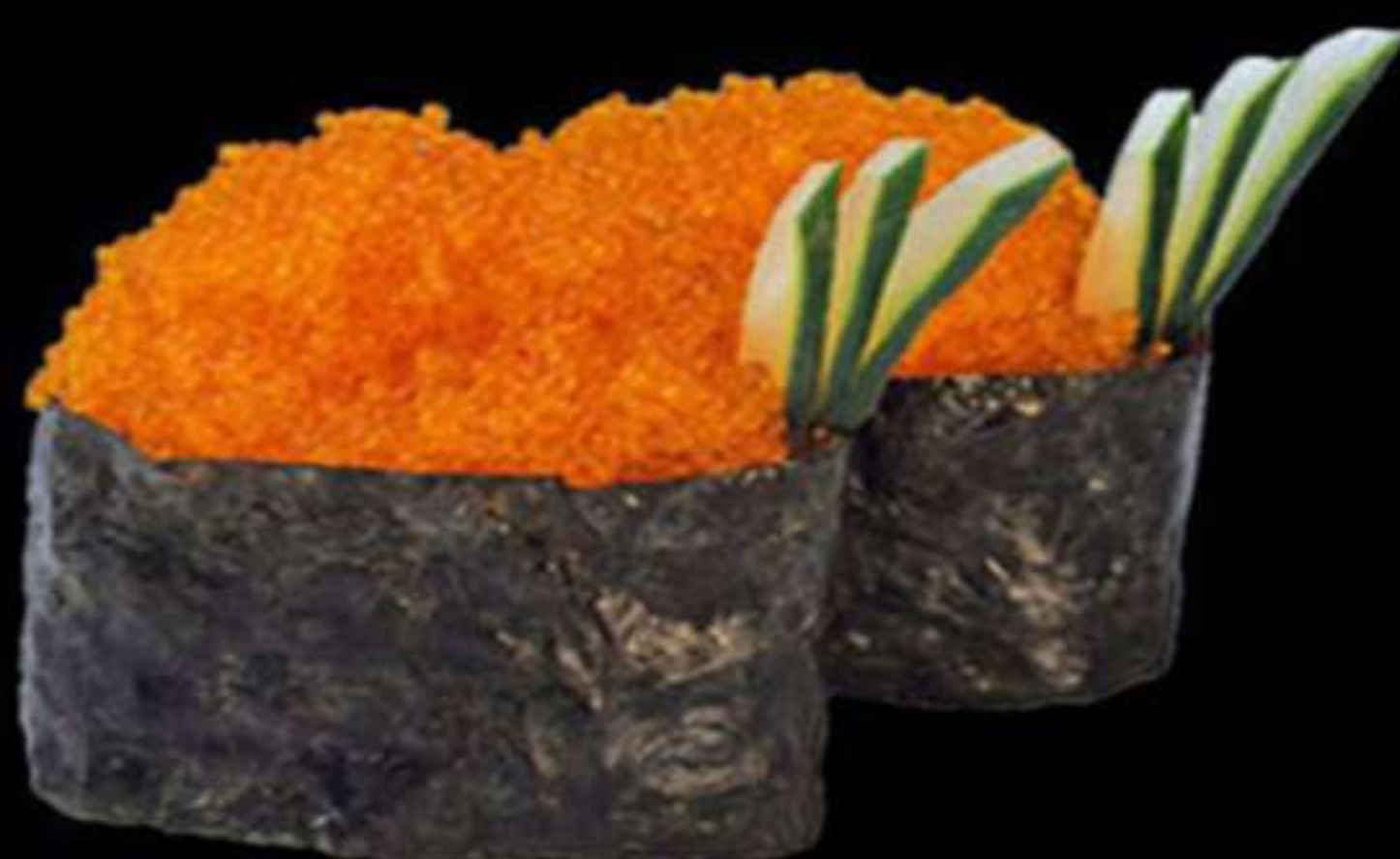
109. GUNKAN DE TOBIKO (2u)