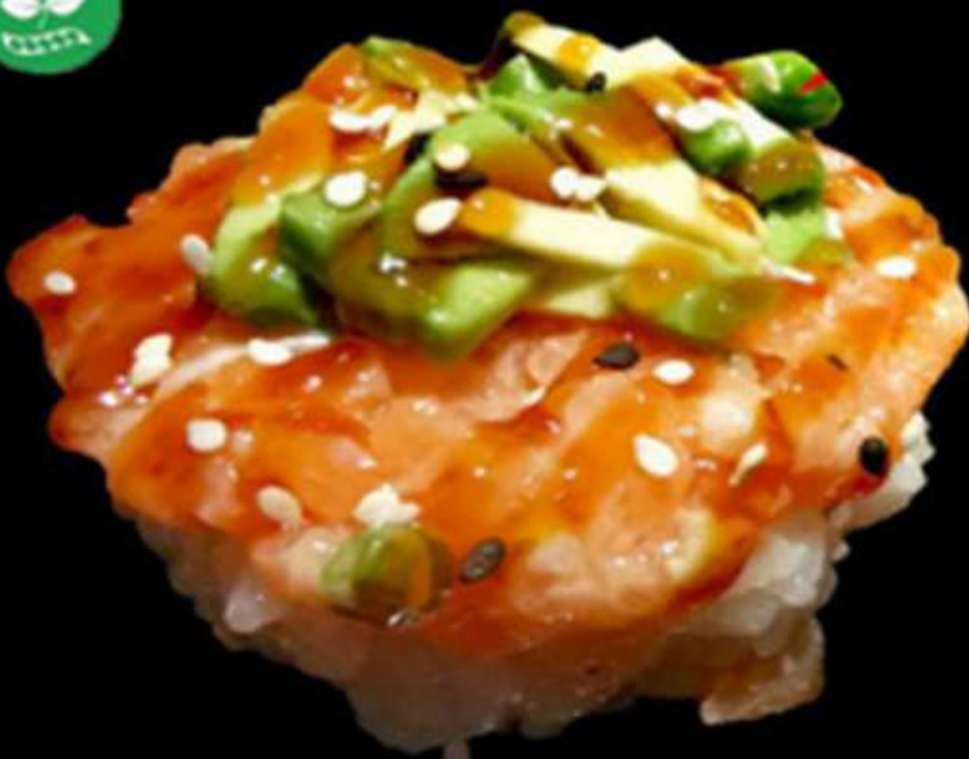
115. TARTA DE SALMÓ ALVOCAT

Arròs, salmó i alvocat Arroz, salmón y aguacate