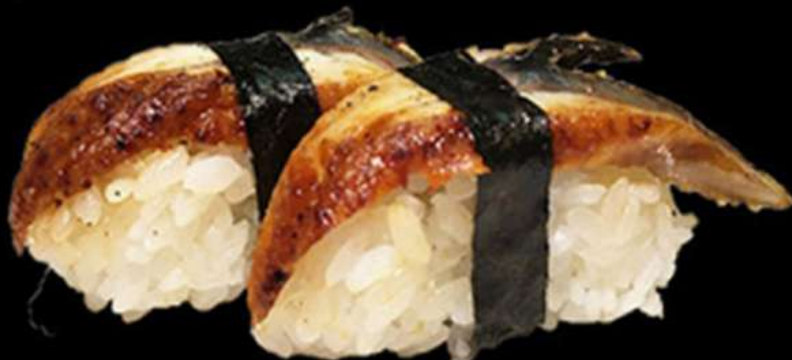
66.NIGIRI DE ANGUILA (2u)