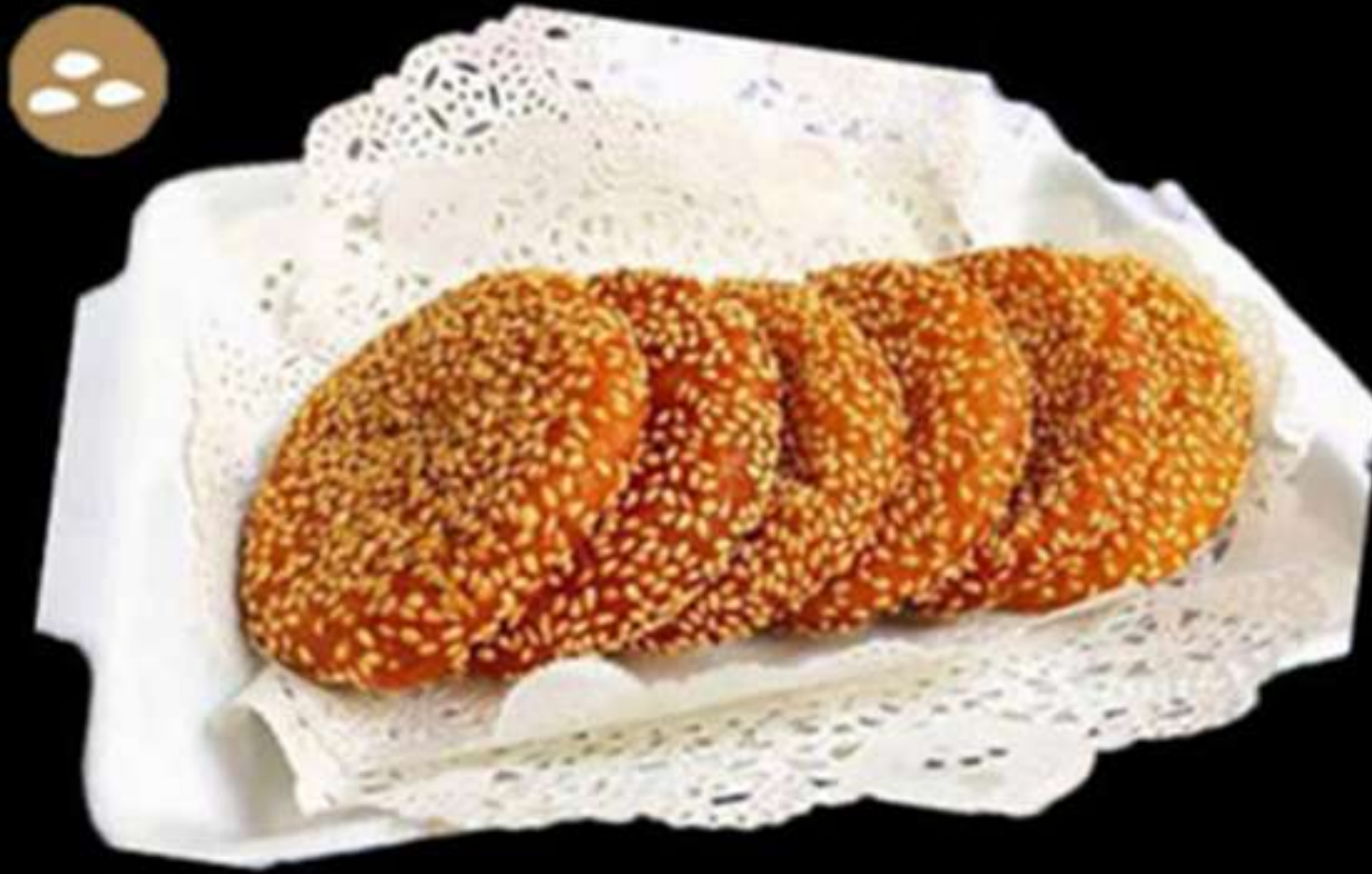
14. PASTÍS DE CARBASSA (2u)

Farina d'arròs, carbassa i sèsam Harina de arroz, calabaza y sèssamo