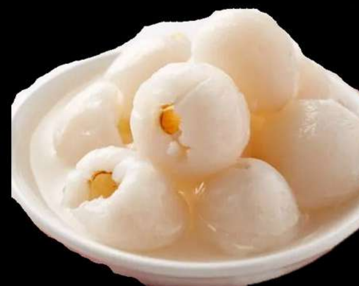
Lichi..... 1.95€ Lichi