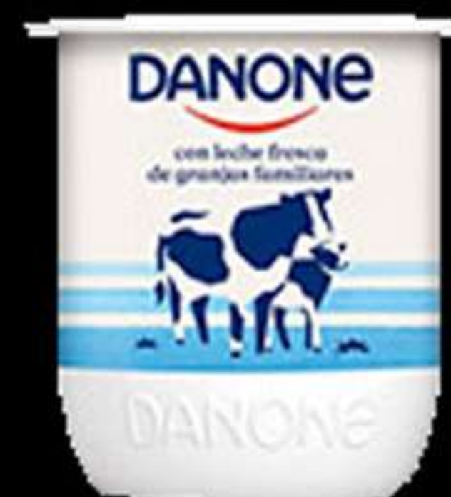
logurt Natural (Danone) ..... 1.65€ Yogurt Natural