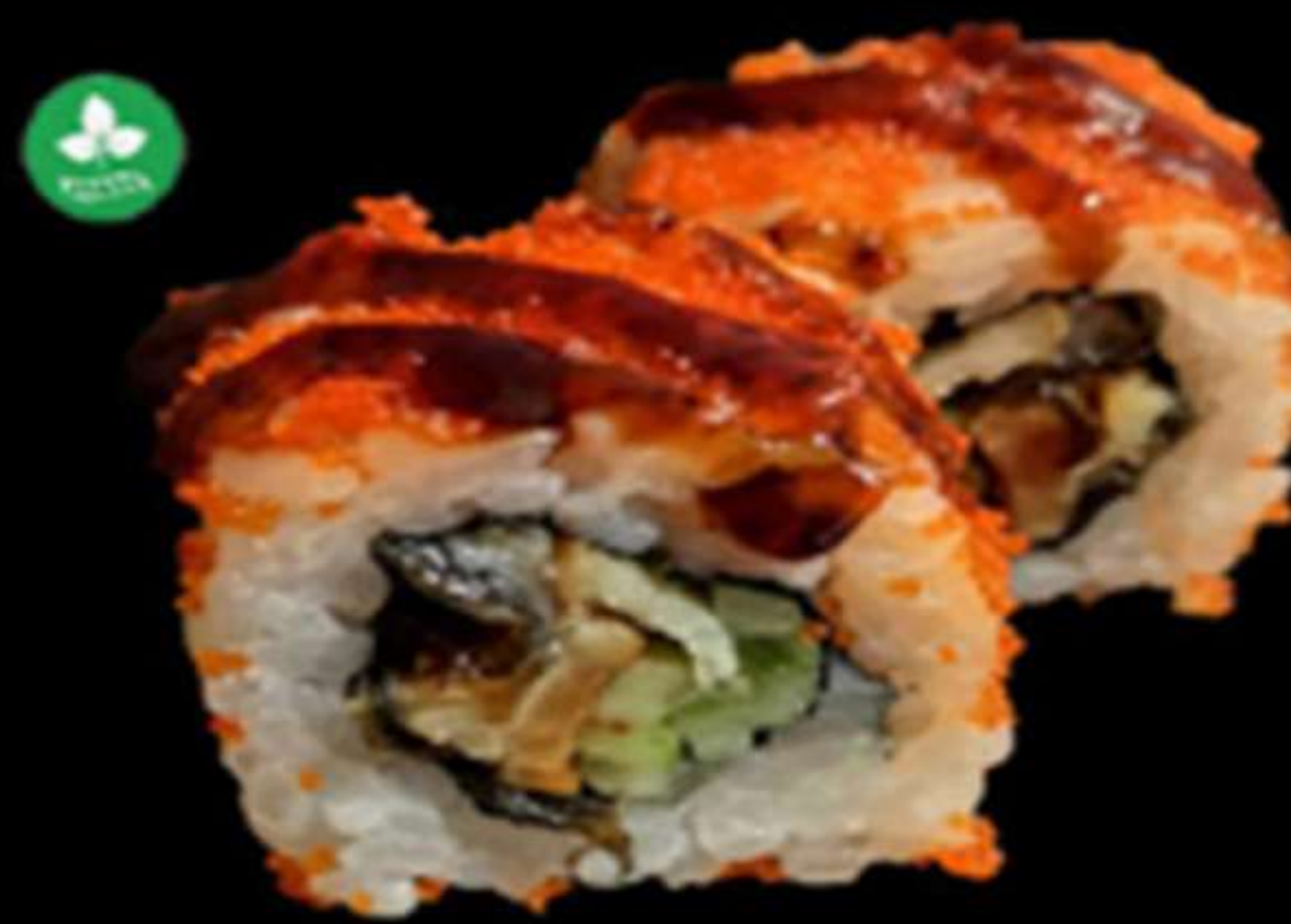
98. UNAGI ROLL (4u)

Salmó, mango i formatge PHL Salmón, mango y queso PHL