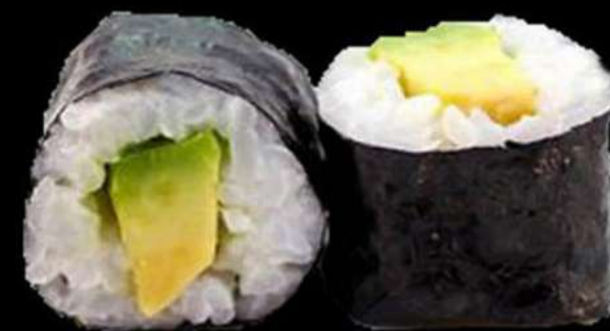
74.MAKI DE ALVOCAT (4u)