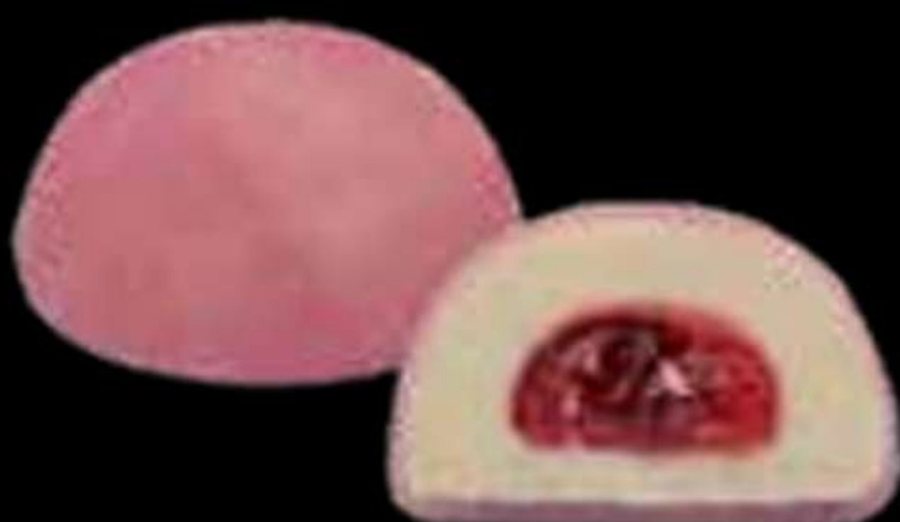
Mochi de cheesecake..... 4.50€ Mochi de formatge