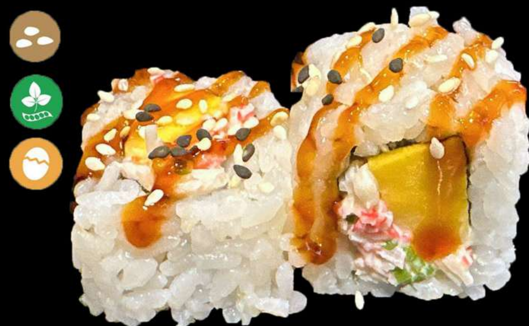
126. URAMAKI SURIMI MANGO(4u)

Salmò, cogombre i tobiko Salmon, pepino y tobiko