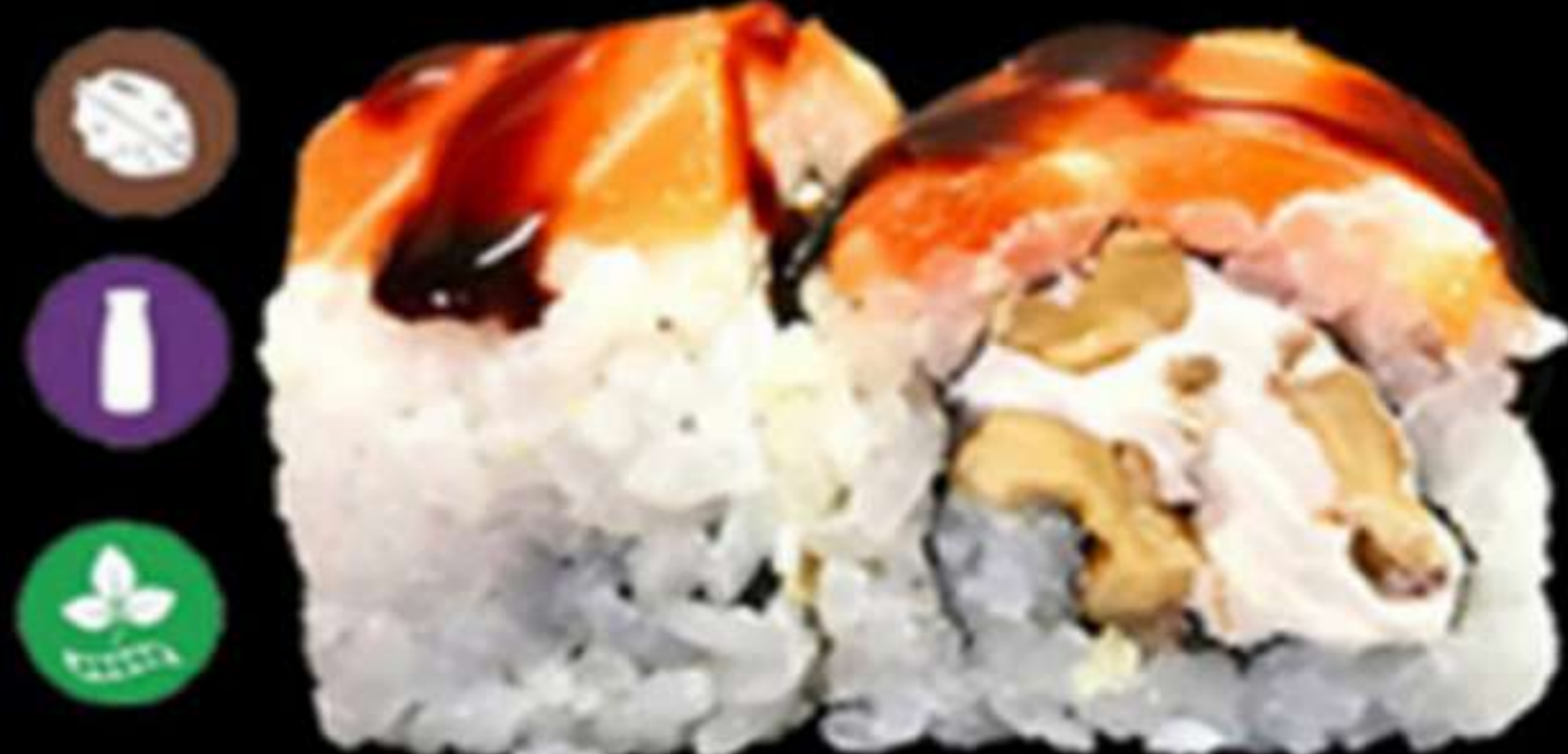
95. URAMAKI DE NOUS (4u)

Nous, formatge PHL i salmó Nueces, queso PHL y salmón