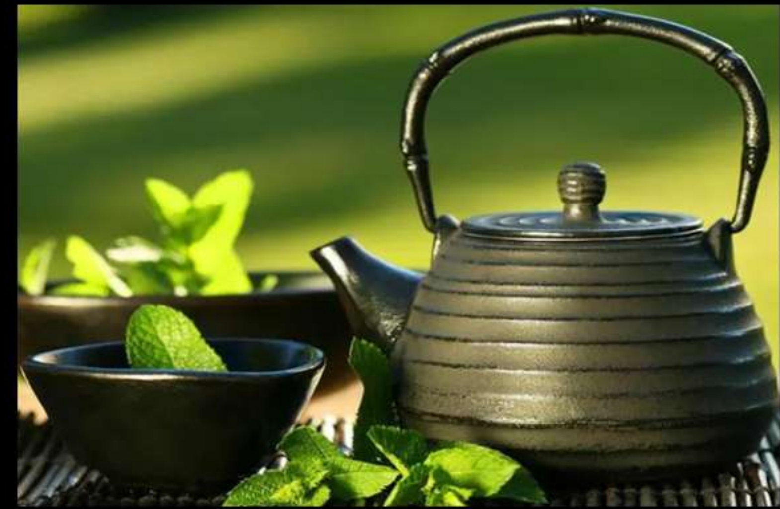
Te verd (Gerra)..... 3.20€ Te verde (Jarra)