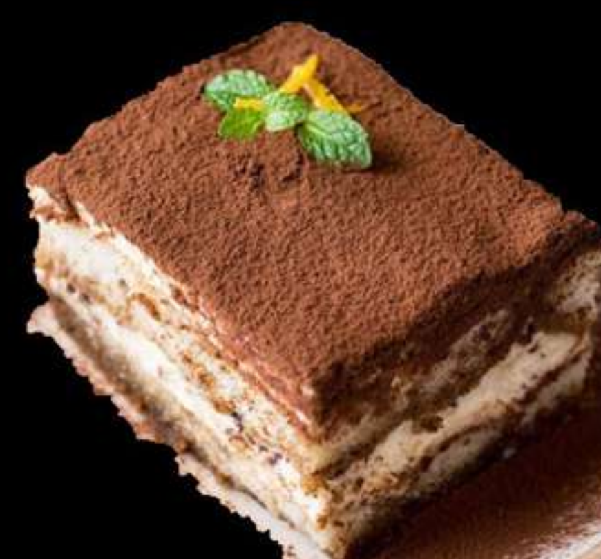
Pastís (de Formatge o de Tiramisú) 1.85€ Pastel (de Queso o de Tiramisú) ....