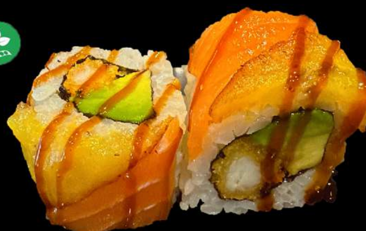
86.URAMAK DRAC (4u)

Llagostins, alvocat, salmó y plàtan fregit Langostinos, aguacate, salmón y plátano frito