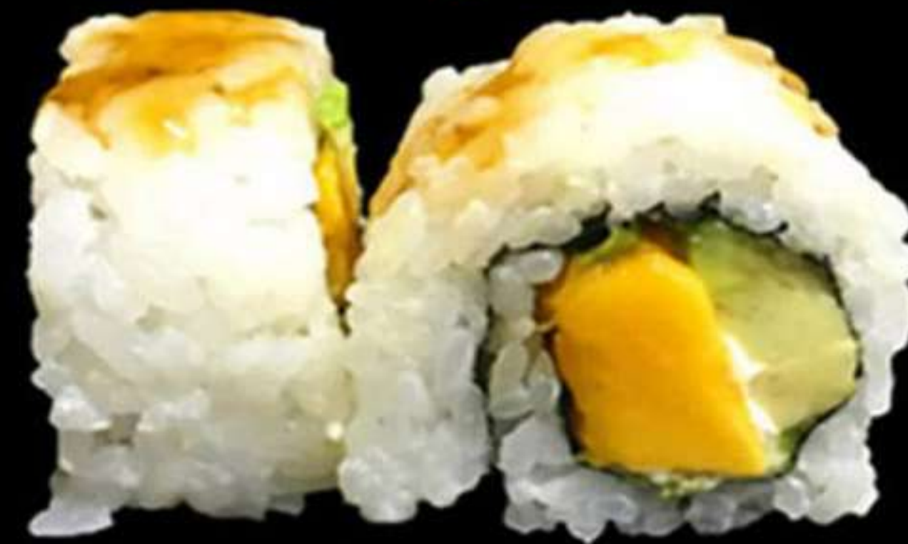
90. URAMAKI DE FRUITES (4u)

Avocat, mango i formatge PHL Aguacate, mango y queso PHL