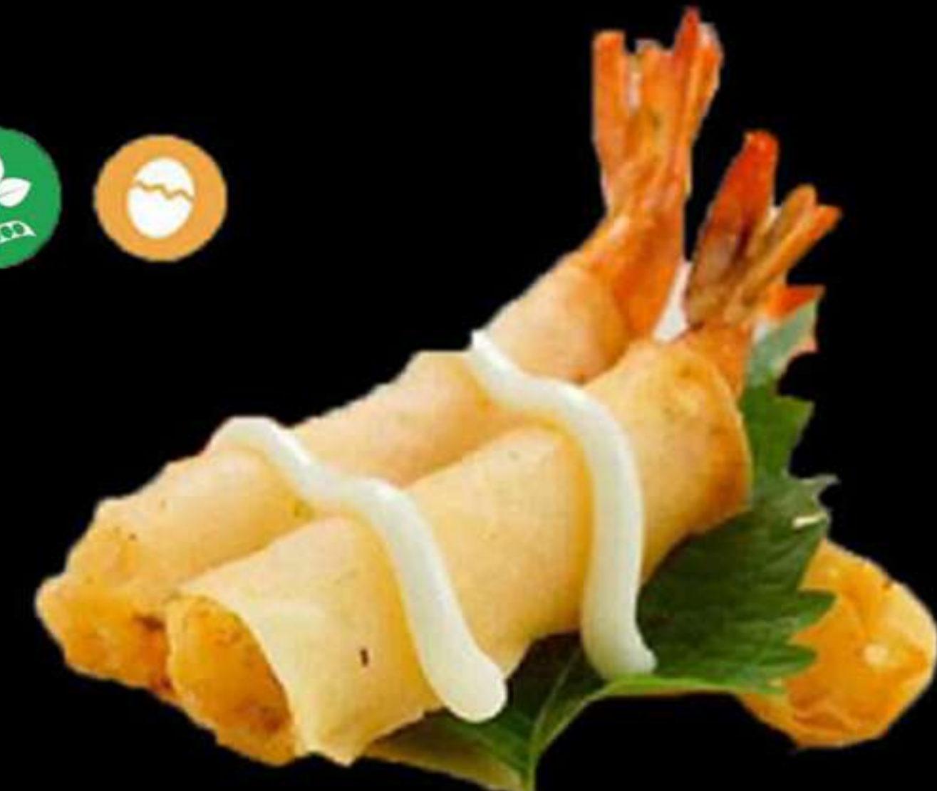
16. ROLLETS DE GAMBES (2u)

Farina i pols de llet Harina y polvo de leche