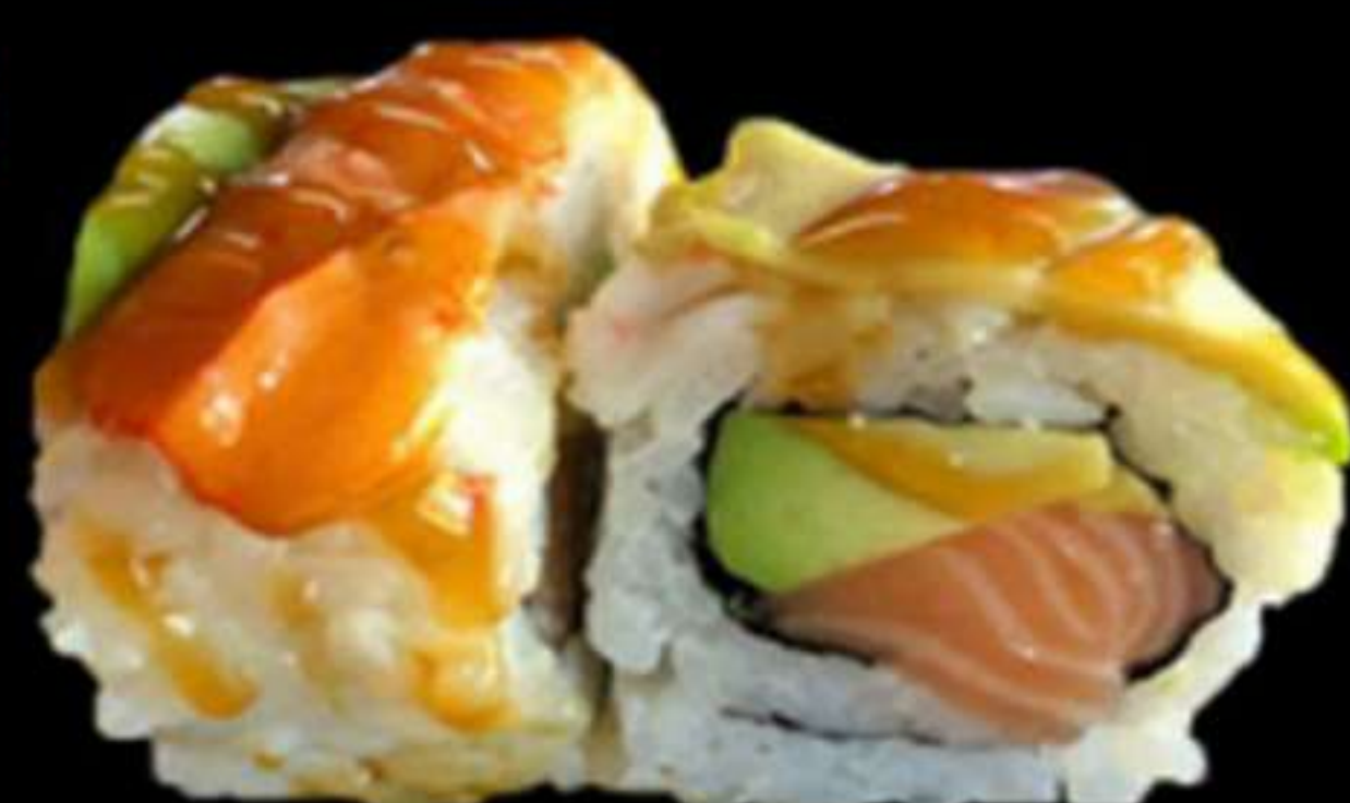
83. URAMAKI KYOTO (4u)

Salmó, gambes i alvocat Salmón, gambas y aguacate