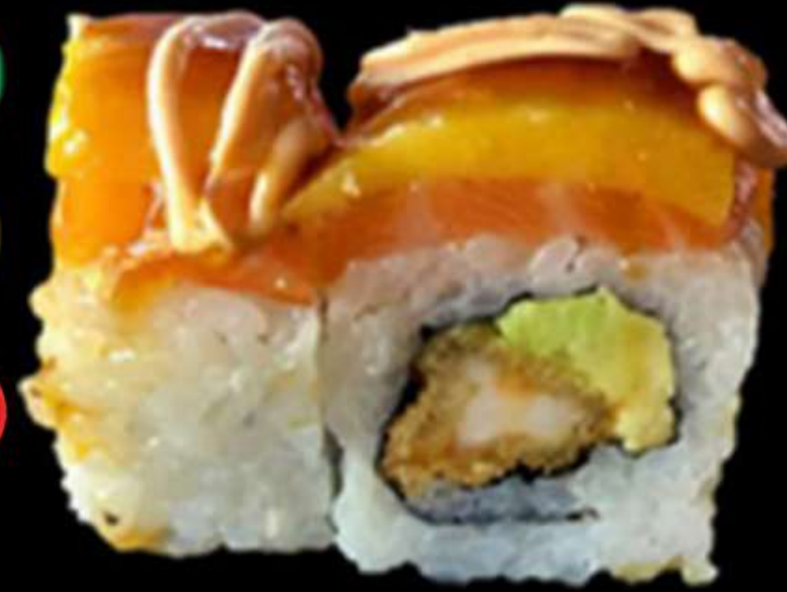
88. URAMAKI MANGO (4u)

Llagostins, mango, avocat i salmó Langostinos, mango, aguacate y salmón