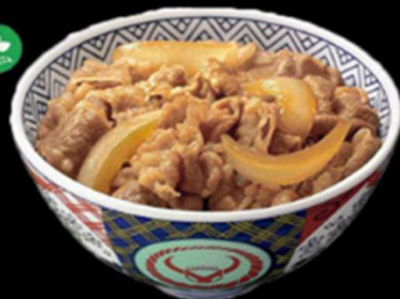
33. ARRÒS AMB VEDELLA

Arròs, vedella i ceba Arroz, ternera y cebolla