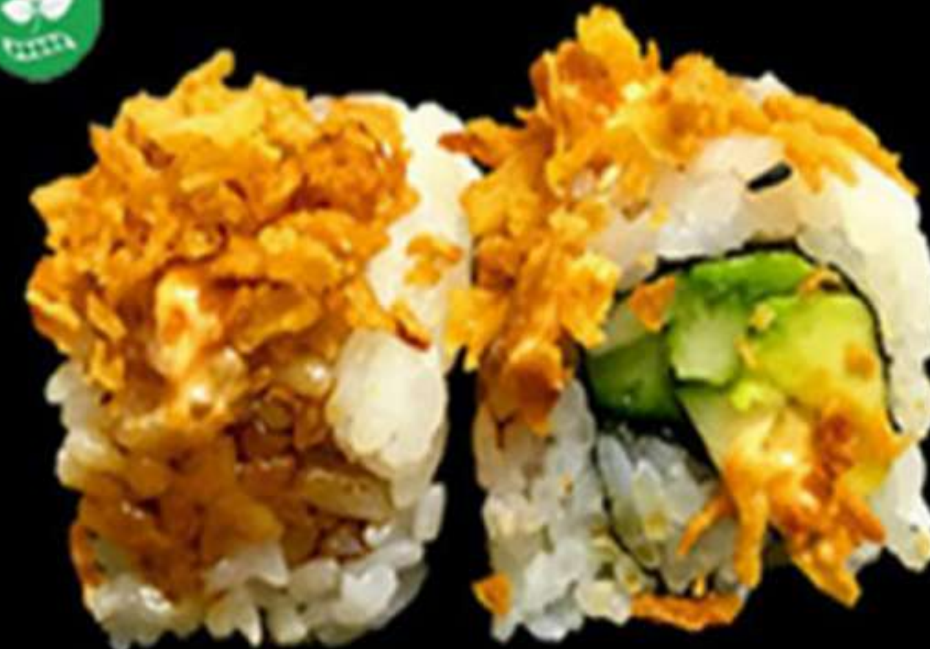
92. URAMAKI DE CEBÀ FREGIT (4u)

Mango, avocat, cogombre i salsa picant Mango, aguacate, pepino, y salsa picante