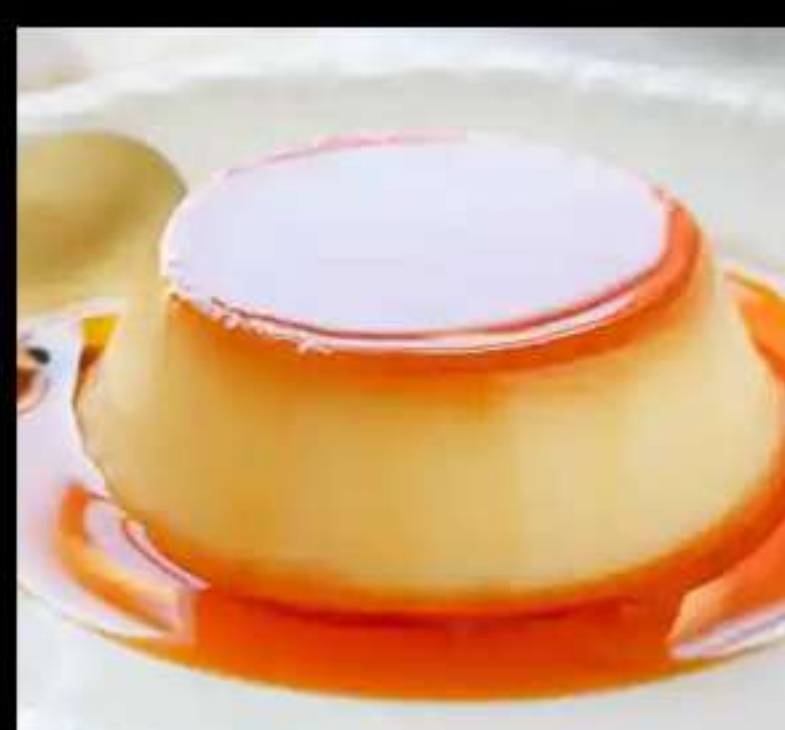
Flan de Vainilla(Casolà) . 1.65€ F lan de Vainilla(Casero)