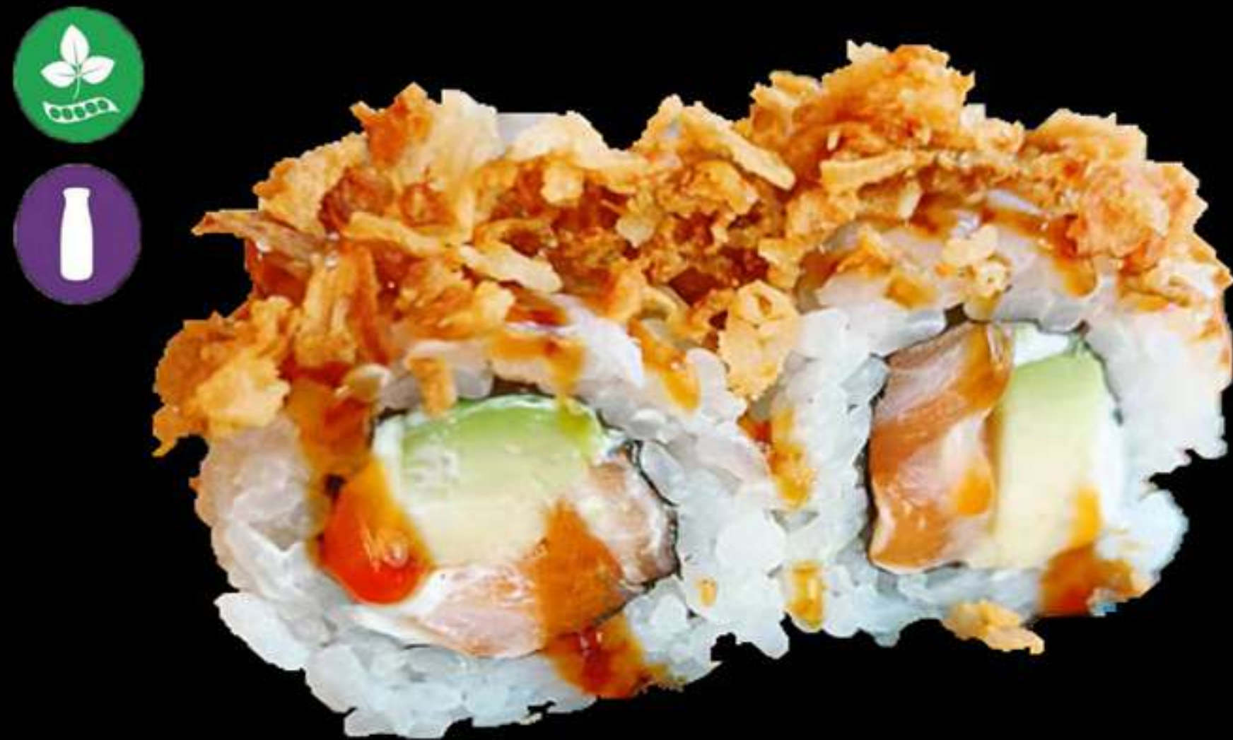
121. HANAMAKI CEBA FREGIT(4u)

Salmò, alvocat, formage i ceba fregit Salmon, aguacate, queso y cebolla frita