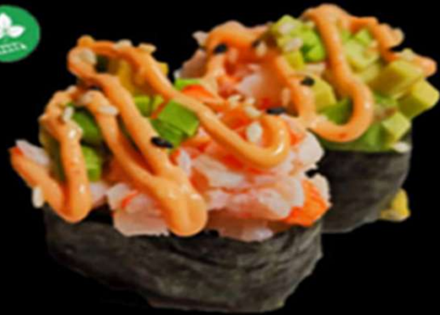
106. GUNKAN DE EBI (2u)

Gambes, alvocat i salsa picant Gambas, aguacate y salsa picante