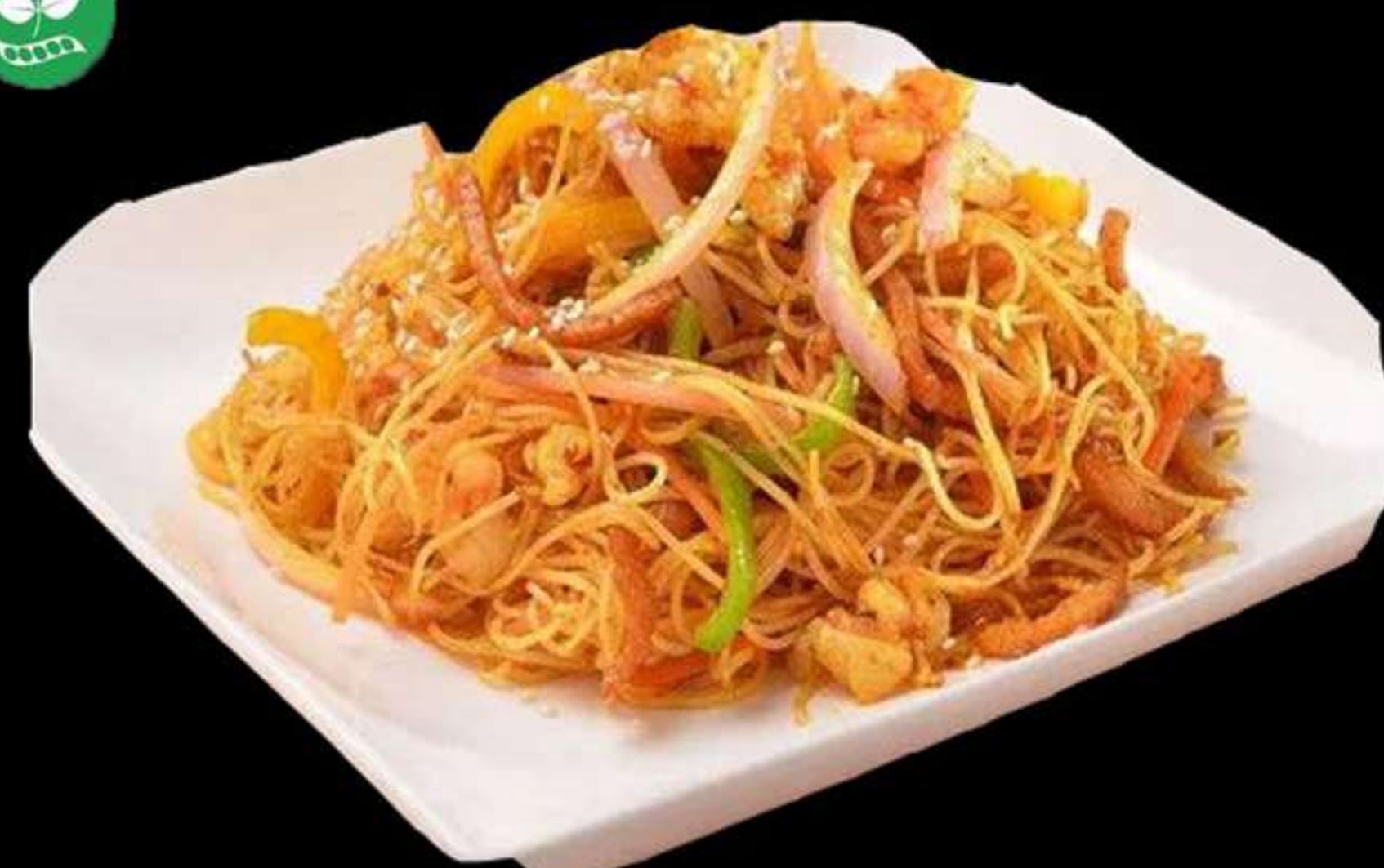
35.FIDEUS DE ARROZ AMB VERDURES

Fideus de arroz amb verdures Fideos de arros con verduras