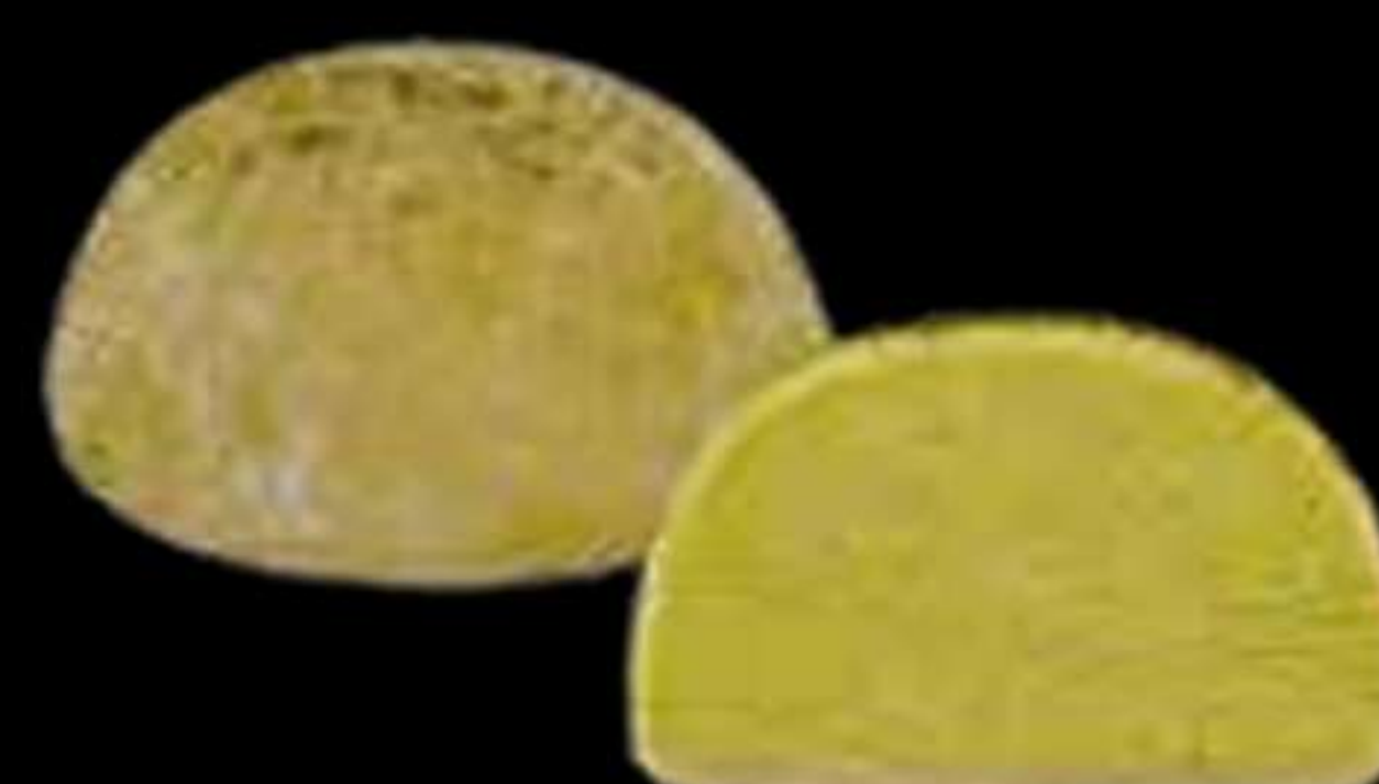
Mochi de te verd..... 4.50€ Mochi de té verde