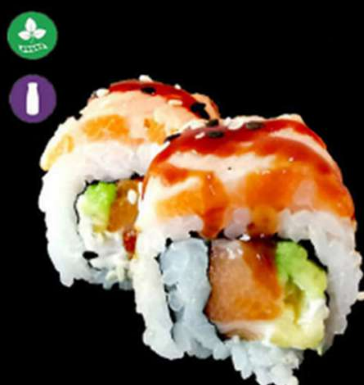
99. HANA MAKI SALMÓN FRAMEJAT (4u)

Anguila, cogombre i tobiko Anguila, pepino y tobiko