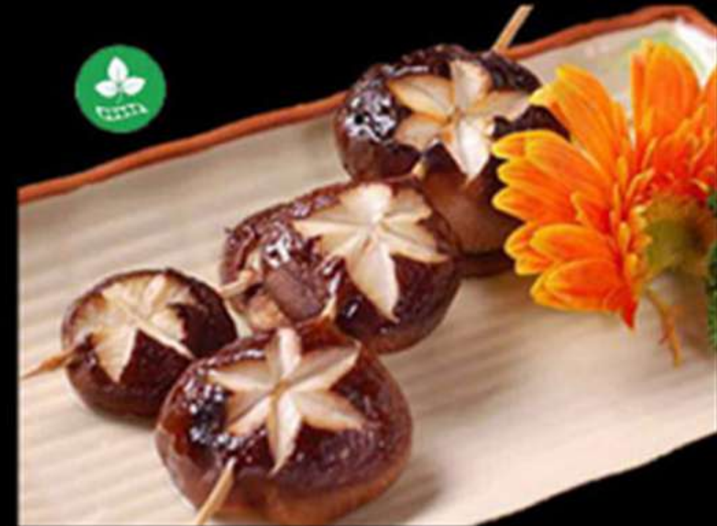
59. BROQUETES DE BOLETS (2u)

Bolets amb salsa teriyaki Seras con salsa teriyaki