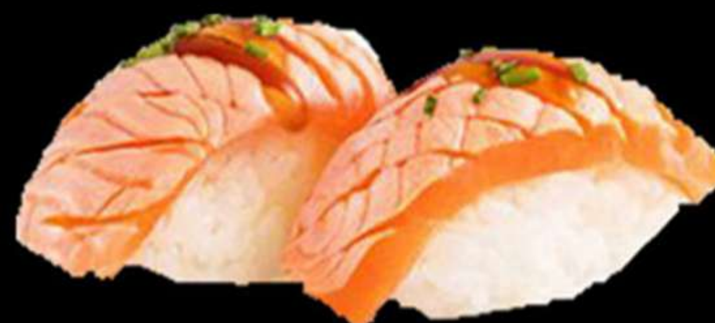
67 .NIGIRI DE SALMÓ FLAMEJAT (2u)

Nigiri de salmó flamejar Nigiri de salmón flameado