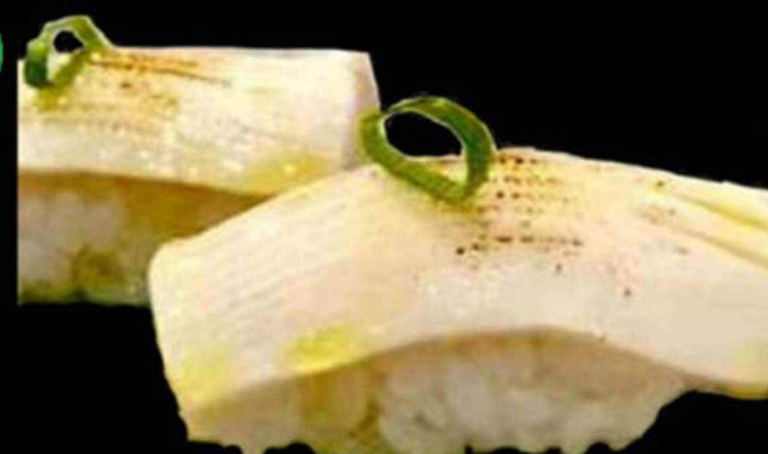
69.NIGINI DE PEIX MANTEGA FLAMEJAT (2u)

Nigiri de peix mantega flamejar Nigiri de pez matequilla flameado