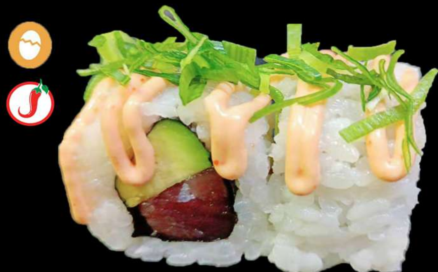
124. URAMAKI TONYINA PICANT(4u)

Ànec, cogombre i ceba fregit Pato, pepino y cebolla frita