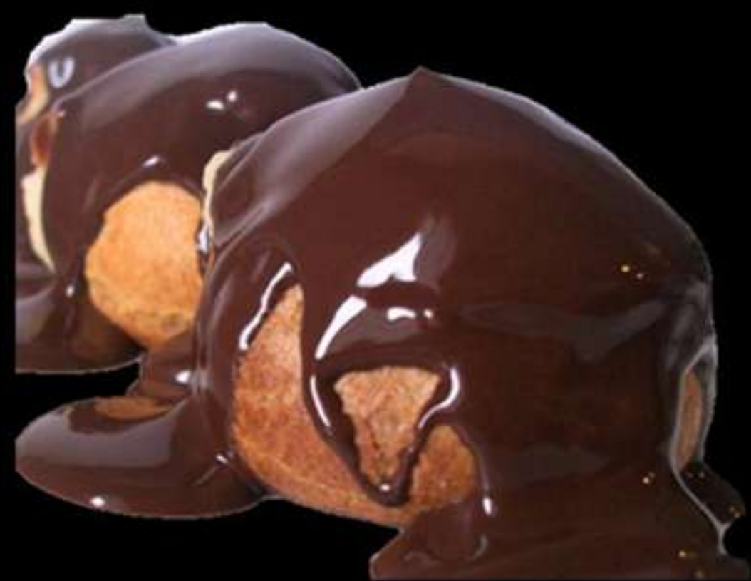
Profiteroles amb xocolata líquid. 1.65€ Profiteroles con chocolate liquido