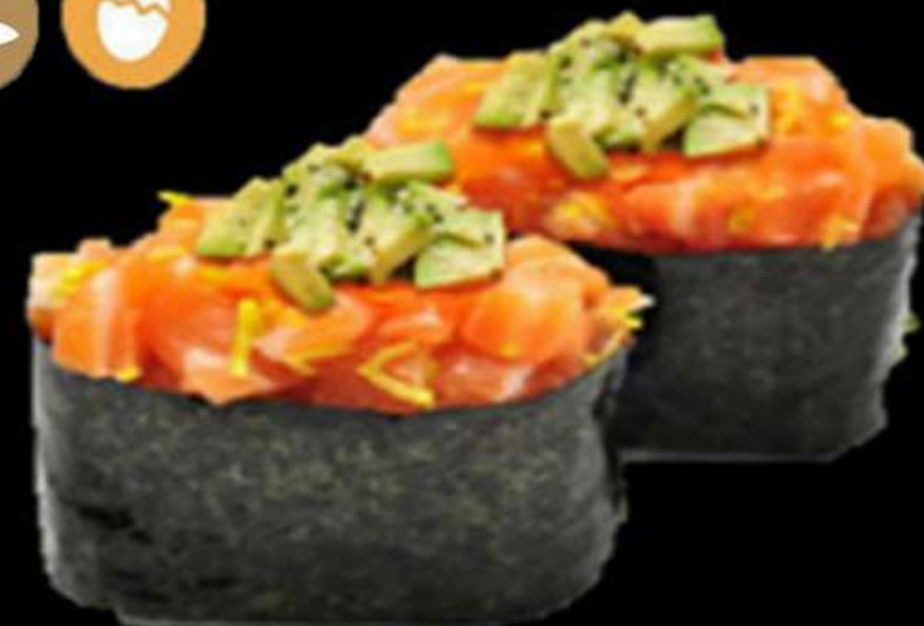
108. GUNKAN DE SALMÓ (2u)