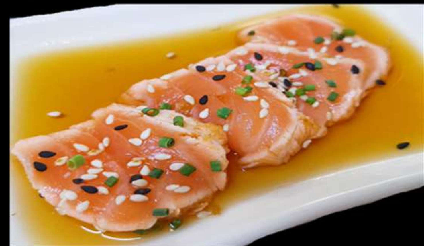
114. SASHIMI SALMÓ CON SALSA ESPECIA(4u)