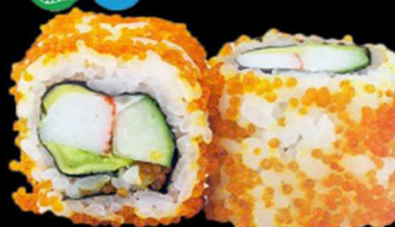
84.CALIFORNIA DE CRANC (4u)

Alvocat, surimi i tobiko Aguacate, surimi y tobiko