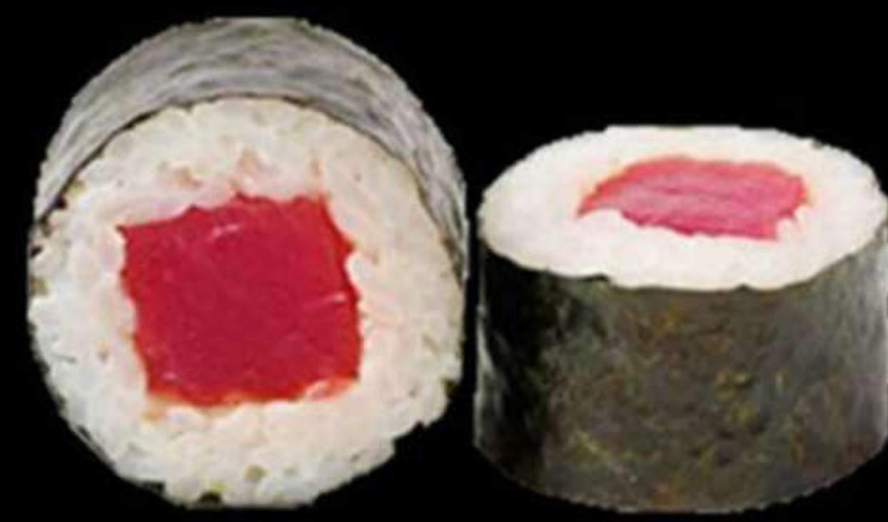
72. MAKI DE TONYINA (4u)