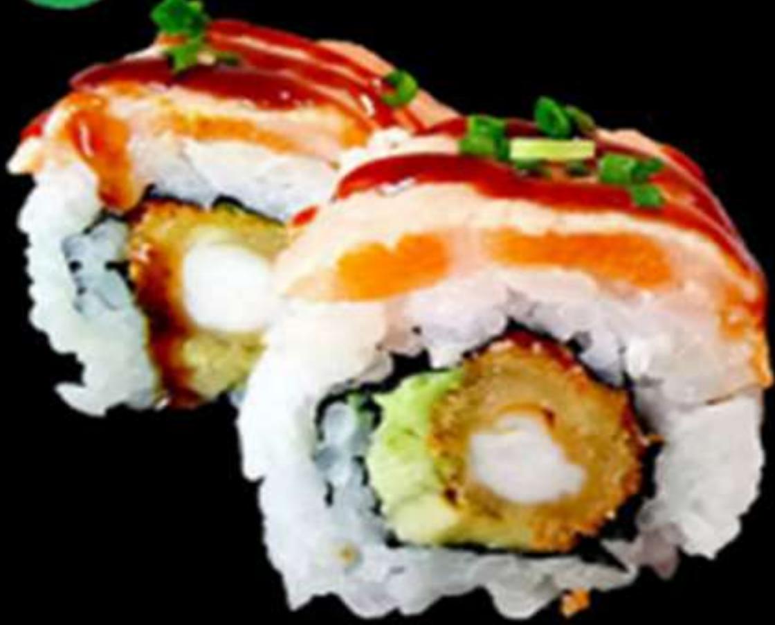
89. URAMAKI DE LLAGOSTINS CON SALMÓ FLAMEJAT (4u)

Llagostins, avocat i salmó Langostinos, aguacate y salmón