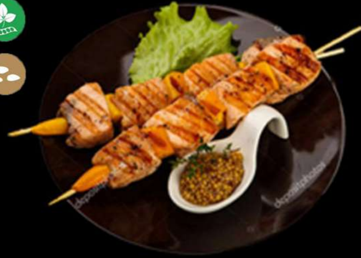
57. BROQUETES DE SALMÓ (2u)

Salmó amb salsa teriyaki Salmón con salsa teriyaki