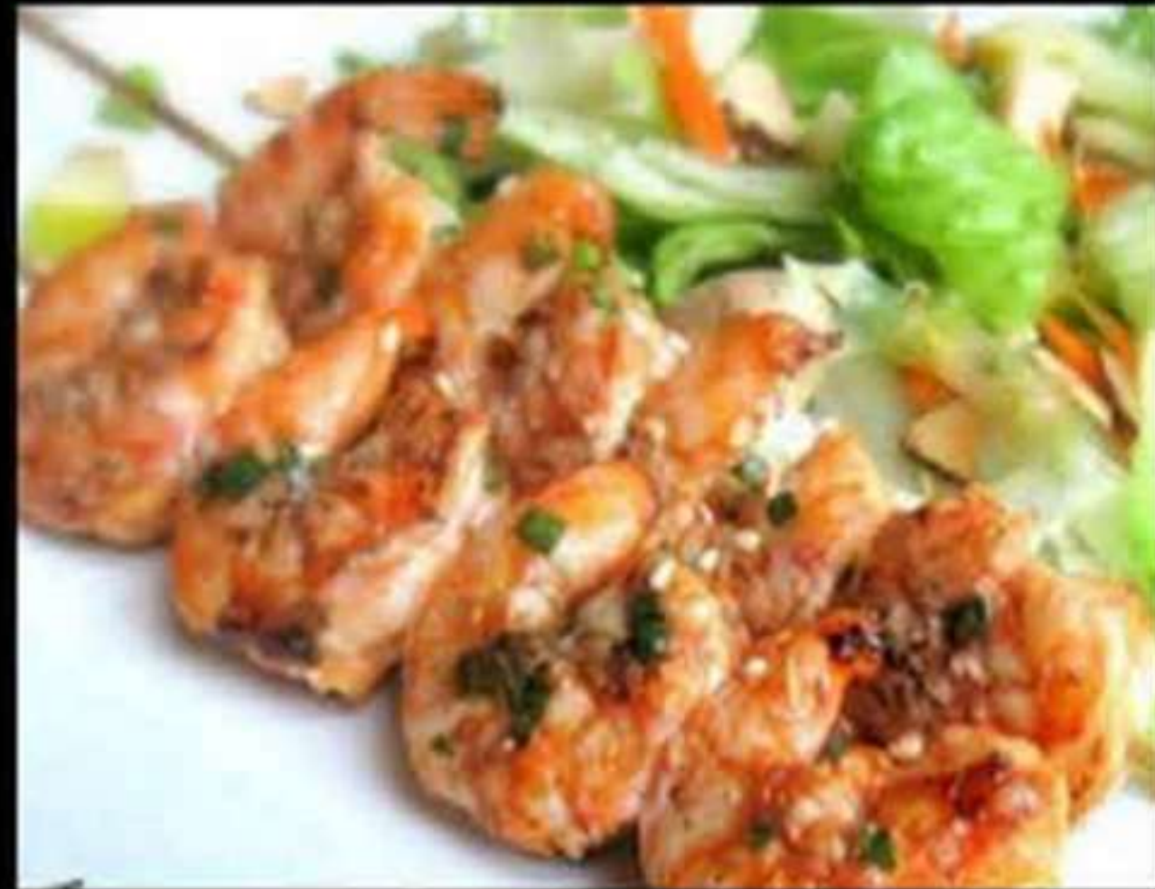
58. BROQUETES DE GAMBES (2u)

Gambes amb salsa de marisc Gambas con salsa de marisco