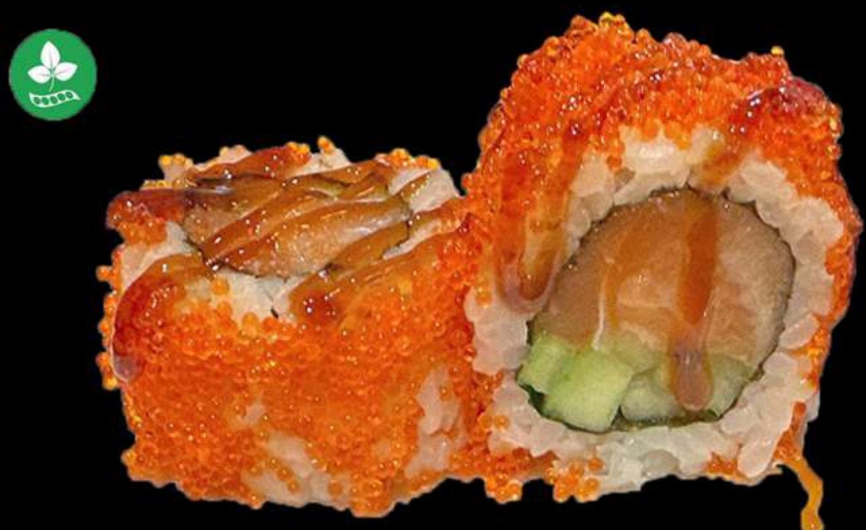
125. URAMAKI TOBIKO(4u)

Tonyina, alvocat ciboulet i salsa picant Atun, aguacate, ceboullete y salsa picante