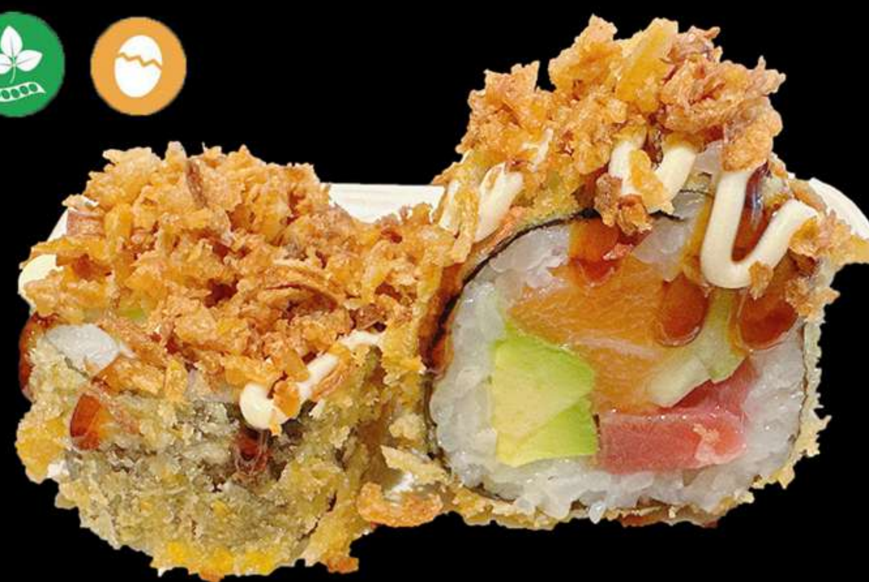
128.FOTOMAKI FREGIT AMB CEBA FREGIT(5u)

Salmò, tonyina, alvocat i ceba fregit Salmon, atun, aguacate y cebolla frita