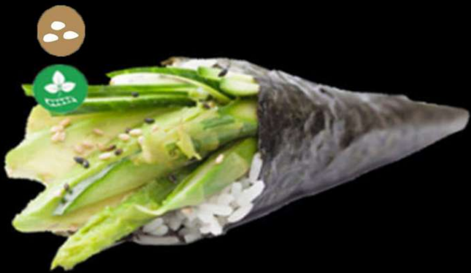
119. TEMAKI VEGETABLE (1u)