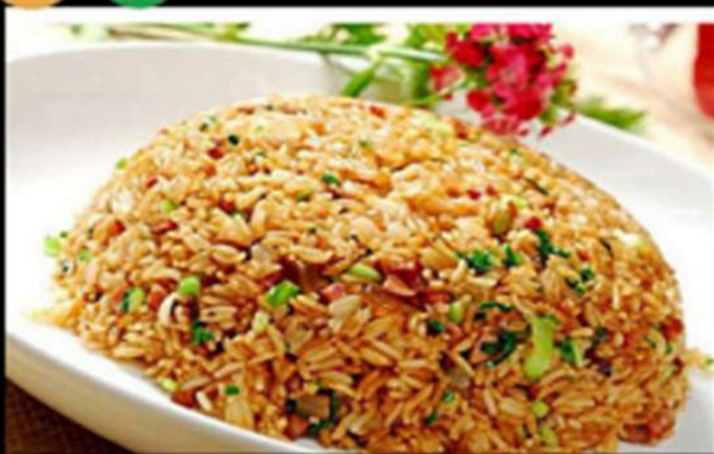
30.ARRÒS A LA PLANXA

Arròs, verdures, carn i soja Arroz, verduras, carne y salsa soja