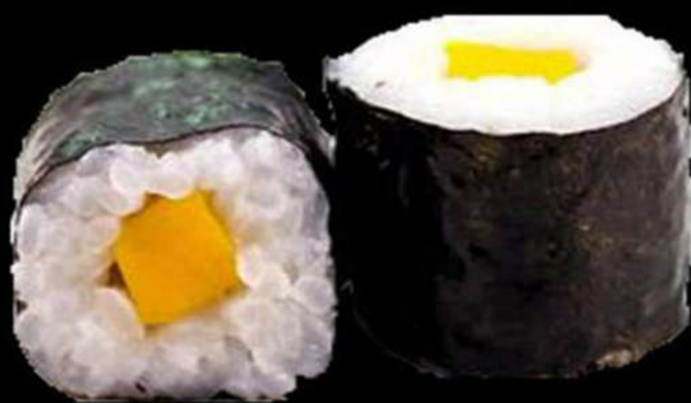
75.MAKI DE MANGO (4u)