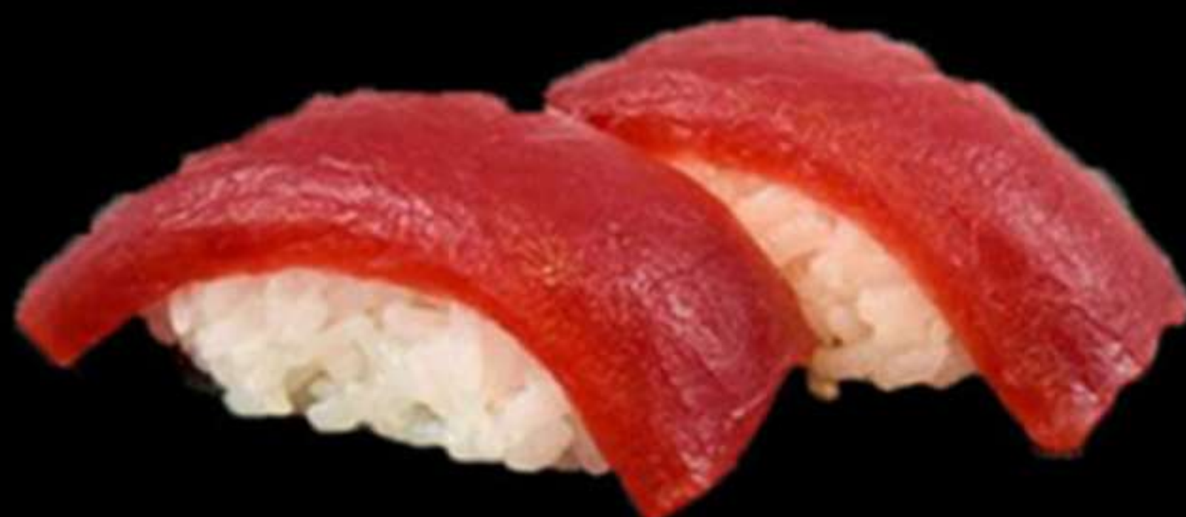
62. NIGIRI DE TONYINA (2u)