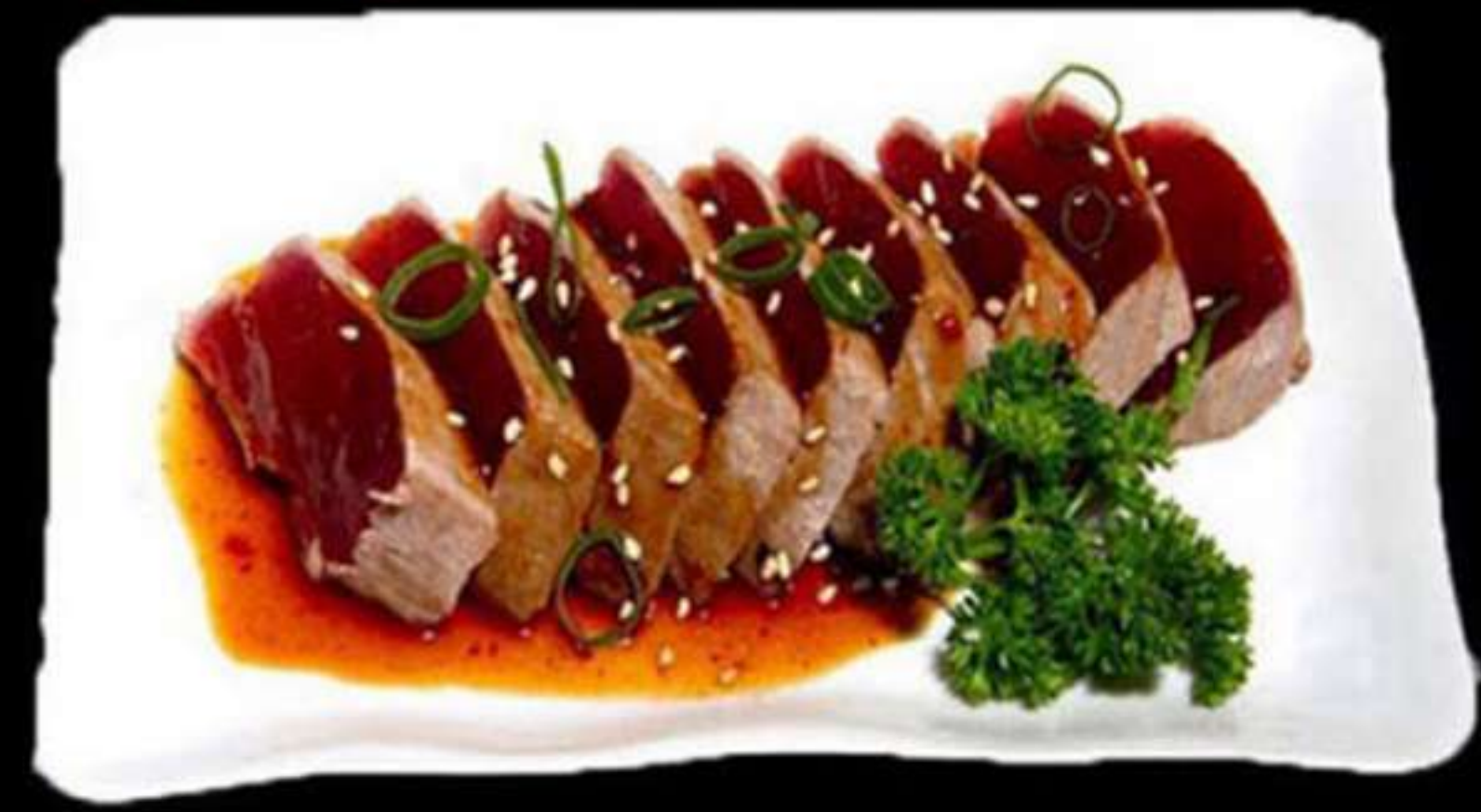
112. TATAKI DE TONYINA (4u)

Tonyina fresc flamejal amb salsa Atún fresco flameado con salsa