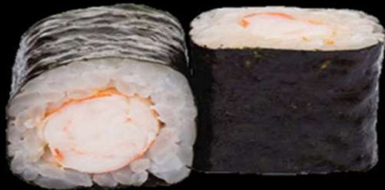
73.MAKI DE GAMBES (4u)