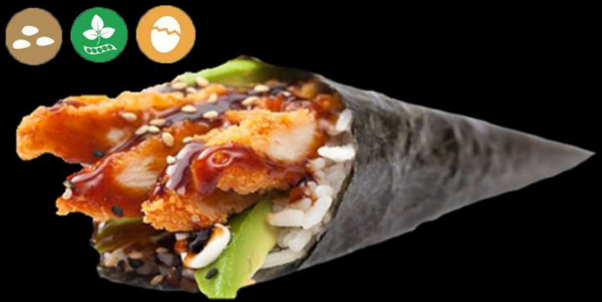
120. TEMAKI DE POLLASTRE