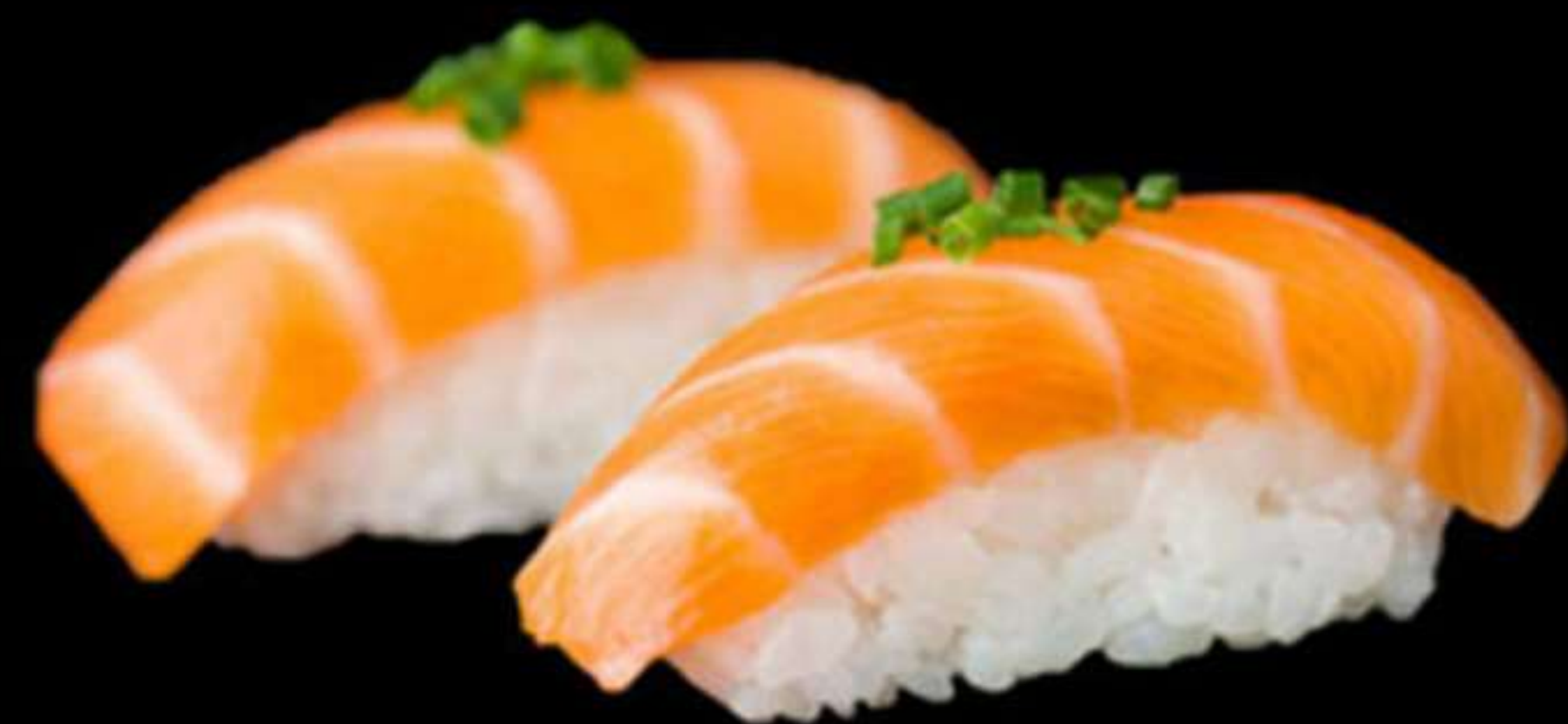
61. NIGIRI DE SALMÓ (2u)