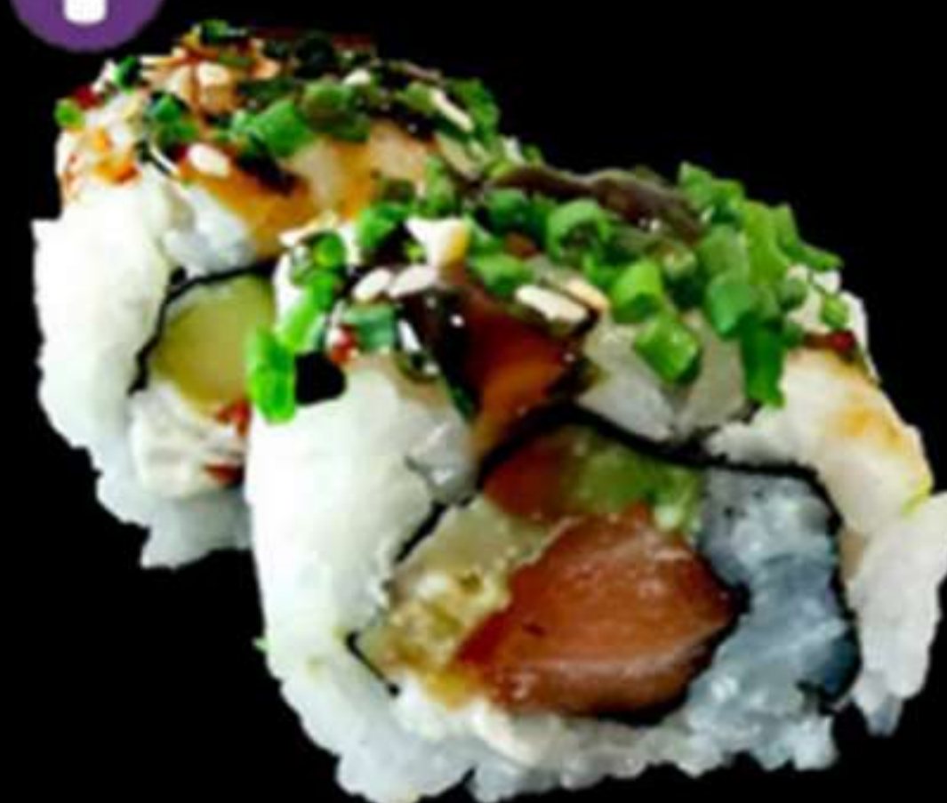
80.HANA MAKI CON CIBOULETTE (4u)

Salmó, alvocat, formatge PHL i ciboulette Salmón, aguacate, queso PHL ciboulette