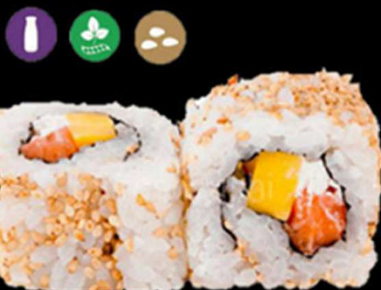
97. URAMAKI DE SALMÓ I MANGO (4u)

Salmó, mango i formatge PHL Salmón, mango y queso PHL