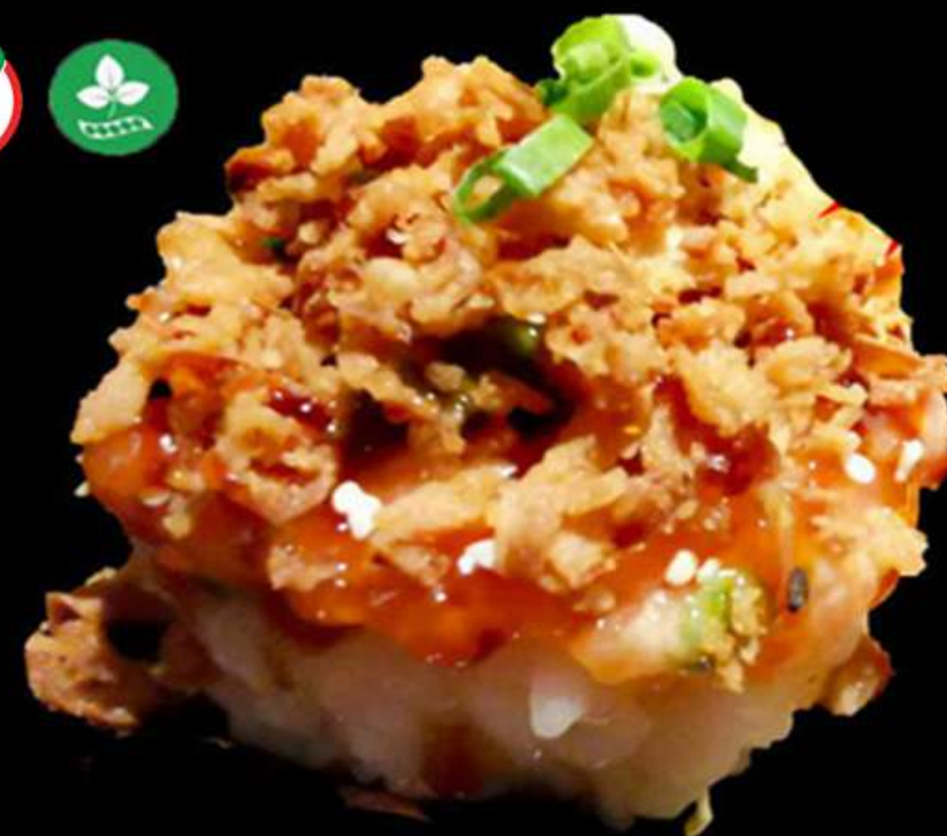
116. TARTA DE SALMÓ CEBÀ FREGIT

Arròs Salmó, alvocat i ceba fregit Arroz, Salmón, aguacate y cebolla frito