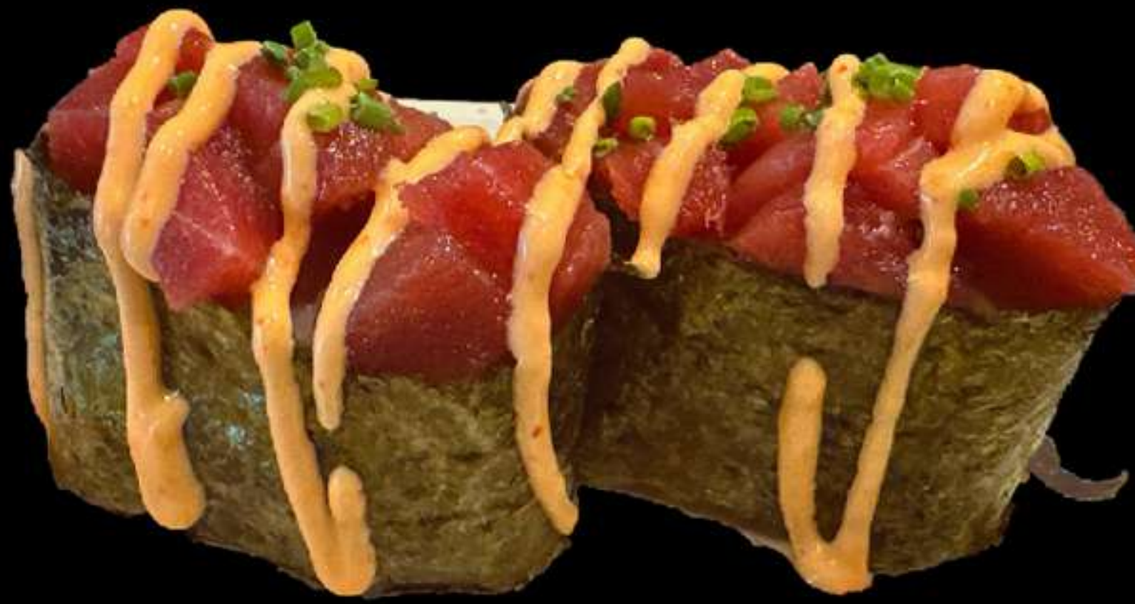
105. GUNKAN DE TUNYINA PICANT(2u)

Tonyina, cebollets, salsa picant Atun, cebollino, salsa picante