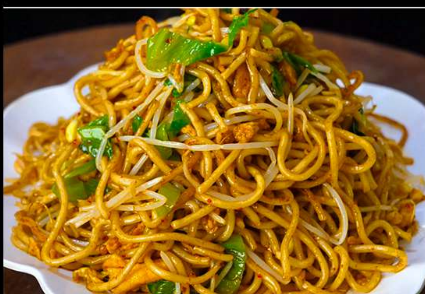
34.YAKISOBA AMB VERDURES/ O AMB VEDELLA

Fideus amb verdures / o amb vedella Fideos con verduras / o con ternera