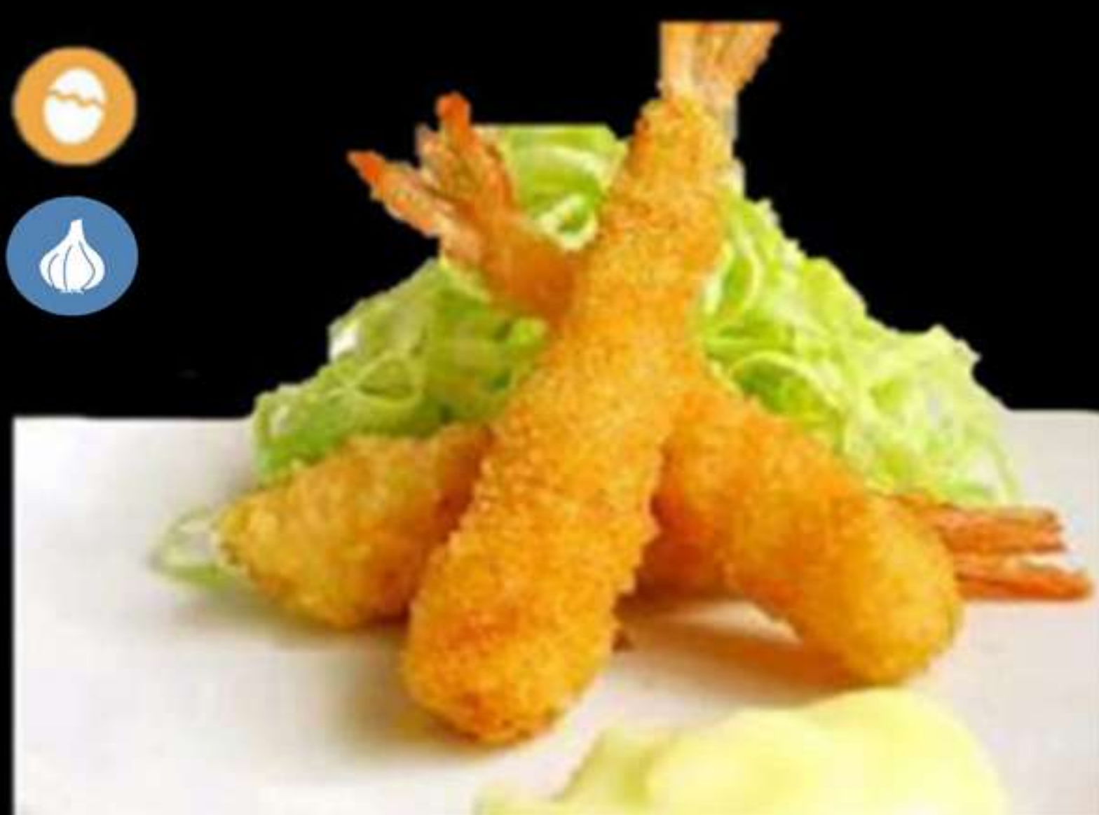
17. LLAGOSSTINS ARREBOSSATS (4u)

Gambes, carn i verdures Gambas, carne y verduras