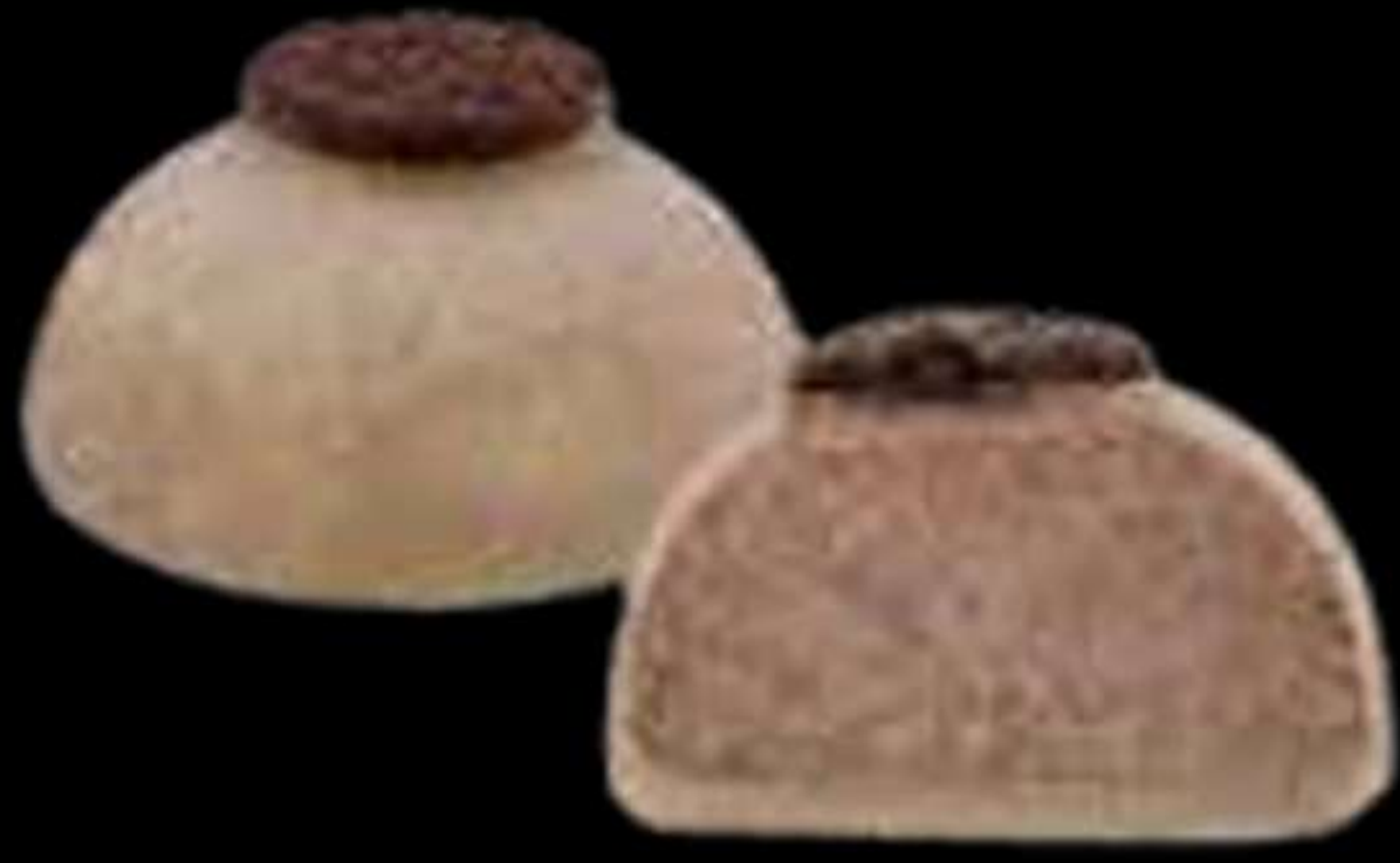
Mochi de oreo..... 4.50€ Mochi d'oreig