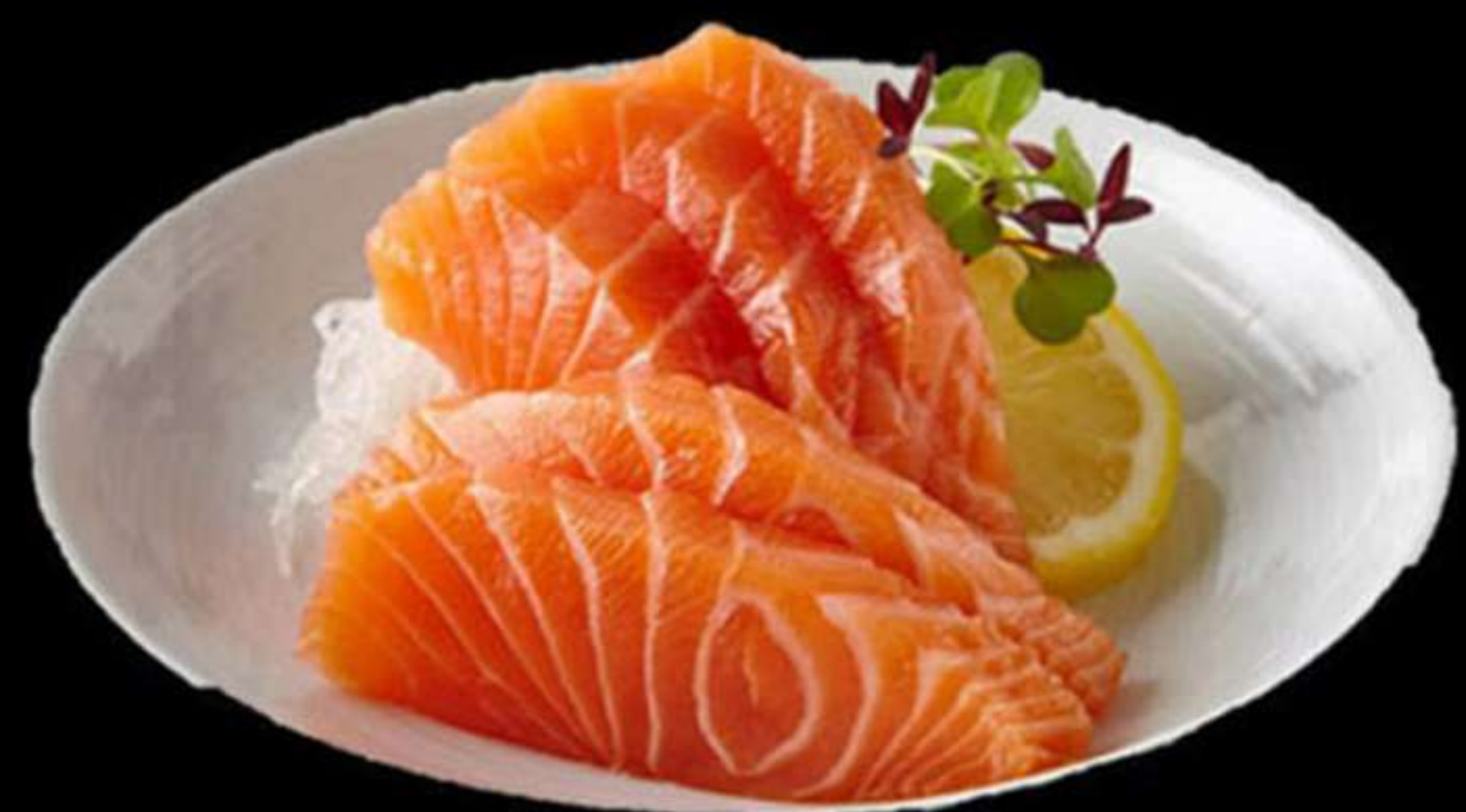
110. SASHIMI DE SALMÓ (4u)