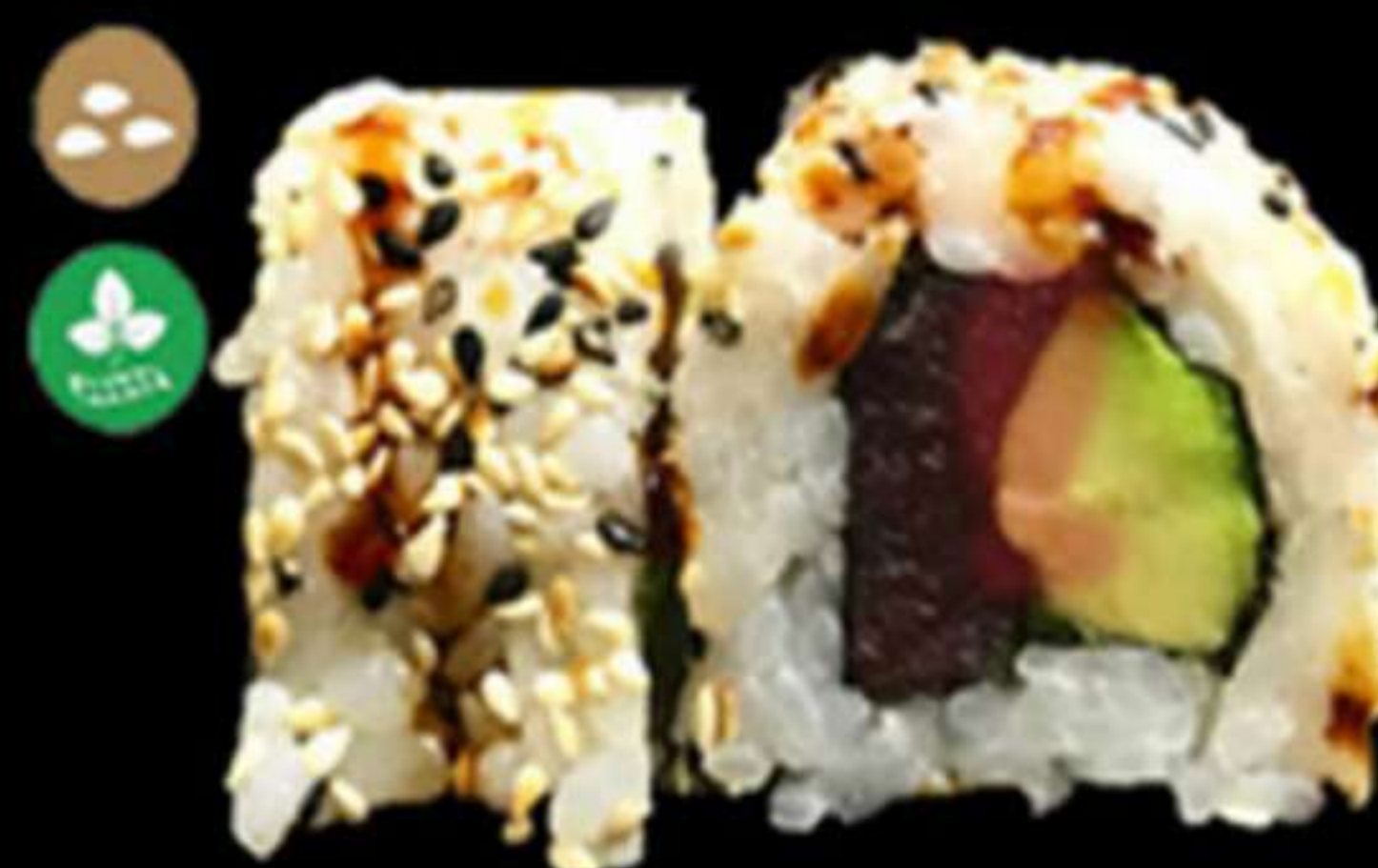
96. URAMAKI DE TONYINA (4u)

Nous, formatge PHL i salmó Nueces, queso PHL y salmón