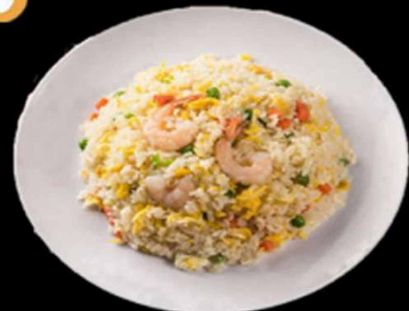
31.ARRÒS AMB GAMBES A LA PLANXA

Arròs, verdures i gambes Arooz, verduras y gambas