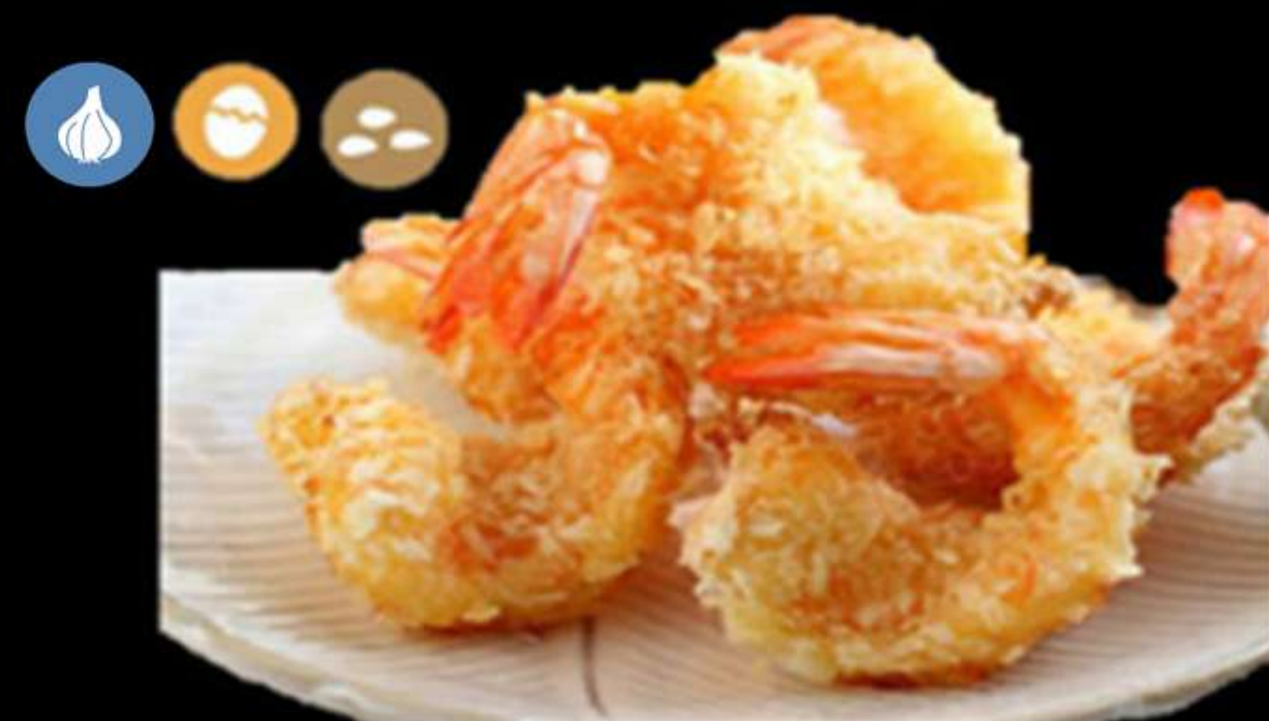
18. GAMBES AMB SÉSAM (4u)

Llagostins, ous, farina i pa ratllat Langostino, huevo, harina y pan rallado