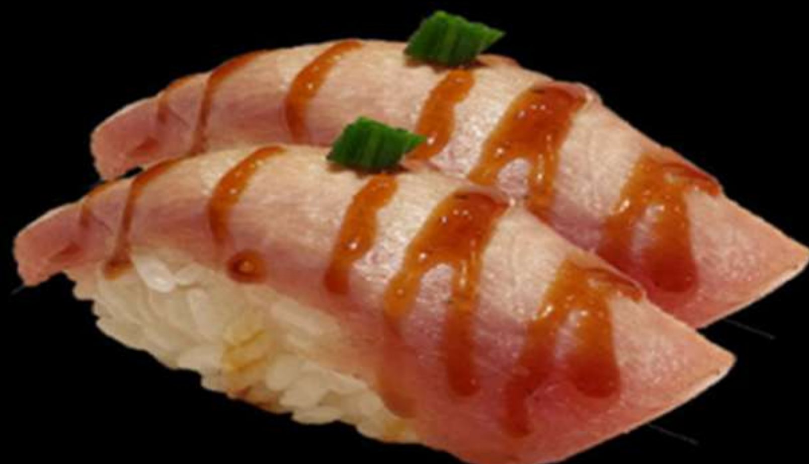
68.NIGIRI DE TONYNA FLAMEJAT (2u)

Nigiri de tonyina flamejar Nigiri de atún flameado