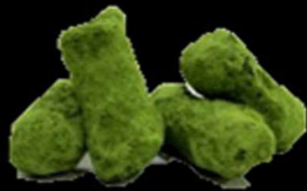
Trufa de te verd..... 4.50€ Trufa de te verde