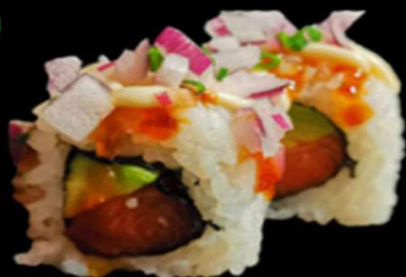
79.CEBA VERMELL ROLL (4u)

Salmó, alvocat i ceba Salmón, aguacate y cebolla