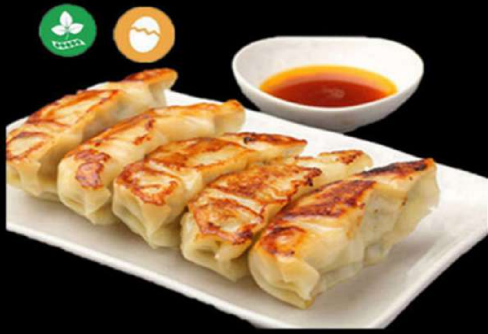
10. GYOZA DE POLLO Ó DE VERDURAS (4u)