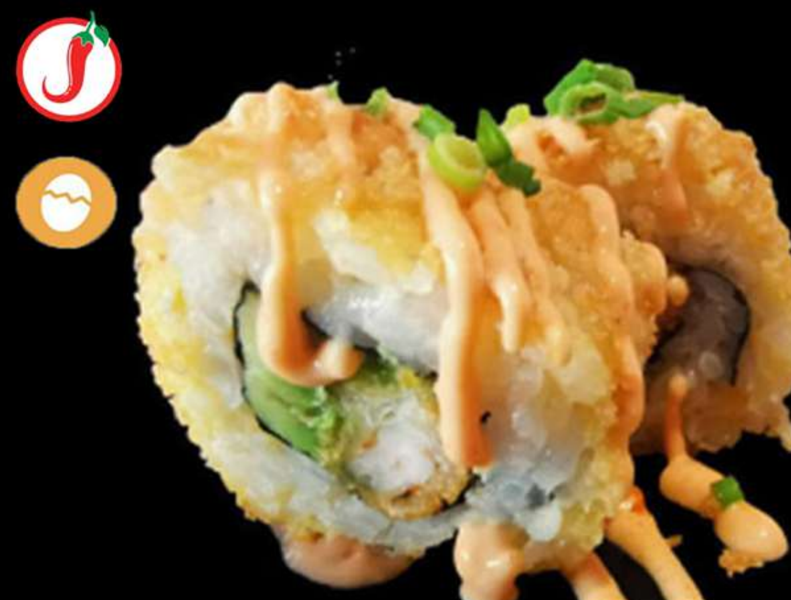
102. URAMAKI LLAGOSTIN FREGIT (4u)

Salmó, alvocat i formatge PHL Salmón, aguacate y queso PHL