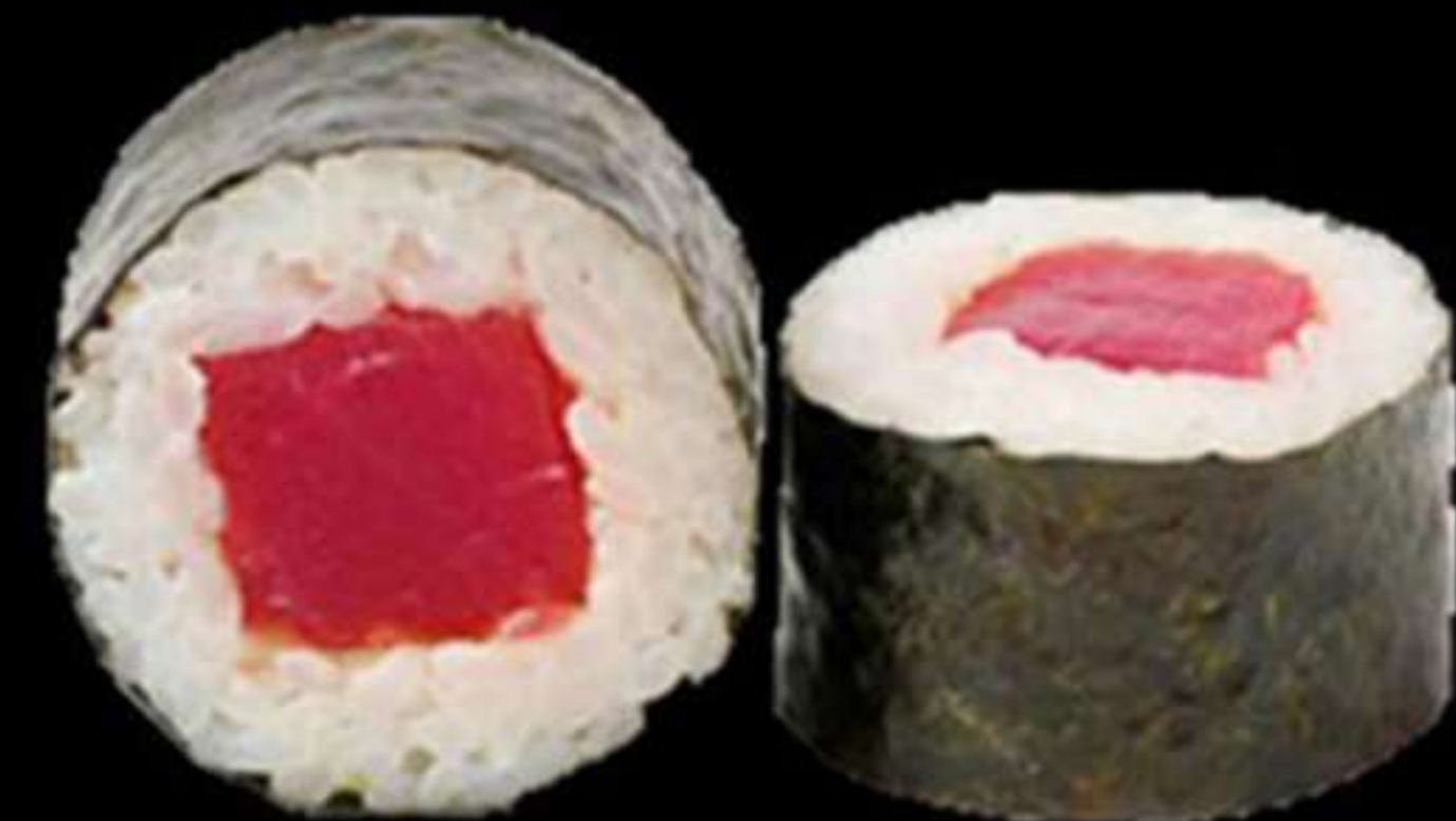
72. MAKI DE TONYINA (4u)