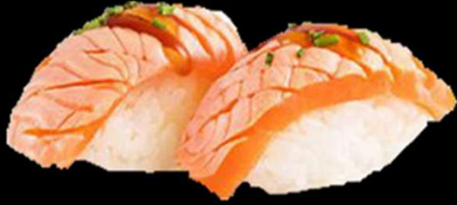
67. NIGIRI DE SALMÓ FLAMEJAT (2u)

Nigiri de salmó flamejar Nigiri de salmón flameado