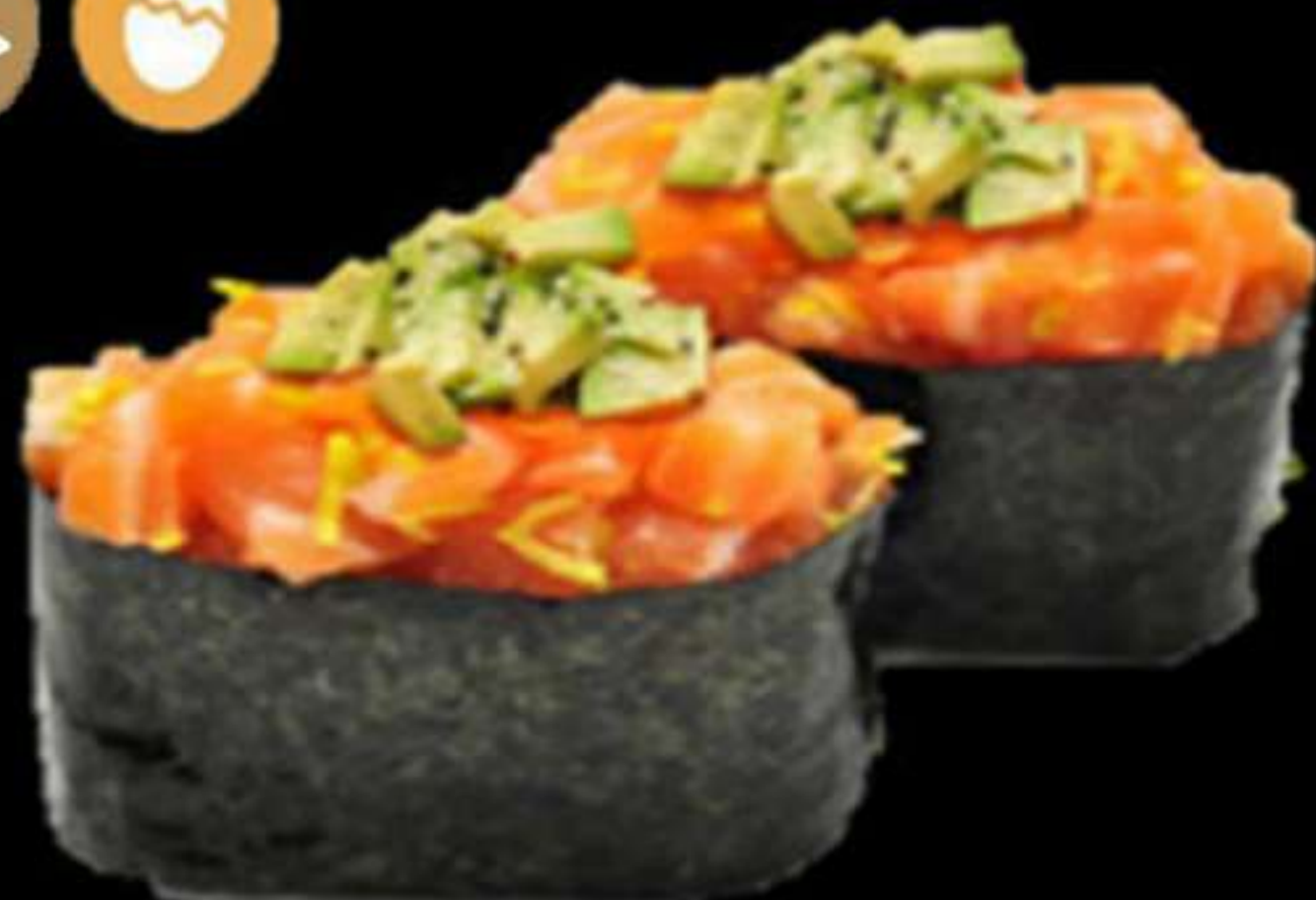
108. GUNKAN DE SALMÓ (2u)