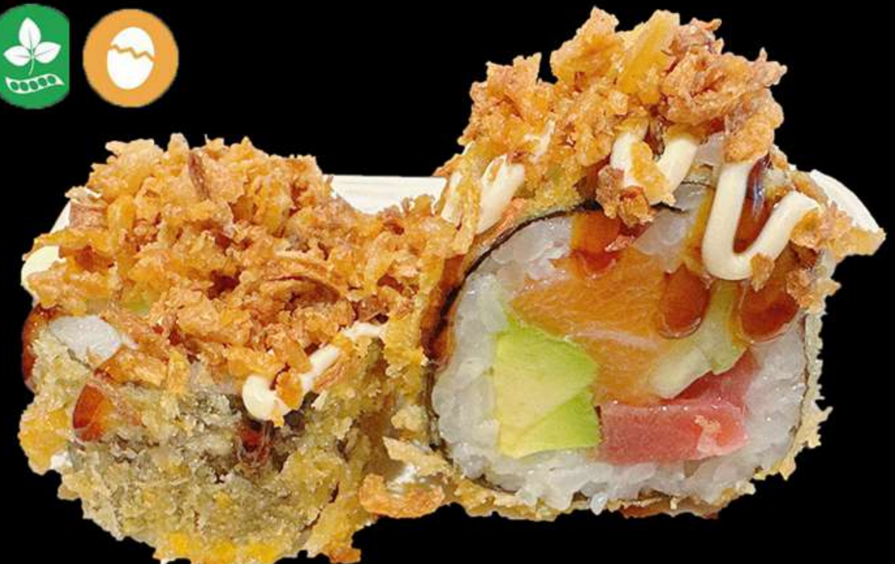
128.FOTOMAKI FREGIT AMB CEBA FREGIT(5u)

Salmò, tonyina, alvocat i ceba fregit Salmon, atun, aguacate y cebolla frita