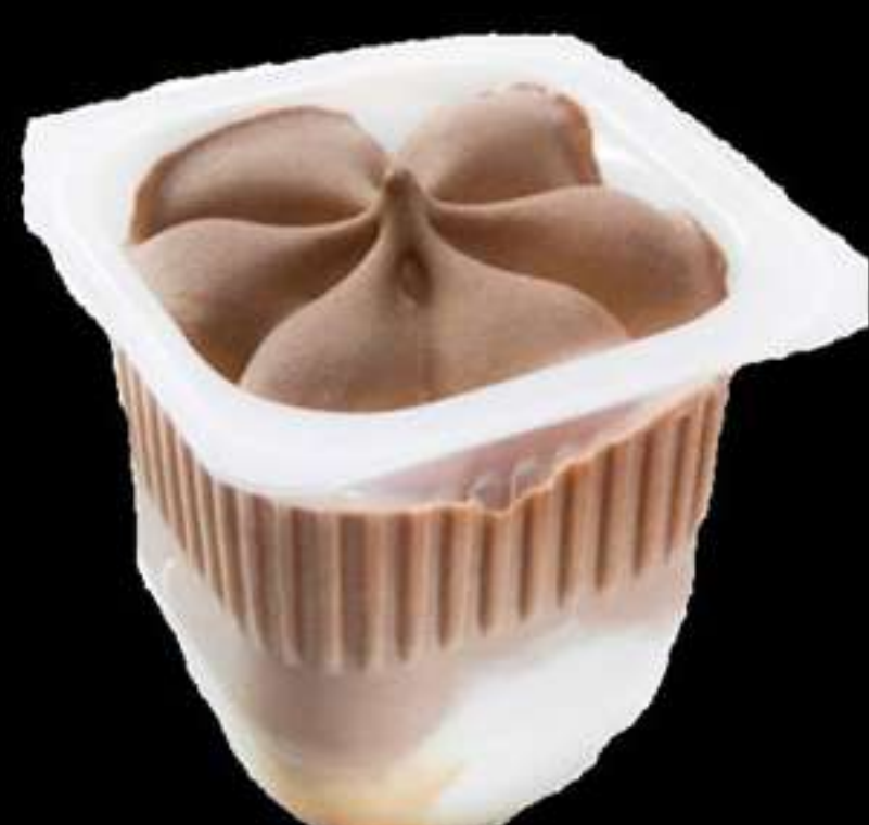
Gelat(vainilla, maduixa, xocolata, llimona)... 1.65€ Helado(vainilla, freesa, chocolate, limon)