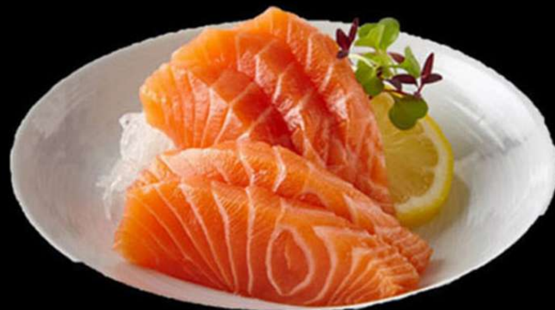
110. SASHIMI DE SALMÓ (4u)