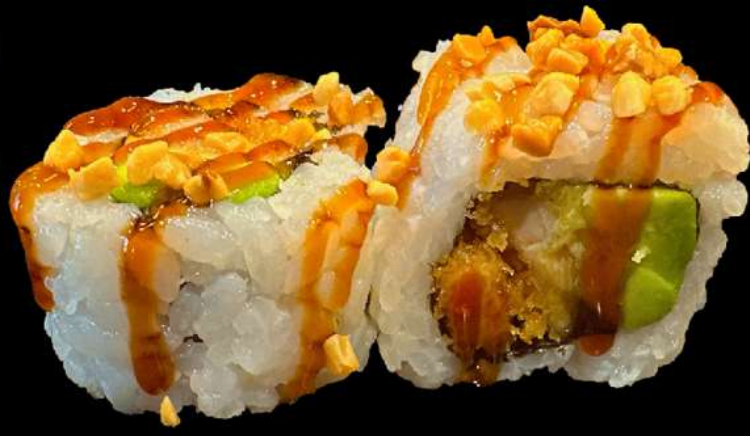
93. URAMAKI DE POLLASTRE. (4u)

Pollastre arrebossat, alvocat i ametlles Pollo rebozado, aguacate y allmendras