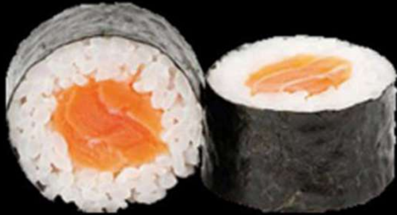
71. MAKI DE SALMÓ (4u)

Salmò, ous, i nabiu Salmon, huevo y arándano