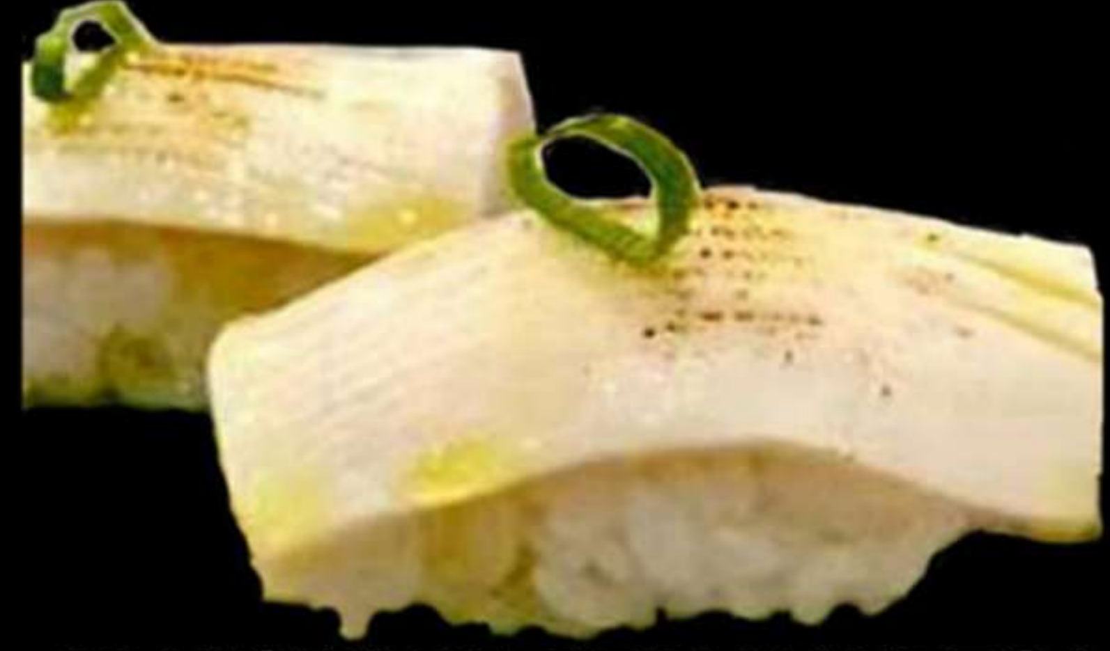
69. NIGIRI DE PEIX MANTEGA FLAMEJAT (2u)

Nigiri de peix mantega flamejar Nigiri de pez matequilla flameado