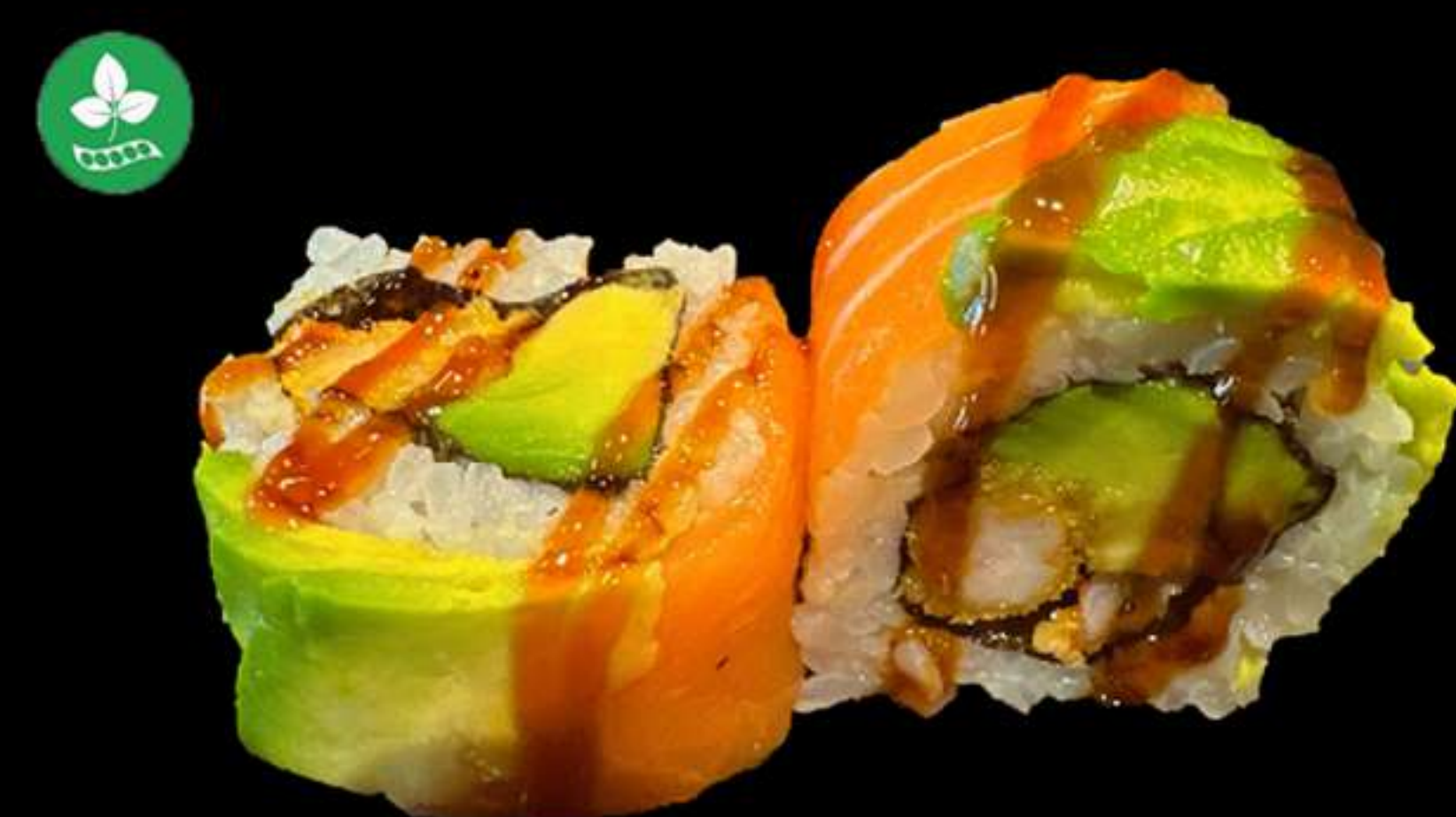
87. URAMAKI DE SANT MARTÍ (4u)

Llagostins, alvocat, salmó y plátan fregit Langostinos, aguacate, salmón y plátano frito