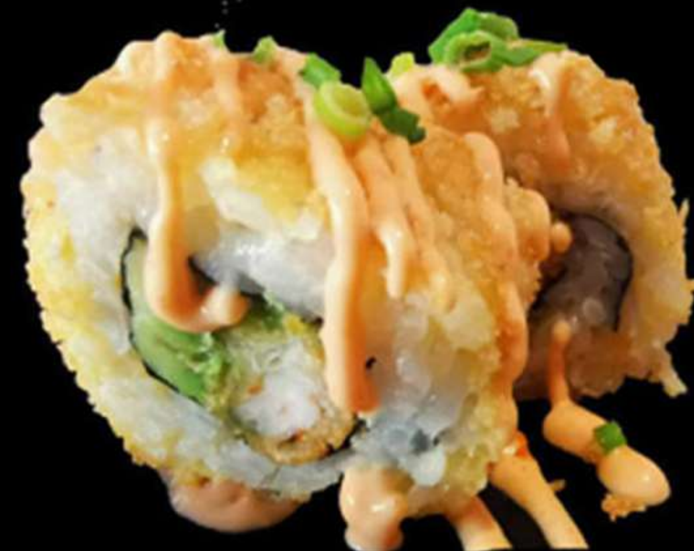
102. URAMAKI LLAGOSTIN FREGIT (4u)

Llagostins, alvocat i salsa picant Langostinos, aguacate y salsa picante