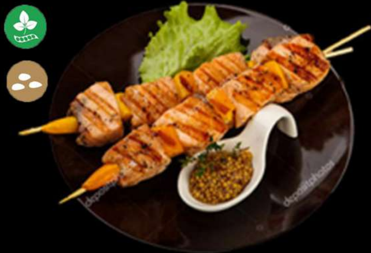
57. BROQUETES DE SALMÓ (2u)

Salmó amb salsa teriyaki Salmón con salsa teriyaki