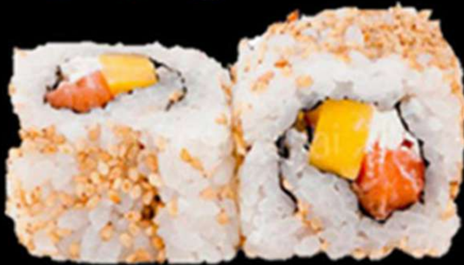
97. URAMAKI DE SALMÓ I MANGO (4u)

Salmó, mango i formatge PHL Salmón, mango y queso PHL