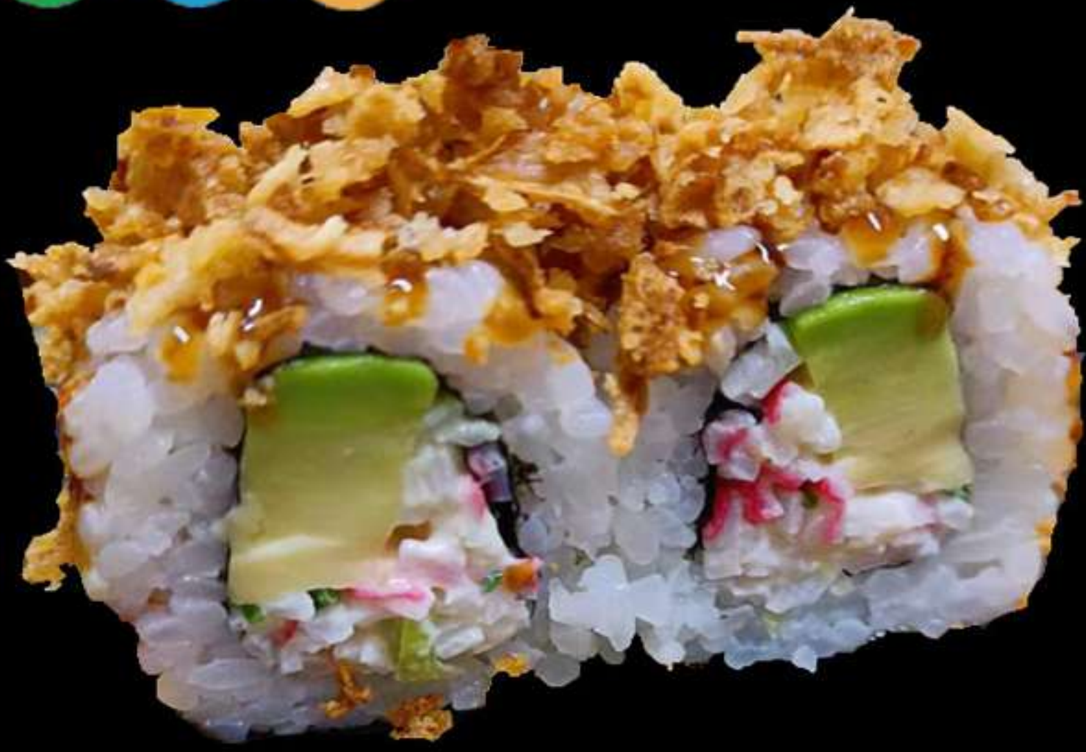
122.CALIFORNIA MAKI CEBA FREGIT(4u)

Cranc, alvocat i ceba fregit Cangrejo, aguacate y cebolla frita