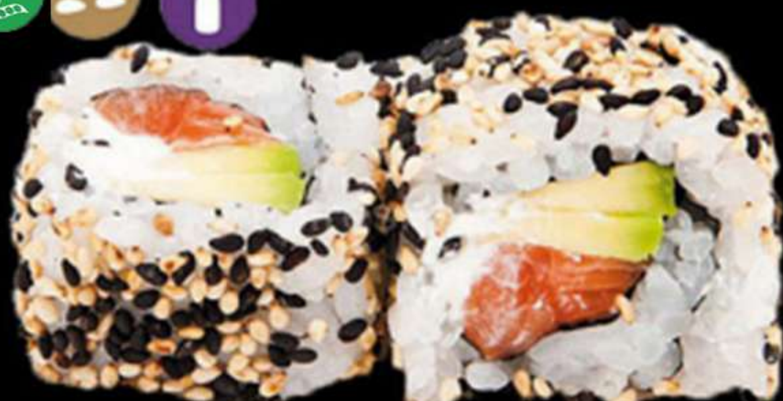
81.HANA MAKI (4u)