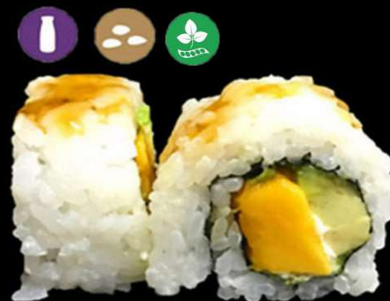
90. URAMAKI DE FRUITES (4u)

Llagostins, alvocat i salmó Langostinos, aguacate y salmón