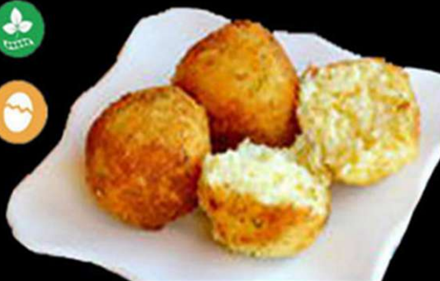
65. BOLES DE ARRÒS FREGIDES (2u)

Arròs de sushi fregit Arroz de sushi frita