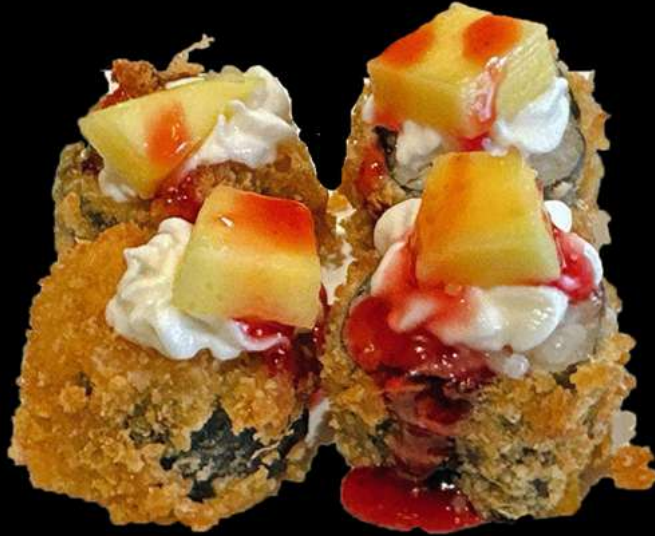
70. MAKI SALMÒ FREGIT AMB MANGO(4u)

Salmò, ous, y mango Salmon, huevo y mango