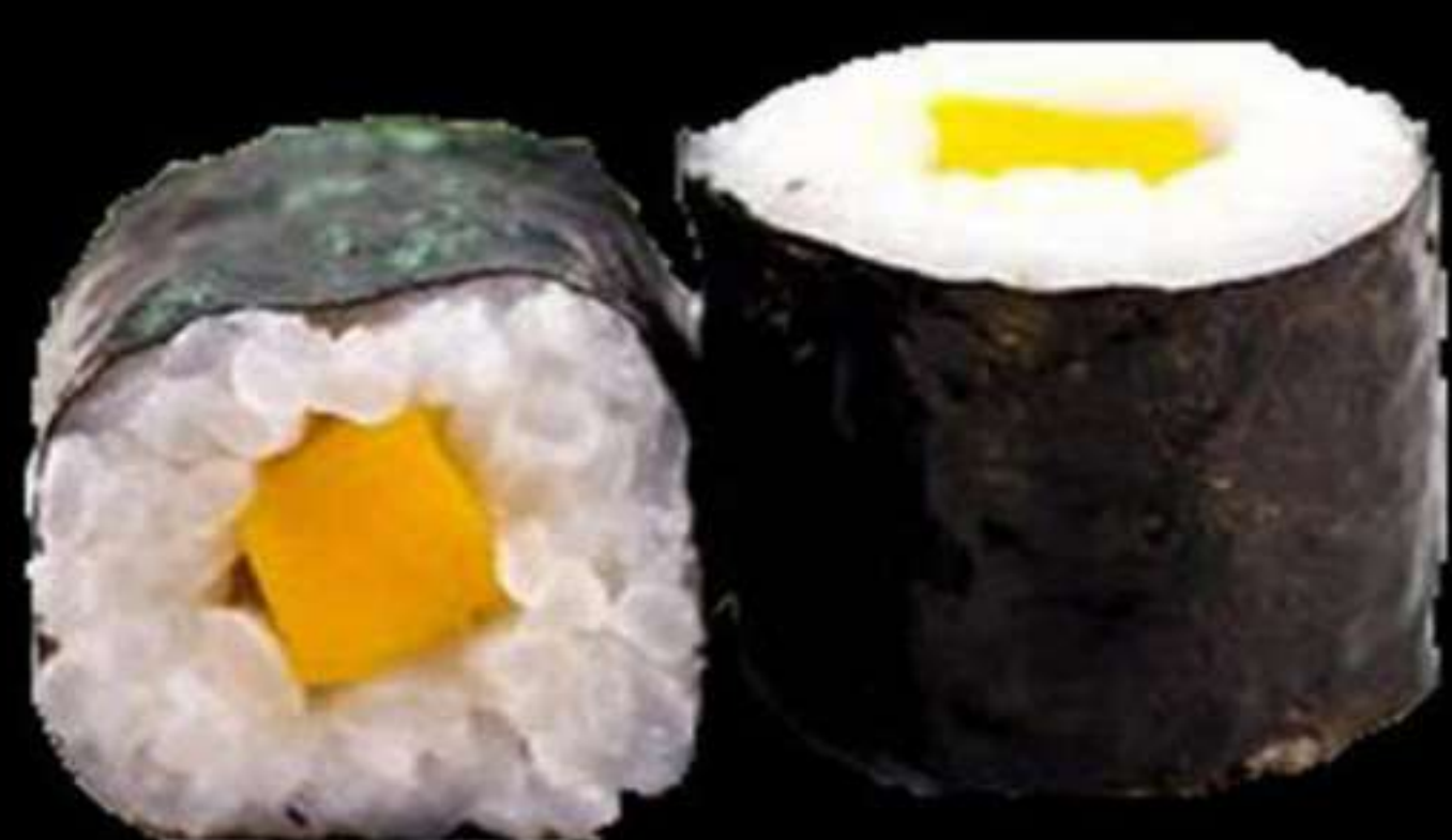
75.MAKI DE MANGO (4u)