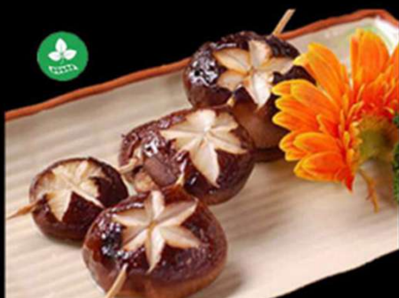
59. BROQUETES DE BOLETS (2u)

Gambes amb salsa de marisc Gambas con salsa de marisco