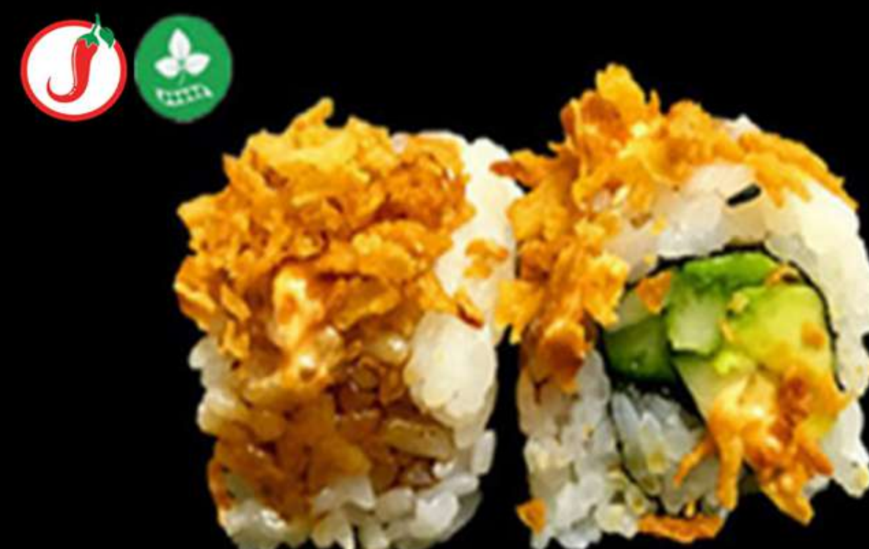
92. URAMAKI DE CEBÀ FREGIT (4u)

Salmó, ciboulette i salsa picant Salmón, ciboulette y salsa picante