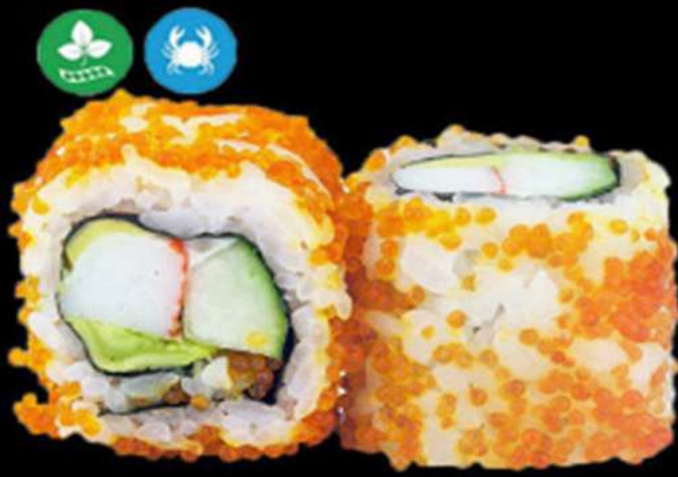
84. CALIFORNIA DE CRANC (4u)

Alvocat, surimi i tobiko Aguacate, surimi y tobiko