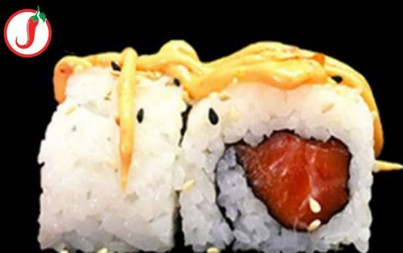
91. URAMAKI DE SALMÓ PICANT (4u)

Alvocat, mango i formatge PHL Aguacate, mango y queso PHL