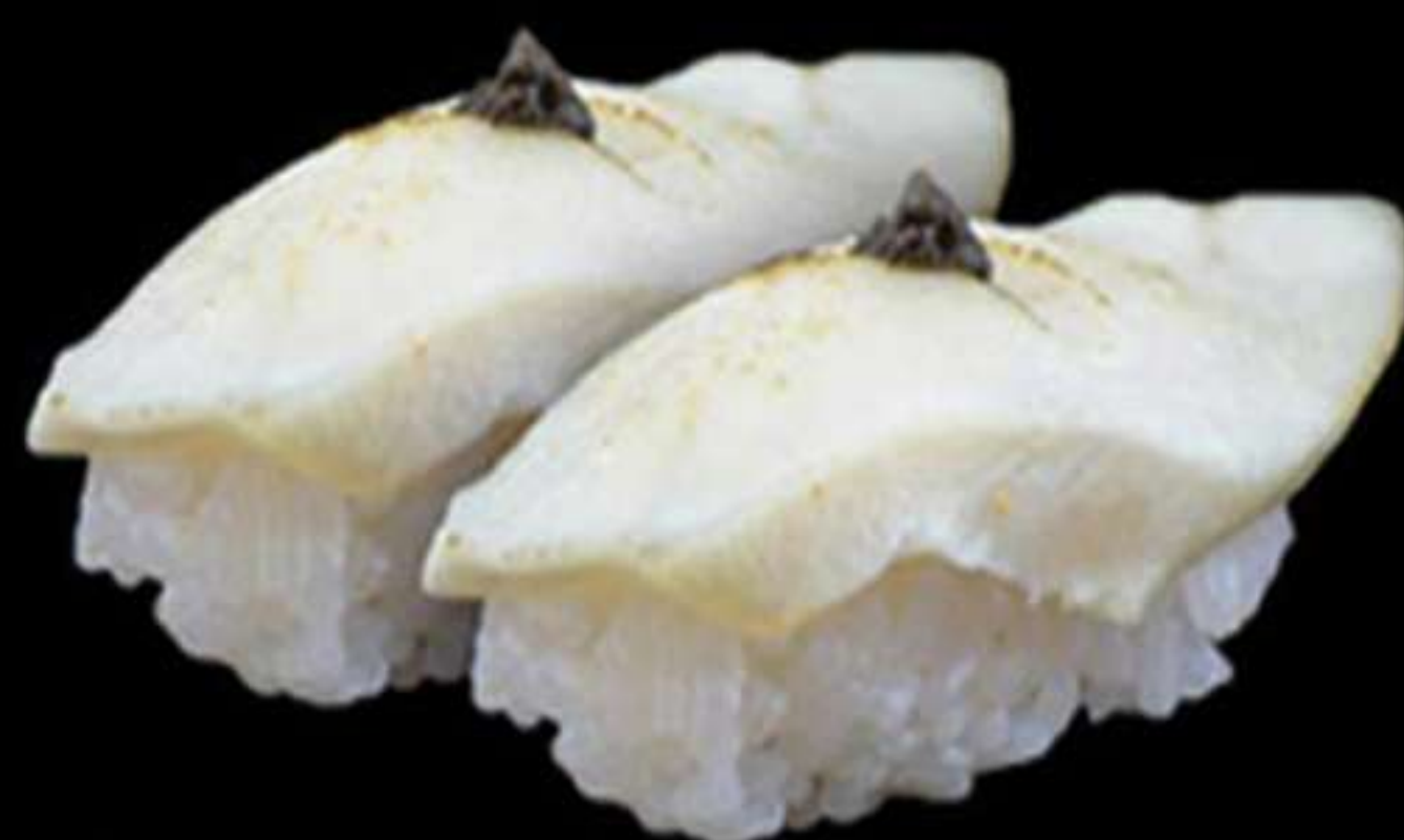
64. NIGIRI DE PIEX MANTEGA (2u)