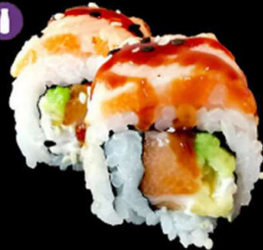
99. HANA MAKI SALMÓN FRAMEJAT (4u)

Salmó, alvocat i formatge PHL Salmón, aguacate y queso PHL