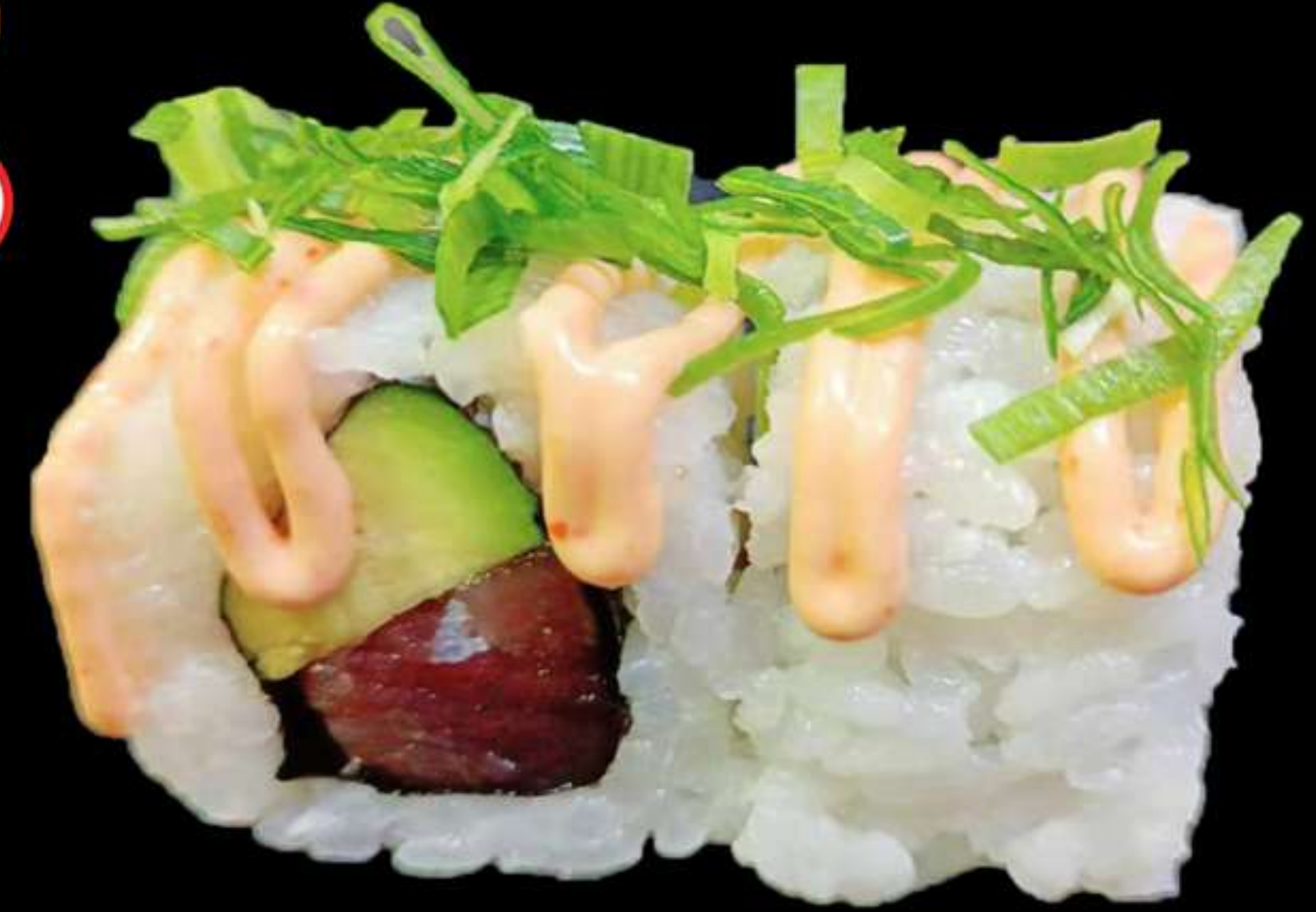
124.URAMAKI TONYINA PICANT(4u)

Tonyina, alvocat ciboulet i salsa picant Atun, aguacate, ceboullete y salsa picante