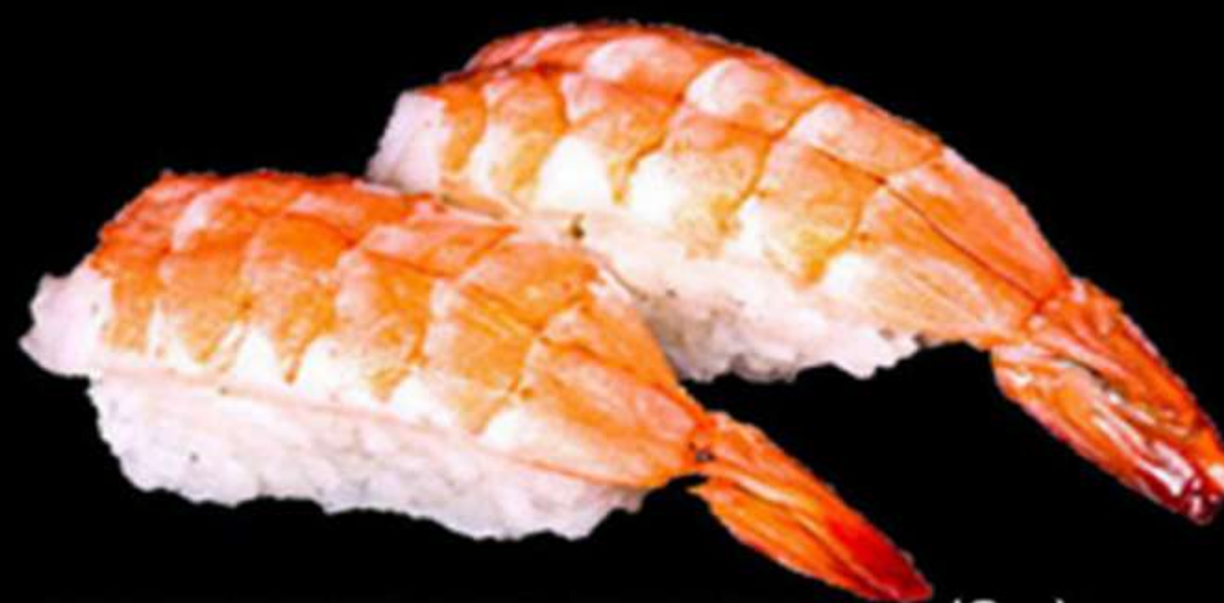
63. NIGIRI DE GAMBES (2u)