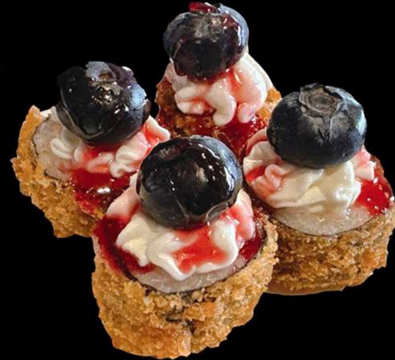
70A. MAKI SALMÒ FREGIT AMB NABIU(4u)

Salmò, ous, i nabiu Salmon, huevo y arándano