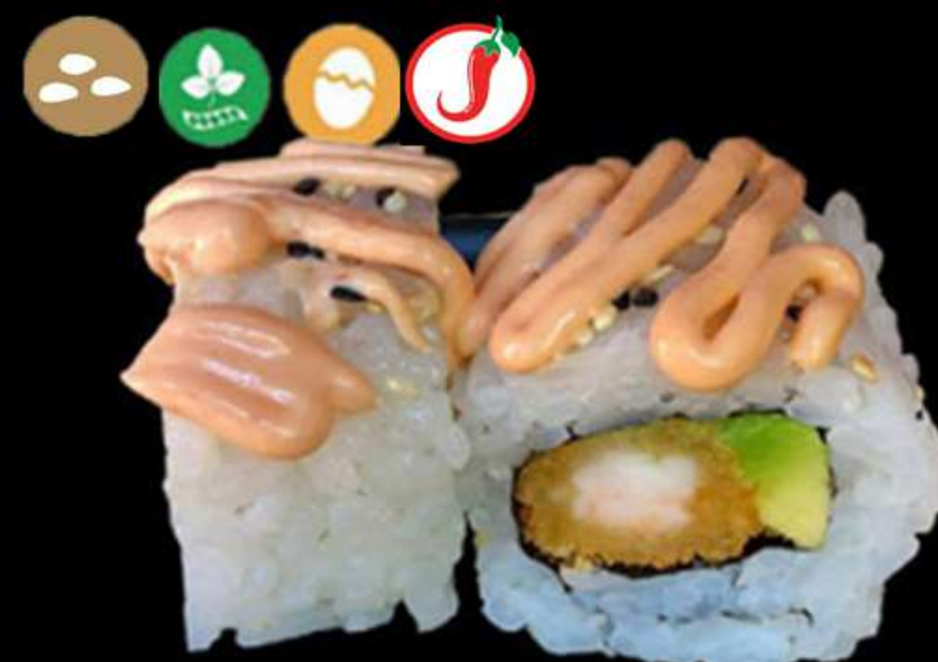
85. URAMAKI TOKIO (4u)

Alvocat, surimi i tobiko Aguacate, surimi y tobiko