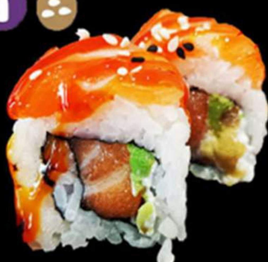
77.HANA MAKI SALMÓ SÈSAM (4u)