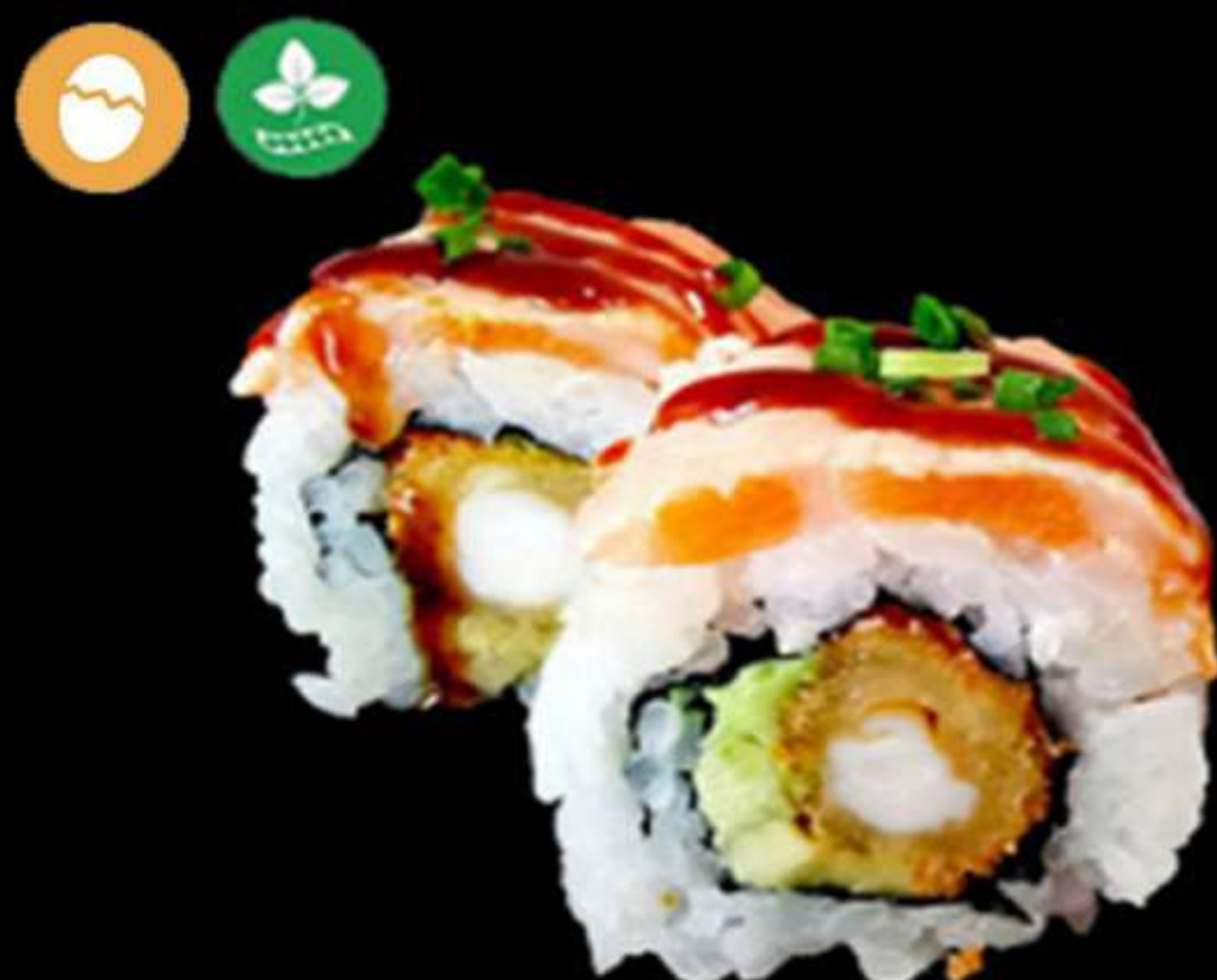
89. URAMAKI DE LLAGOSTINS CON SALMÓ FLAMEJAT (4u)

Llagostins, alvocat i salmó Langostinos, aguacate y salmón