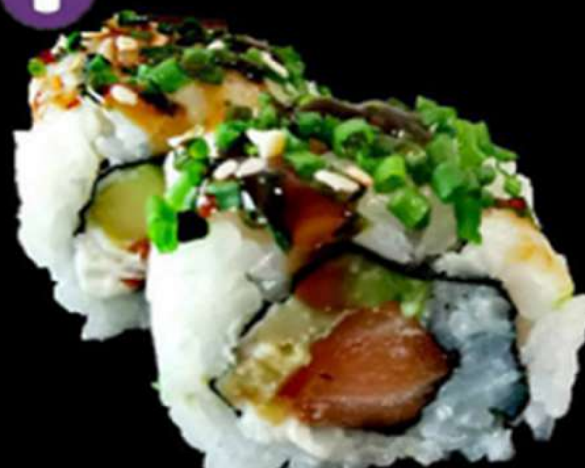
80.HANA MAKI CON CIBOULETTE (4u)

Salmó, avocat, formatge PHL i ciboulette