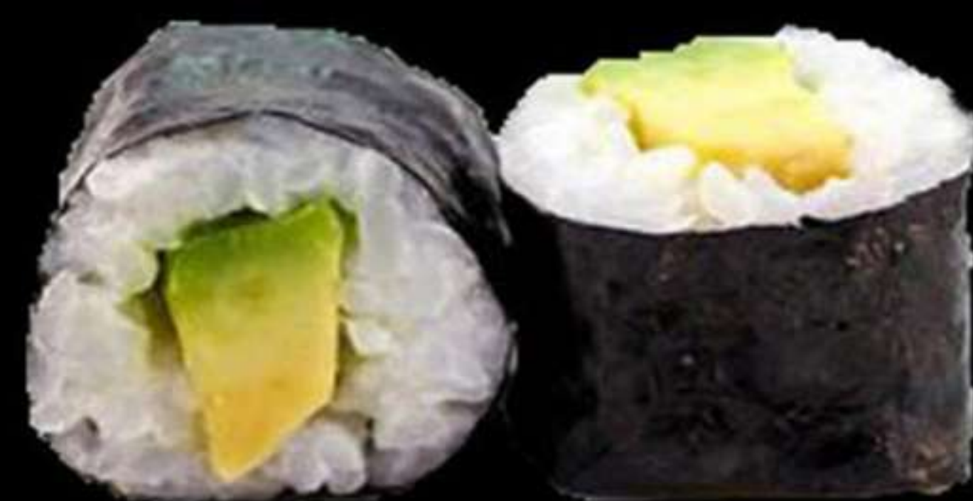
74. MAKI DE ALVOCAT (4u)