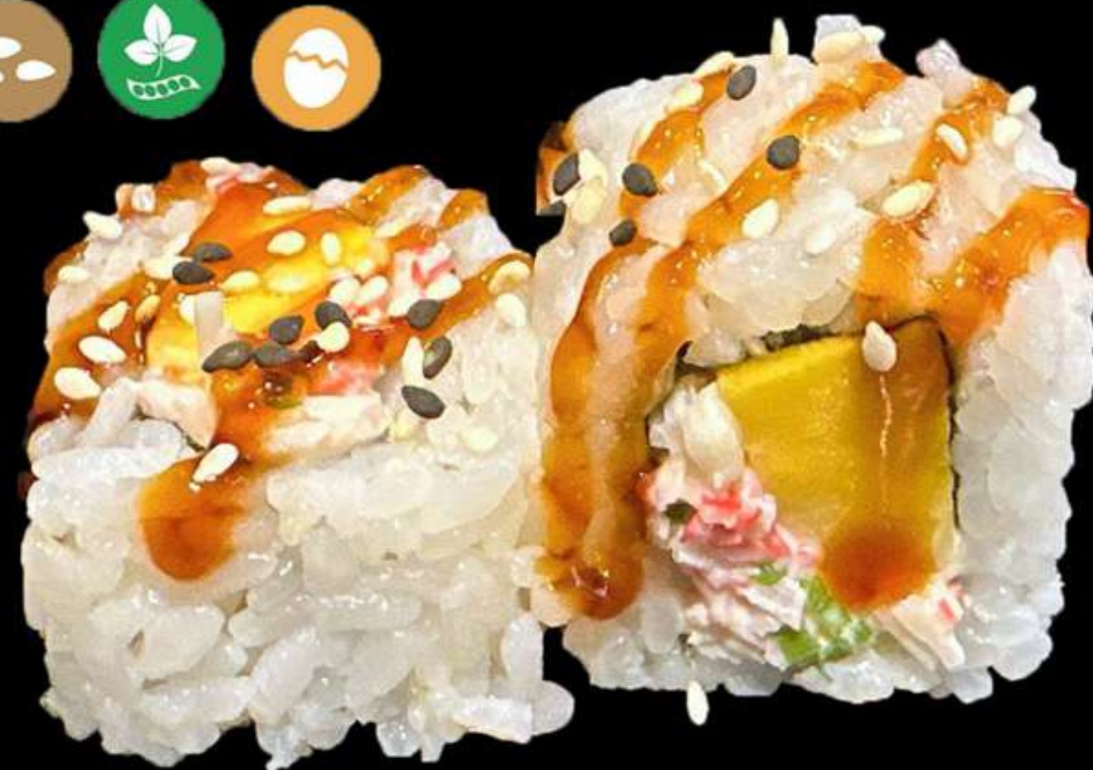
126.URAMAKI SURIMI MANGO(4u)