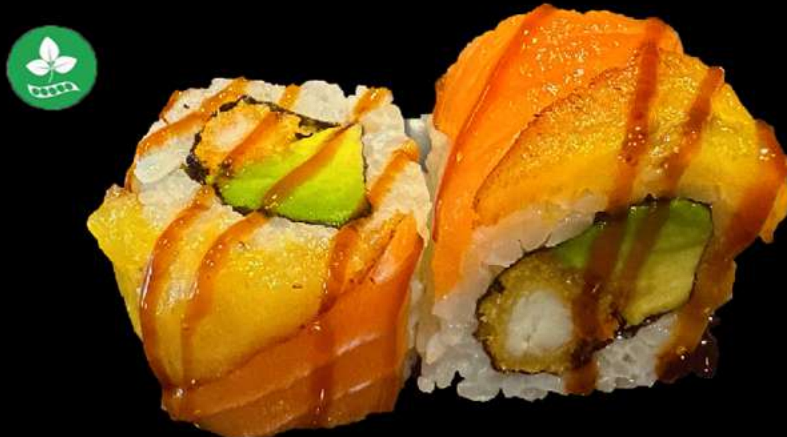
86. URAMAK DRAC (4u)

Llagostins, alvocat i salsa picant Langostinos, aguacate y salsa picante