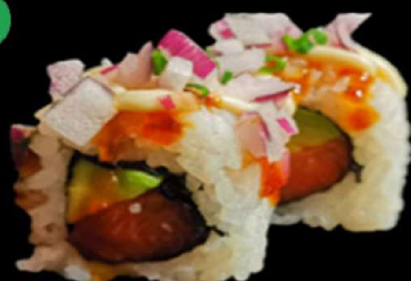
79.CEBÀ VERMELL ROLL (4u)