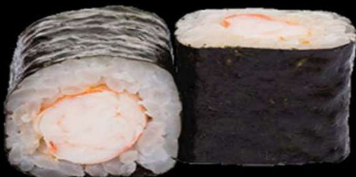
73. MAKI DE GAMBES (4u)