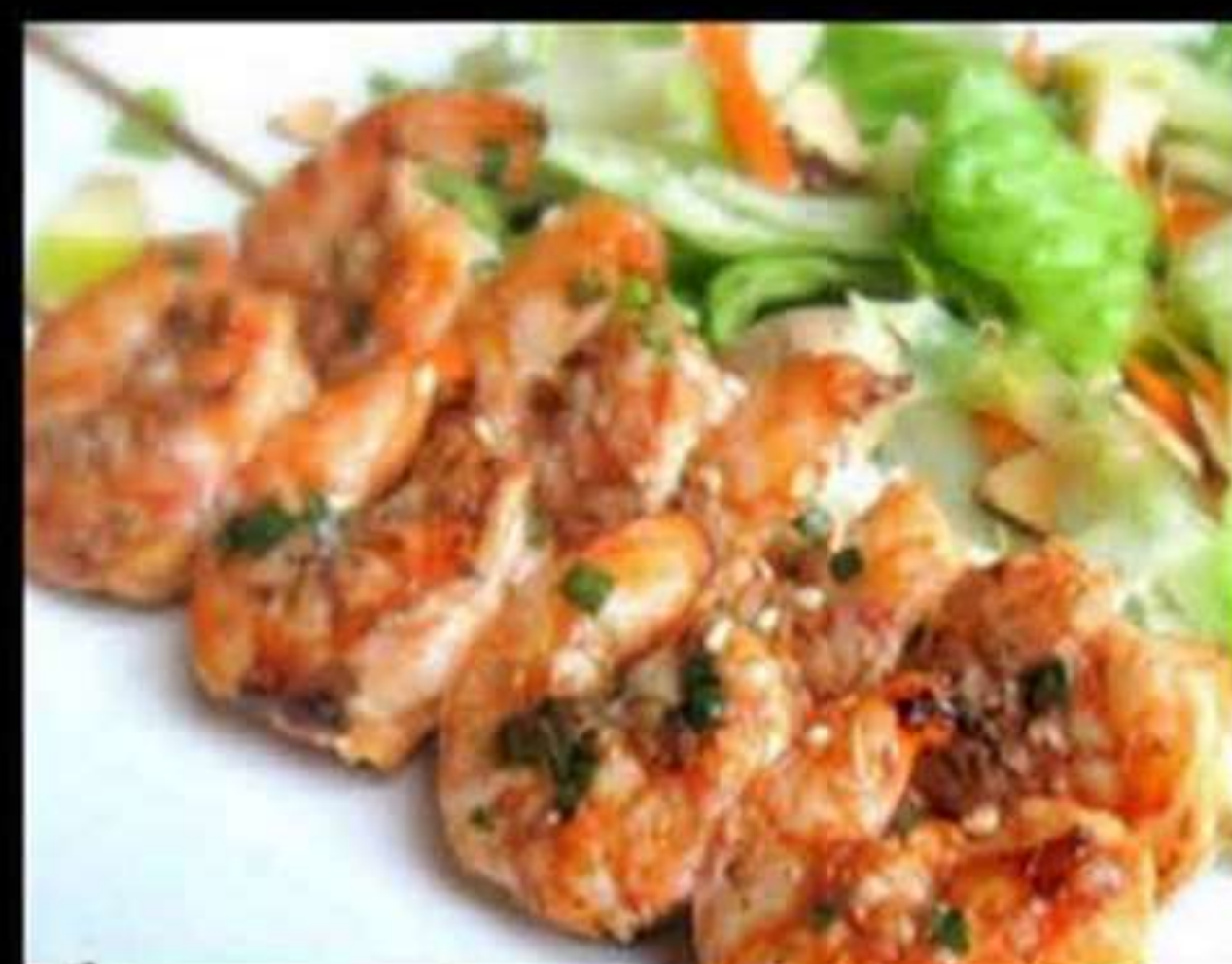
58. BROQUETES DE GAMBES (2u)

Gambes amb salsa de marisc Gambas con salsa de marisco