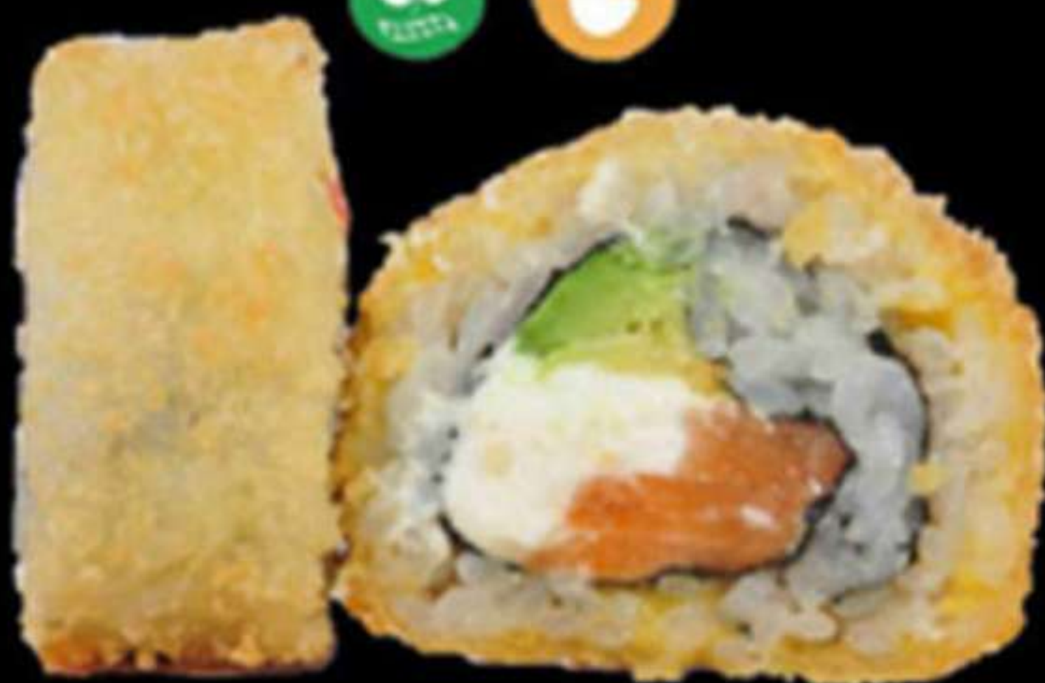
101. HANA MAKI FREGIT (4u)

Salmó, alvocat i formatge PHL Salmón, aguacate y queso PHL