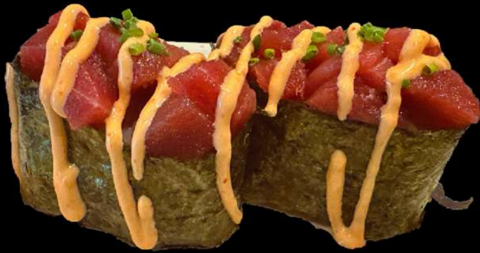
105. GUNKAN DE TUNYINA PICANT(2u)

Tonyina, cebollets, salsa picant Atun, cebollino, salsa picante