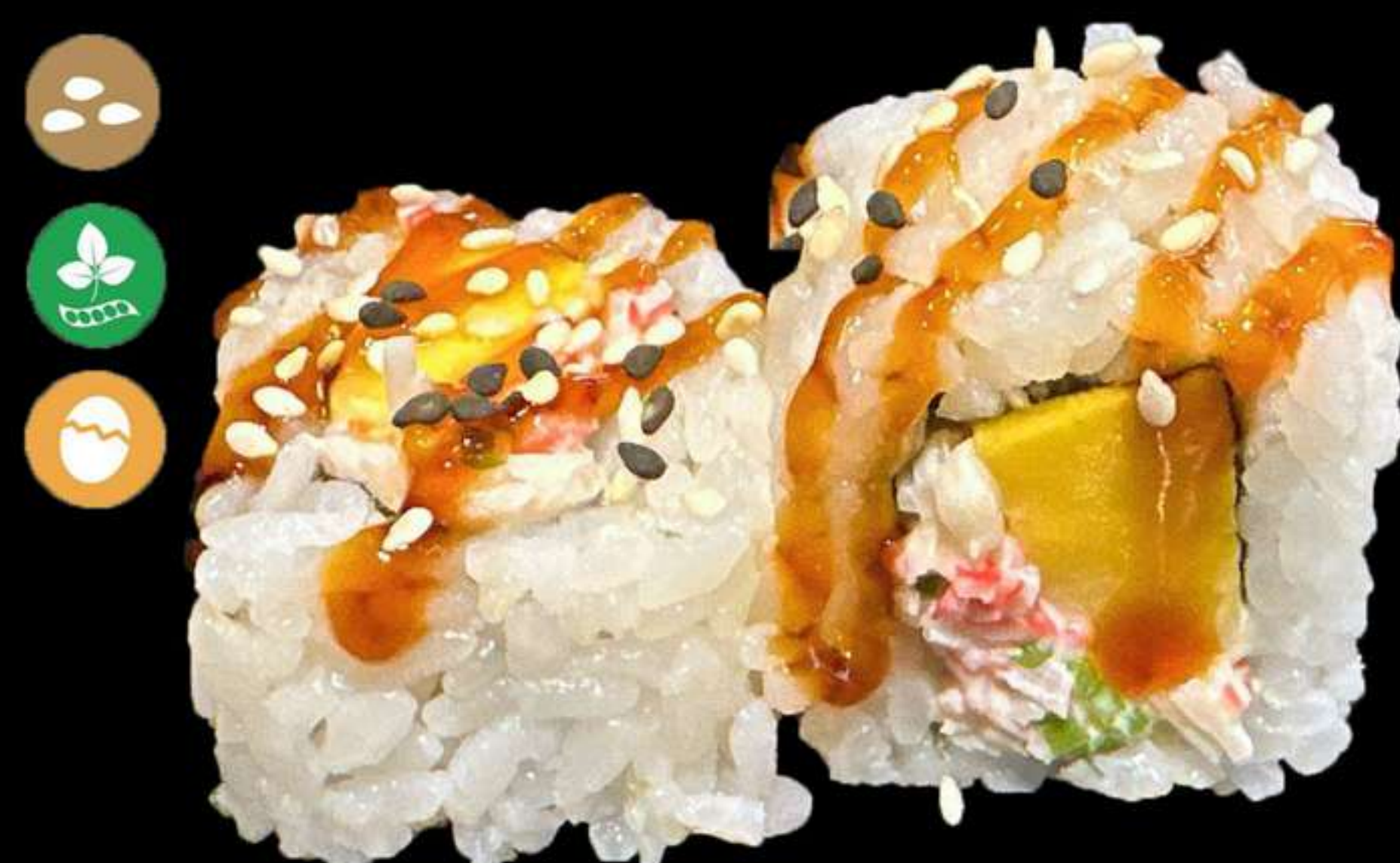
126. URAMAKI SURIMI MANGO(4u)

Salmò, cogombre i tobiko Salmon, pepino y tobiko