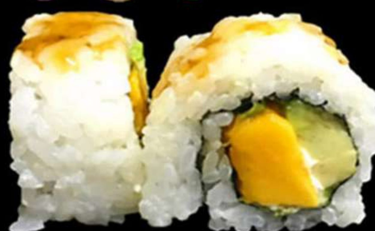
90. URAMAKI DE FRUITES (4u)

Avocat, mango i formatge PHL Aguacate, mango y queso PHL