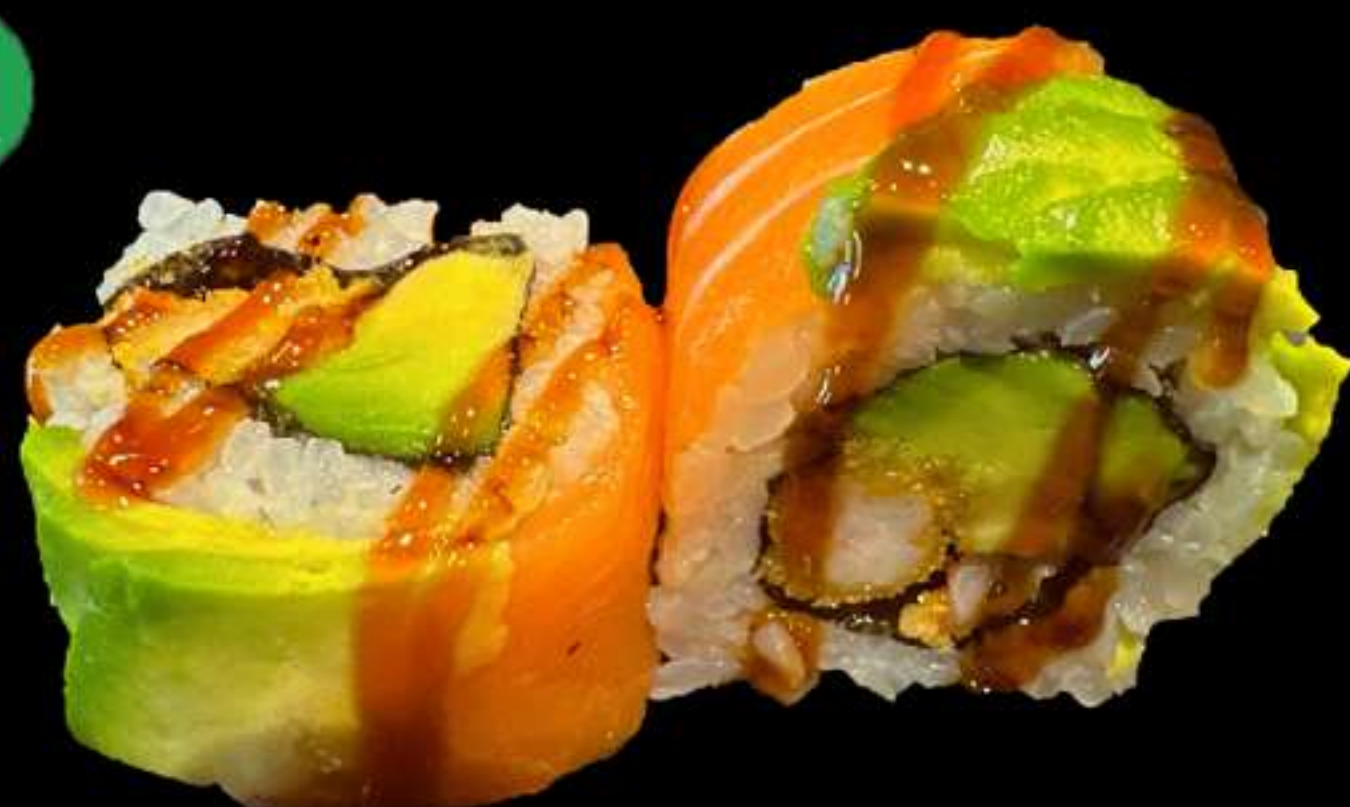
87. URAMAKI DE SANT MARTÍ (4u)

Llagostins, avocat i salmó Langostinos, aguacate y salmón