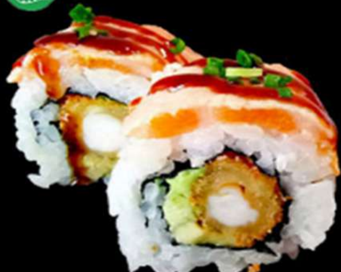
89. URAMAKI DE LLAGOSTINS CON SALMÓ FLAMEJAT (4u)

Llagostins, avocat i salmó Langostinos, aguacate y salmón