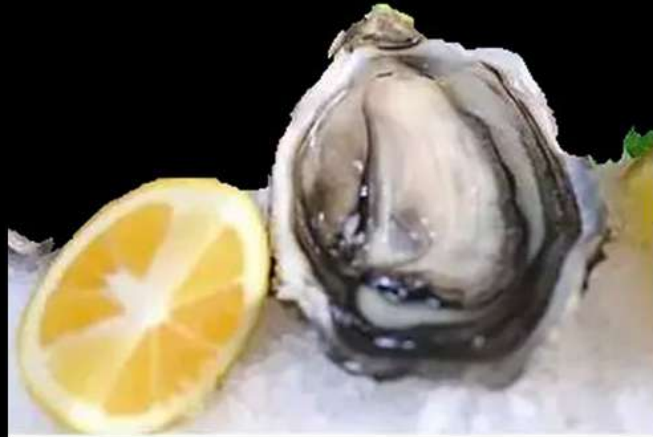
60. OSTRON (1u)